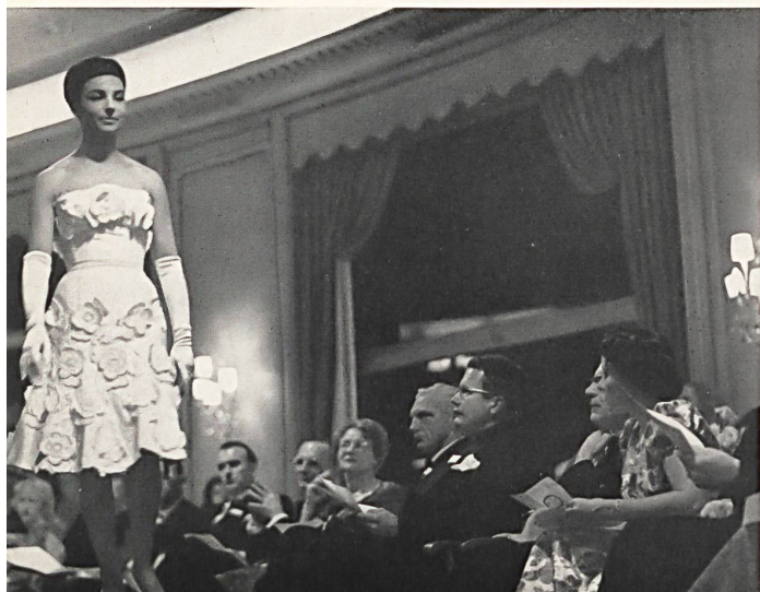
Pendant le défilé. During the presentation. Durante el desfile. Während der Vorführung.

Anfühlen, ihre Knitterfestigkeit zu geben und zahlreiche andere charakteristische Merkmale, wie auch die Verfahren, ohne welche die Erzeugung von Stickereien nicht möglich wäre: das Bleichen, das Karbonisieren usw. Die zahlreichen technischen Erklärungen, die bei dieser Gelegenheit vermittelt wurden, hoben die bedeutende Rolle hervor, welche die schweizerische Hochveredelungsindustrie bei der Textilfabrikation spielt, indem sie dieser die Möglichkeit verschafft ihren überlieferten Qualitätsstand gegenüber der ausländischen Konkurrenz aufrechtzuerhalten.