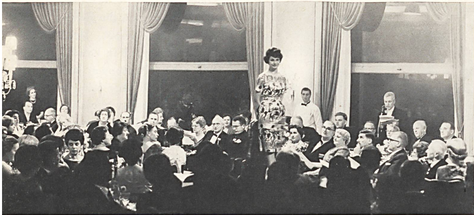
Pendant le défilé. During the presentation. Durante el desfilé. Während der Vorführung.

Anlässlich des Kongresses des Schweizerischen Vereins der Chemiker-Coloristen, der im letzten Oktober in Zürich abgehalten wurde, hat die Publizitätsstelle der Schweizerischen Baumwoll- und Stickerei-Industrie in St. Gallen eine Modeschau von ganz besonderem Charakter veranstaltet. Es handelte sich in der Tat nicht darum, neue noch nicht dargebotene Modelle vorzuführen, sondern vielmehr um anhand von bereits bekannten Modellen verschiedener Fabrikanten von Konfektionskleidern, Wäsche, Tricots und Schneiderateliers die Prozesse zu erwähnen, die angewendet werden, um die Gewebe nadelfertig zu machen, ihnen ihr weiches und volles