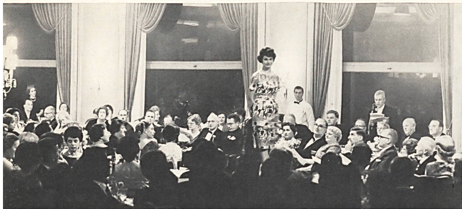
Pendant le défilé. During the presentation. Durante el desfile. Während der Vorführung.

Anlässlich des Kongresses des Schweizerischen Vereins der Chemiker-Coloristen, der im letzten Oktober in Zürich abgehalten wurde, hat die Publizitätsstelle der Schweizerischen Baumwoll- und Stickerei-Industrie in St. Gallen eine Modeschau von ganz besonderem Charakter veranstaltet. Es handelte sich in der Tat nicht darum, neue noch nicht dargebotene Modelle vorzuführen, sondern vielmehr um anhand von bereits bekannten Modellen verschiedener Fabrikanten von Konfektionskleidern, Wäsche, Tricots und Schneiderateliers die Prozesse zu erwähnen, die angewendet werden, um die Gewebe nadelfertig zu machen, ihnen ihr weiches und volles