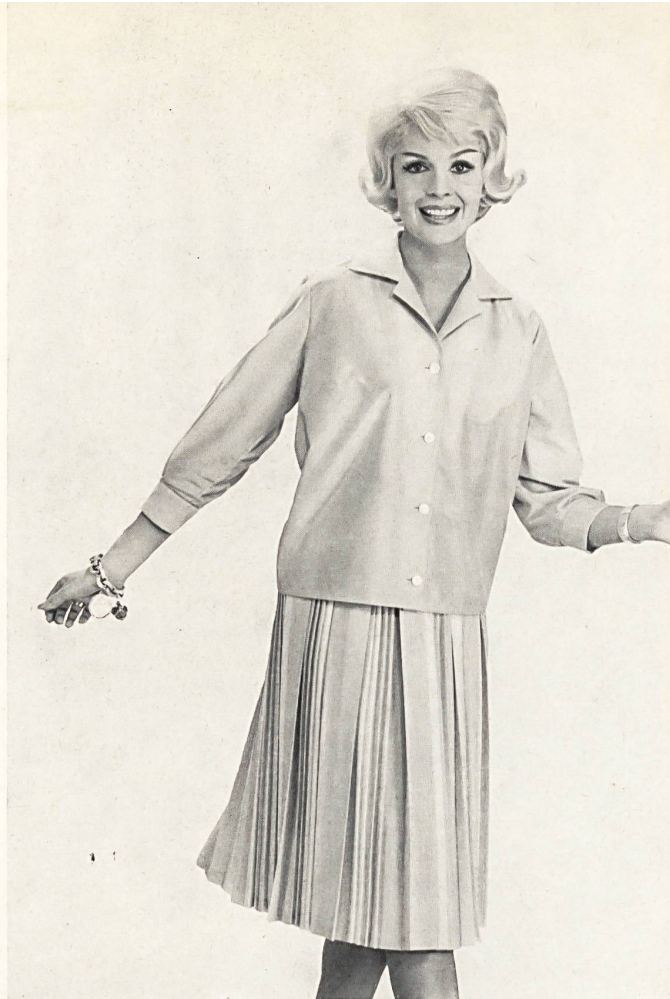
HEER & CIE S. A., THALWIL Térylène (blouse et jupe) Modèle « Fleurisse », Adolf Merz-Brand, Herisau