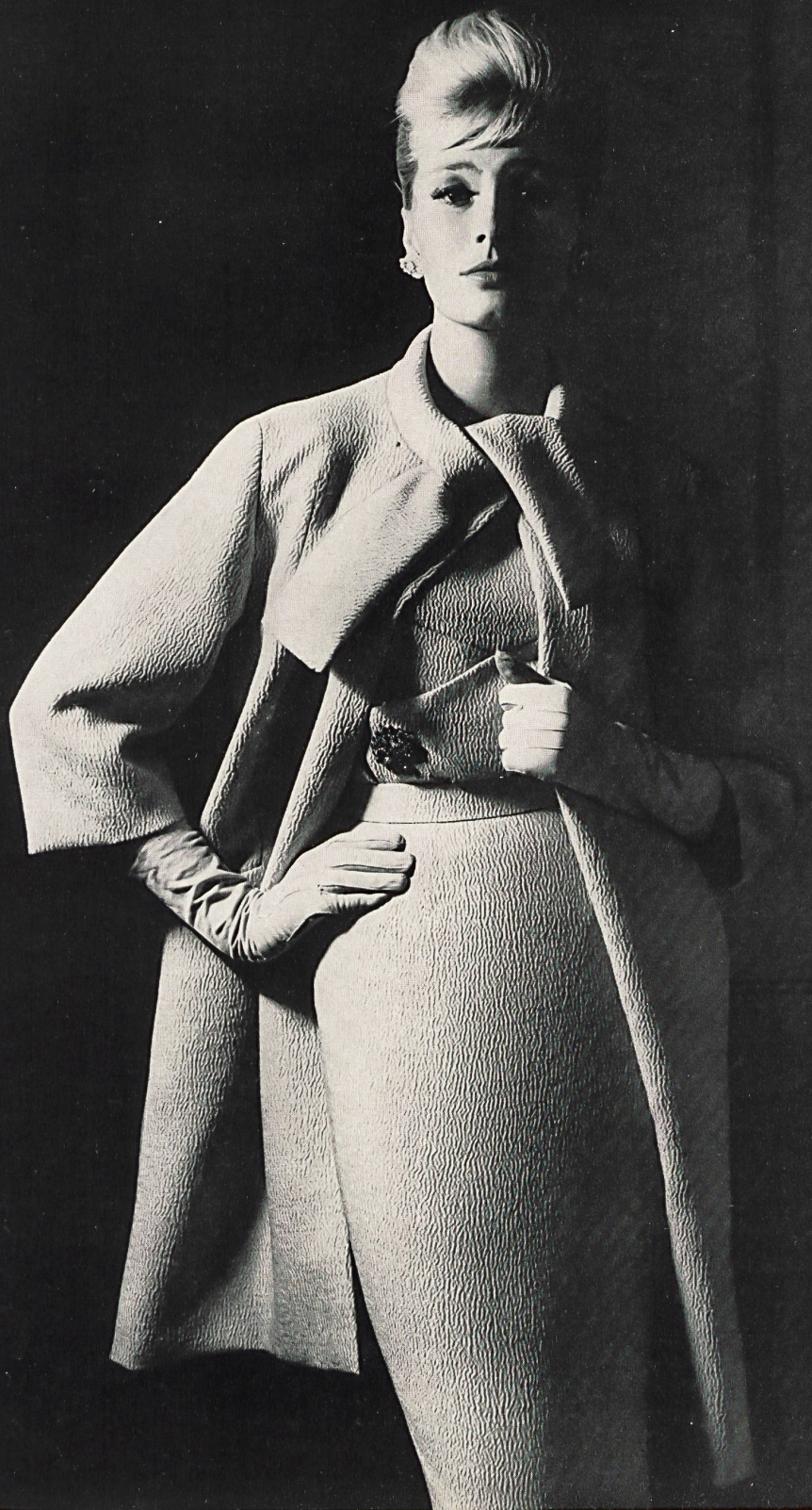
HEER & CIE S. A., THALWIL Alzora cloqué, laine/nylon Modèle Hugo Brandeis S.A., Zurich

Creaciones suizas: Tejidos — Malla — Modelos Schweizer Schöpfungen: Stoffe — Maschen — Modelle