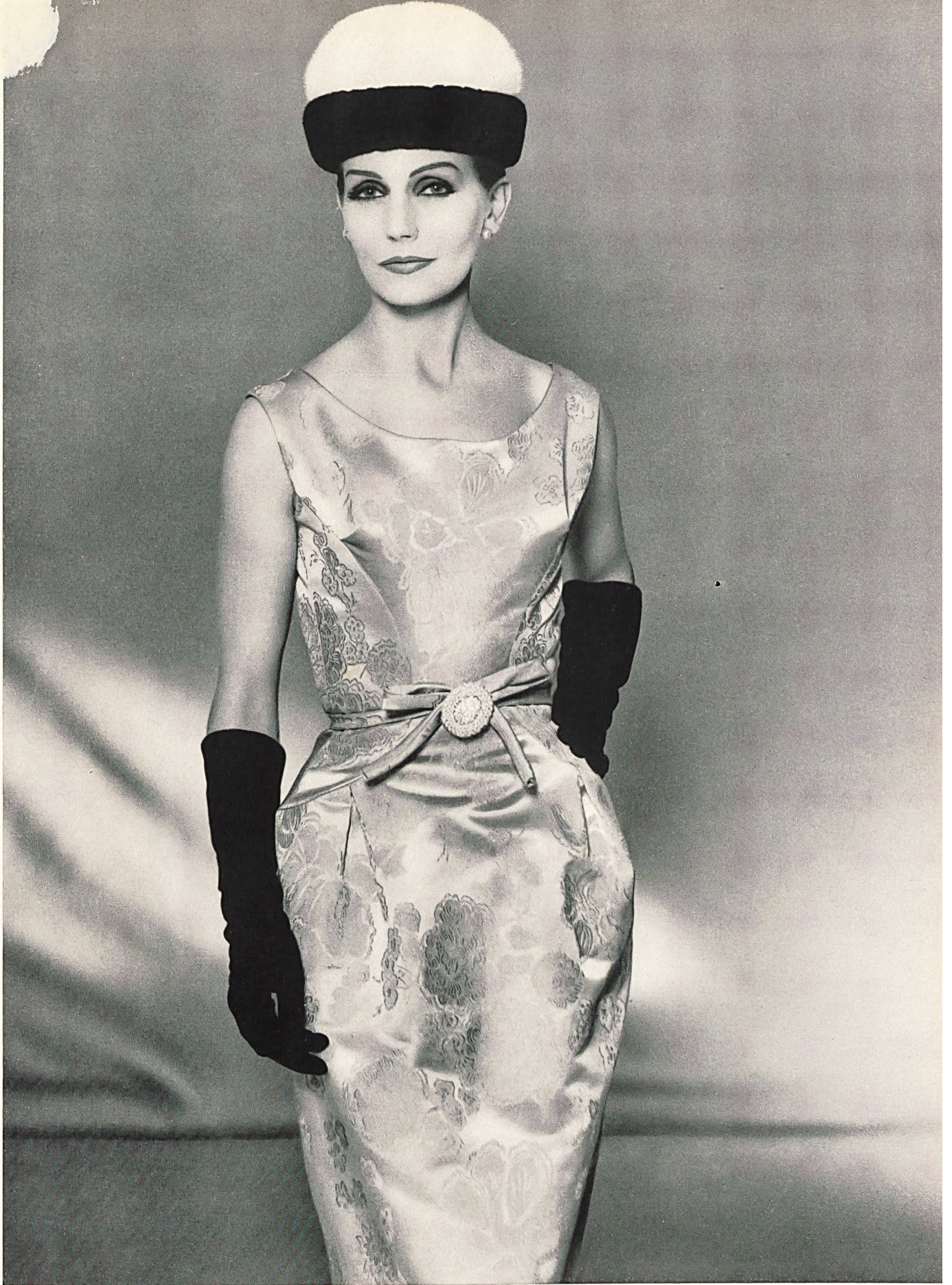
HUBERT DE GIVENCHY