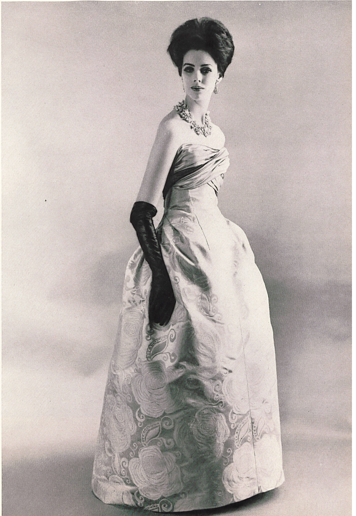
PIERRE BALMAIN Grande robe du soir en soie brochée «Damara» de L. Abraham & Cie, Soieries S.A., Zurich

MODÈLES EXCLUSIFS — REPRODUCTION INTERDITE