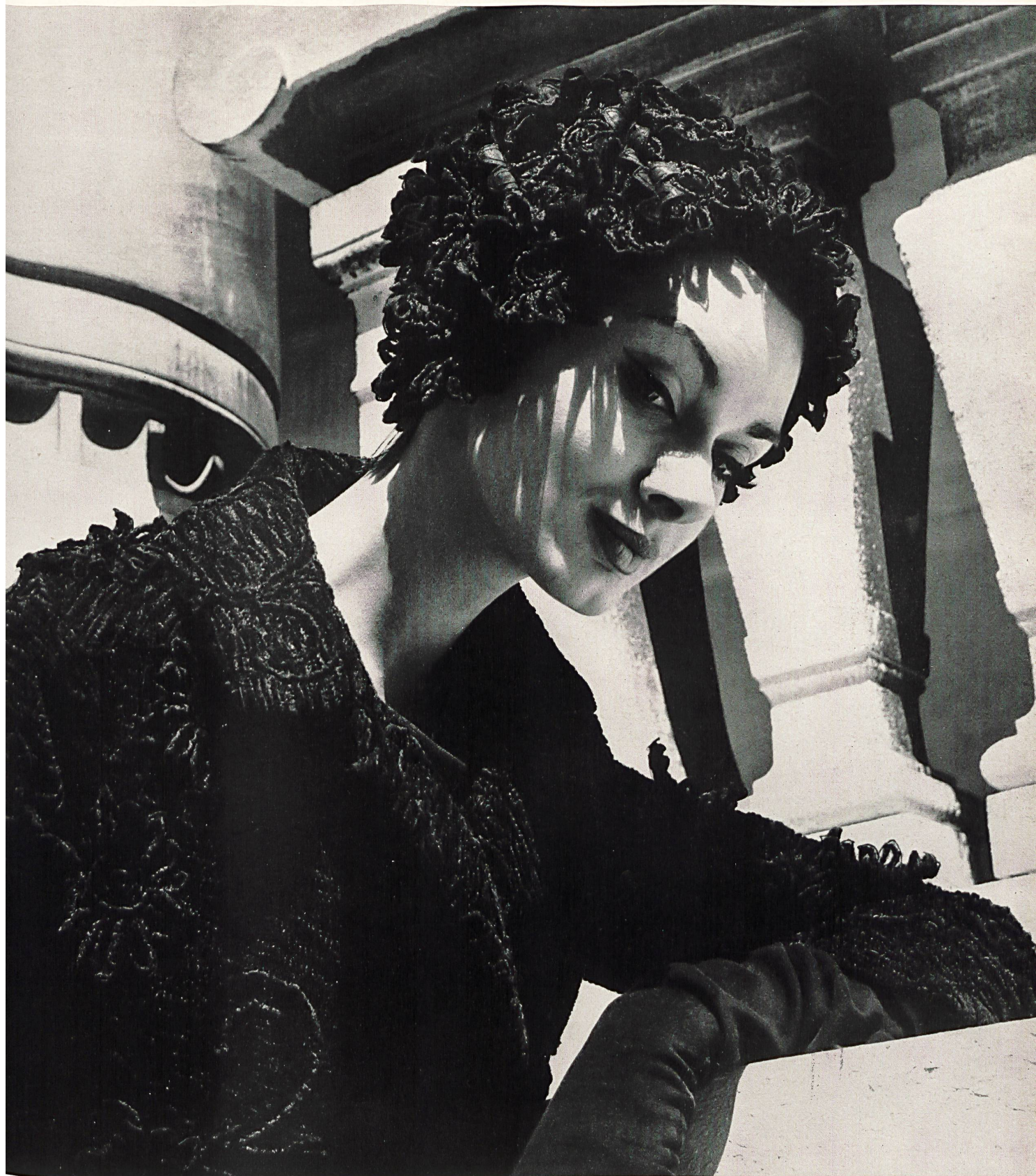
CHRISTIAN DIOR Tissu fantaisie noir avec broderie chenille et effets détachés de A. Naef & Co. S.A., Flawil/Saint-Gall