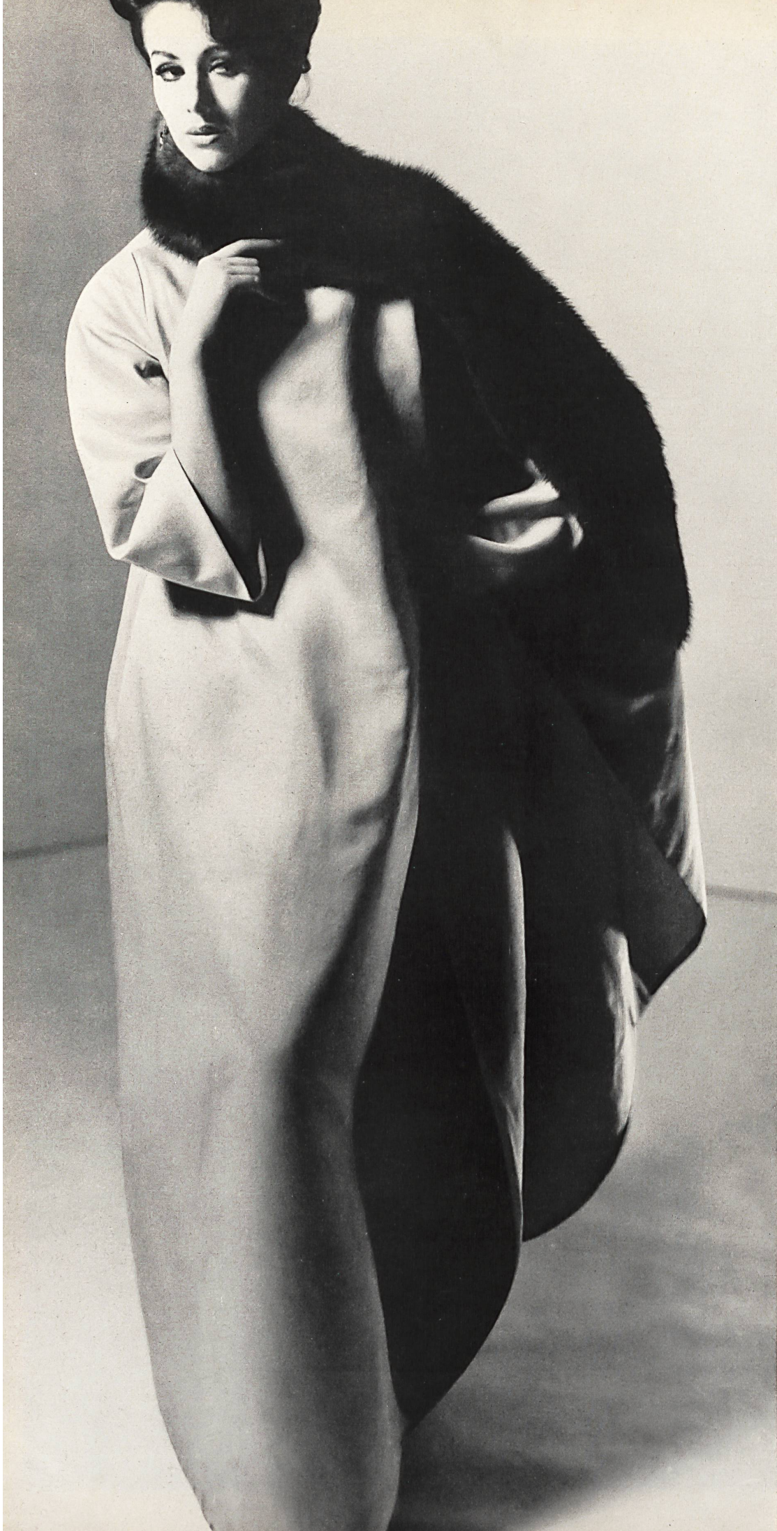
NINA RICCI Ensemble du soir en gabardine de soie de L. Abraham & Cie, Soieries S.A., Zurich