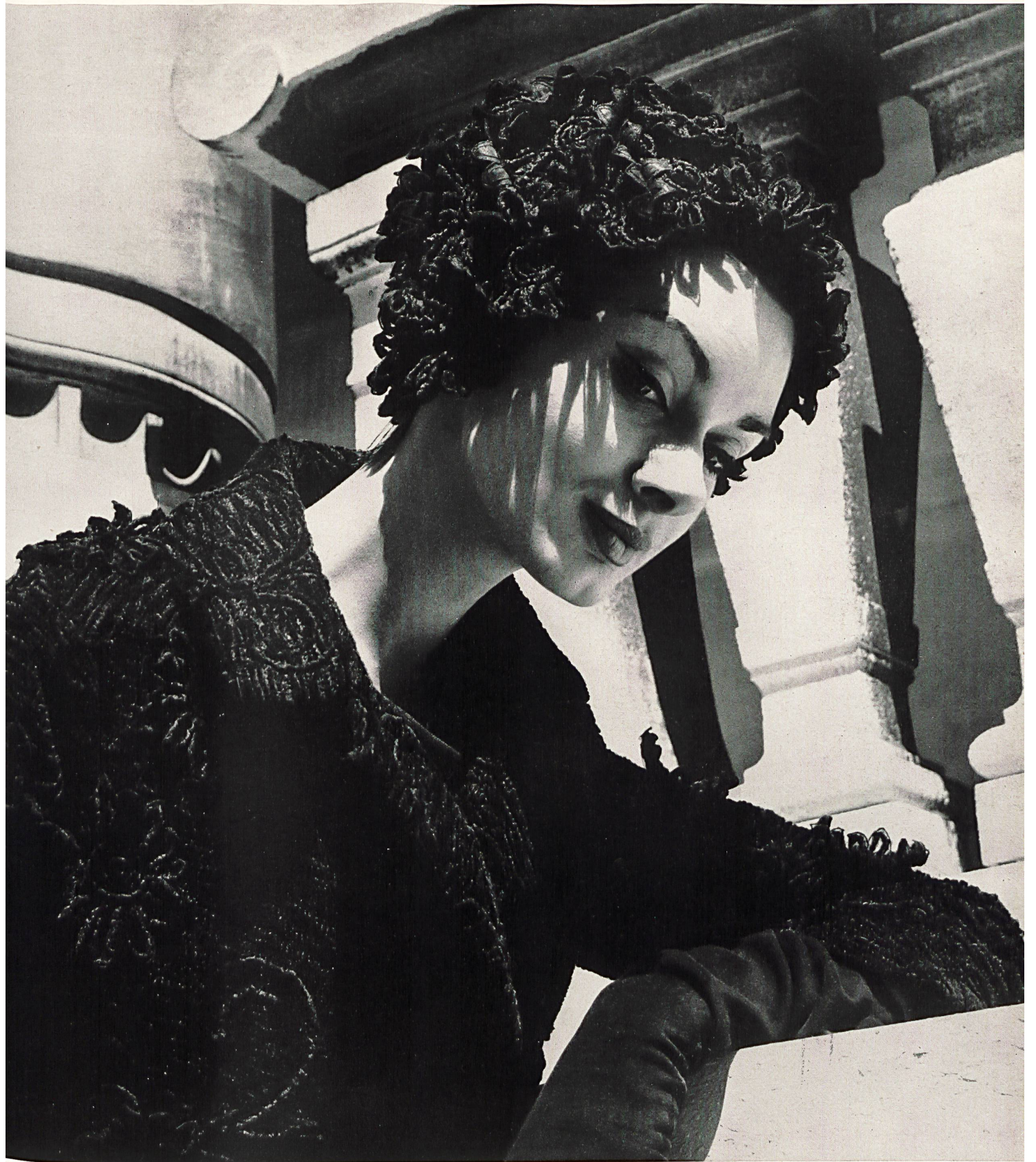
CHRISTIAN DIOR Tissu fantaisie noir avec broderie chenille et effets détachés de A. Naef & Co. S.A., Flawil/Saint-Gall