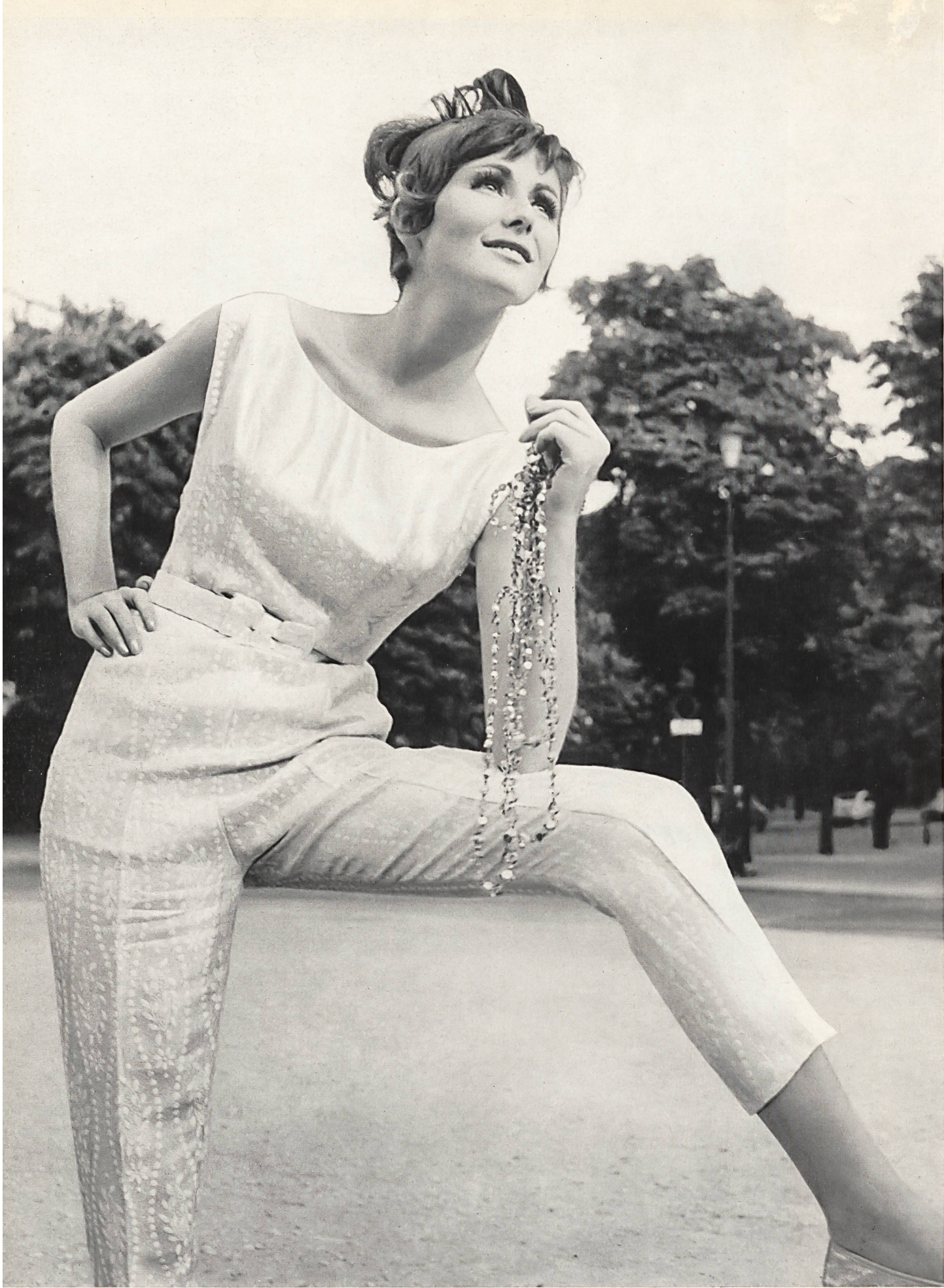
BERNARD SAGARDOY Façonné lamé, soie/métal, des Soieries Stehli S.A., Zurich