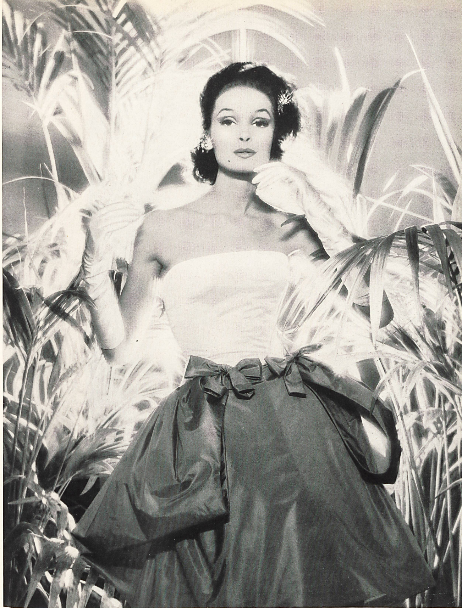
JACQUES ESTEREL Taffetas chiffon blanc et or de Robt. Schwarzenbach & Co., Thalwil