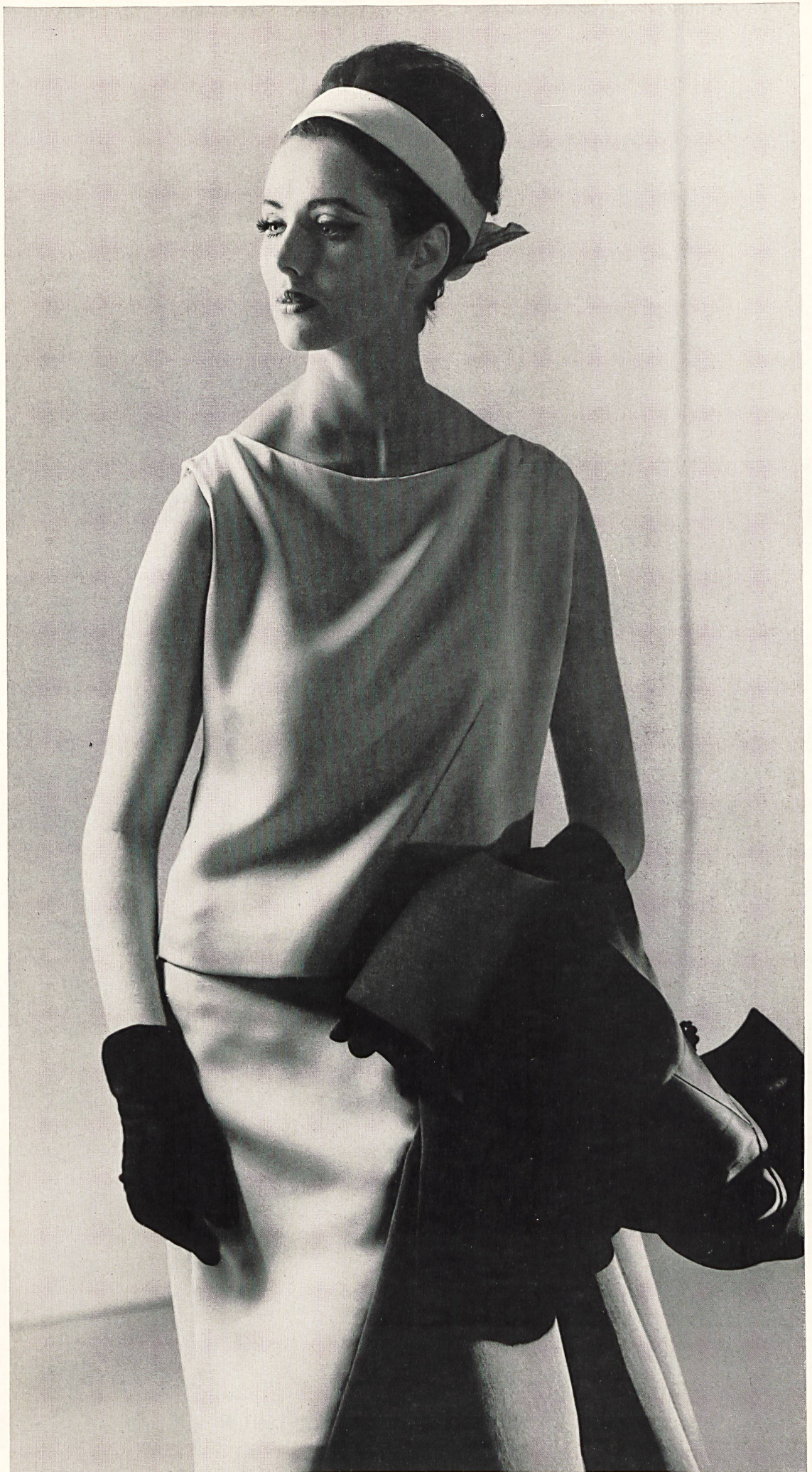
GUY LAROCHE Robe de cocktail en crêpe «Corico» et manteau en gabardine de soie de L. Abraham & Cie, Soieries S.A., Zurich