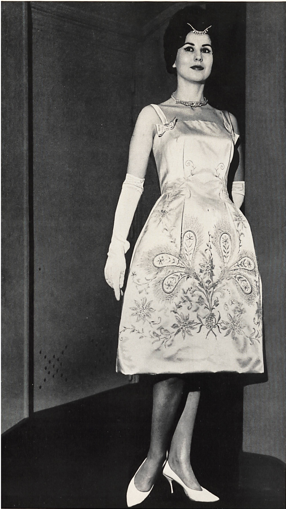
BOB BUGNAND Soie Rhodia, brodée de perles et main, de Rudolf Brauchbar & Cie S. A. Zurich Distribué par Montex, Paris