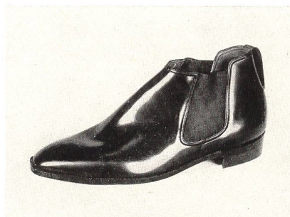
« Wellington Boot »