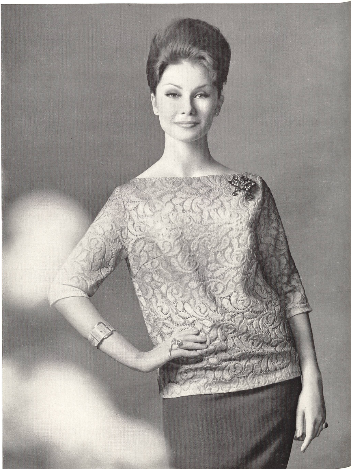
Modèle «SAMODE», MODEN S. A., MONTREUX Fabrique de robes et blouses Blouse en dentelle de laine de couleurs Multicoloured wool lace blouse Blusa de encaje de lana multicolor Bluse aus farbiger Wollspitze