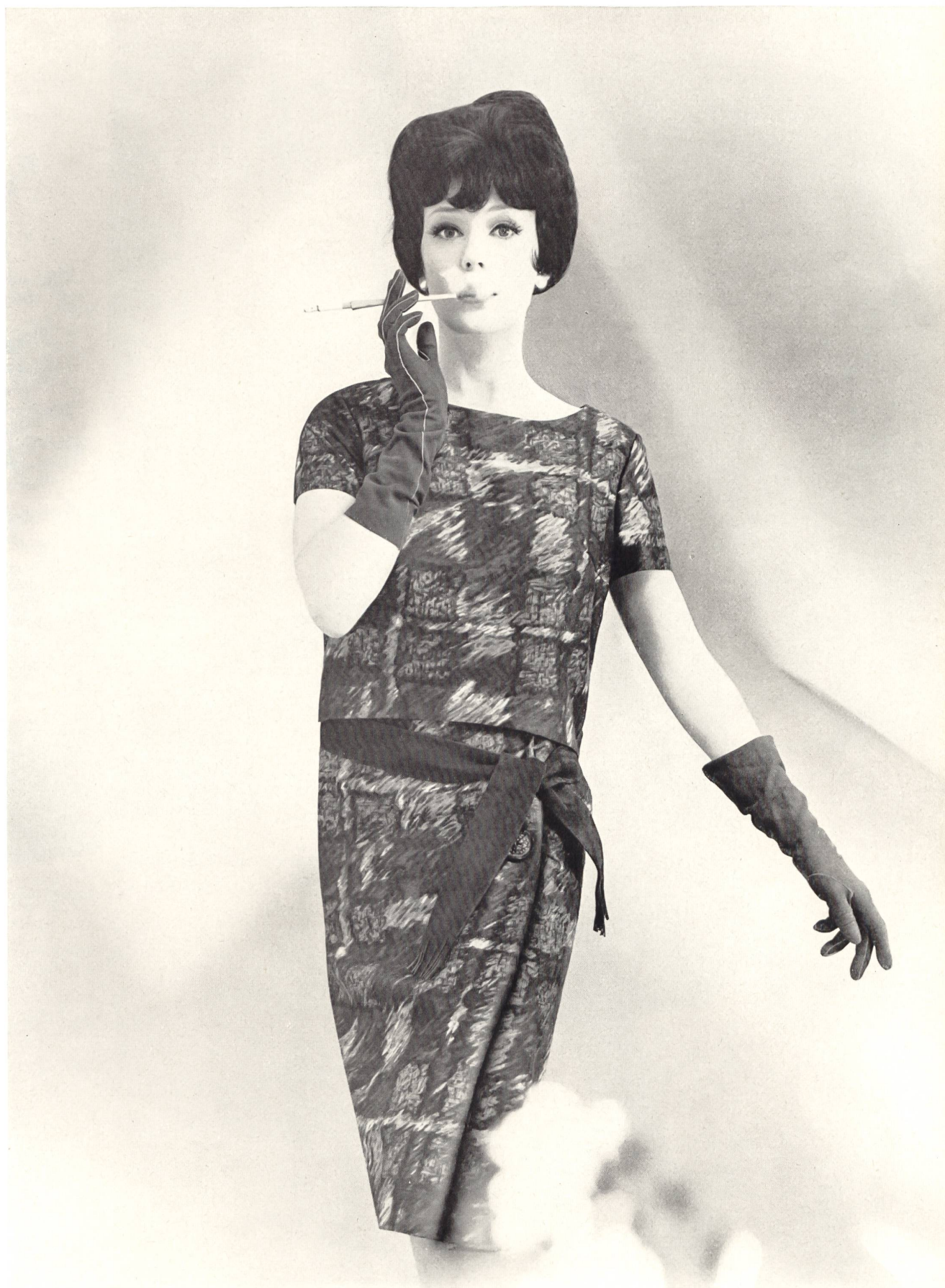
Modèle E. WEBER & CIE S. A., ZURICH Robe d'après-midi en pure soie Pure silk afternoon dress Vestido de tarde pura seda Reinseidenes Nachmittagskleid