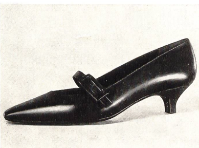
« Madeleine », Form Carré