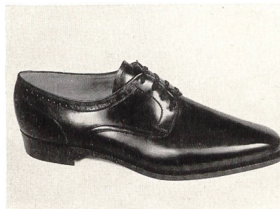
« Vogue », Form Carré