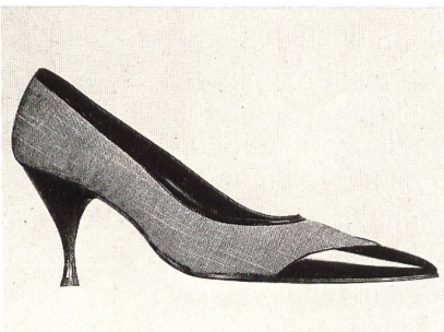
« International » Form Ritz, Lack und Tweed