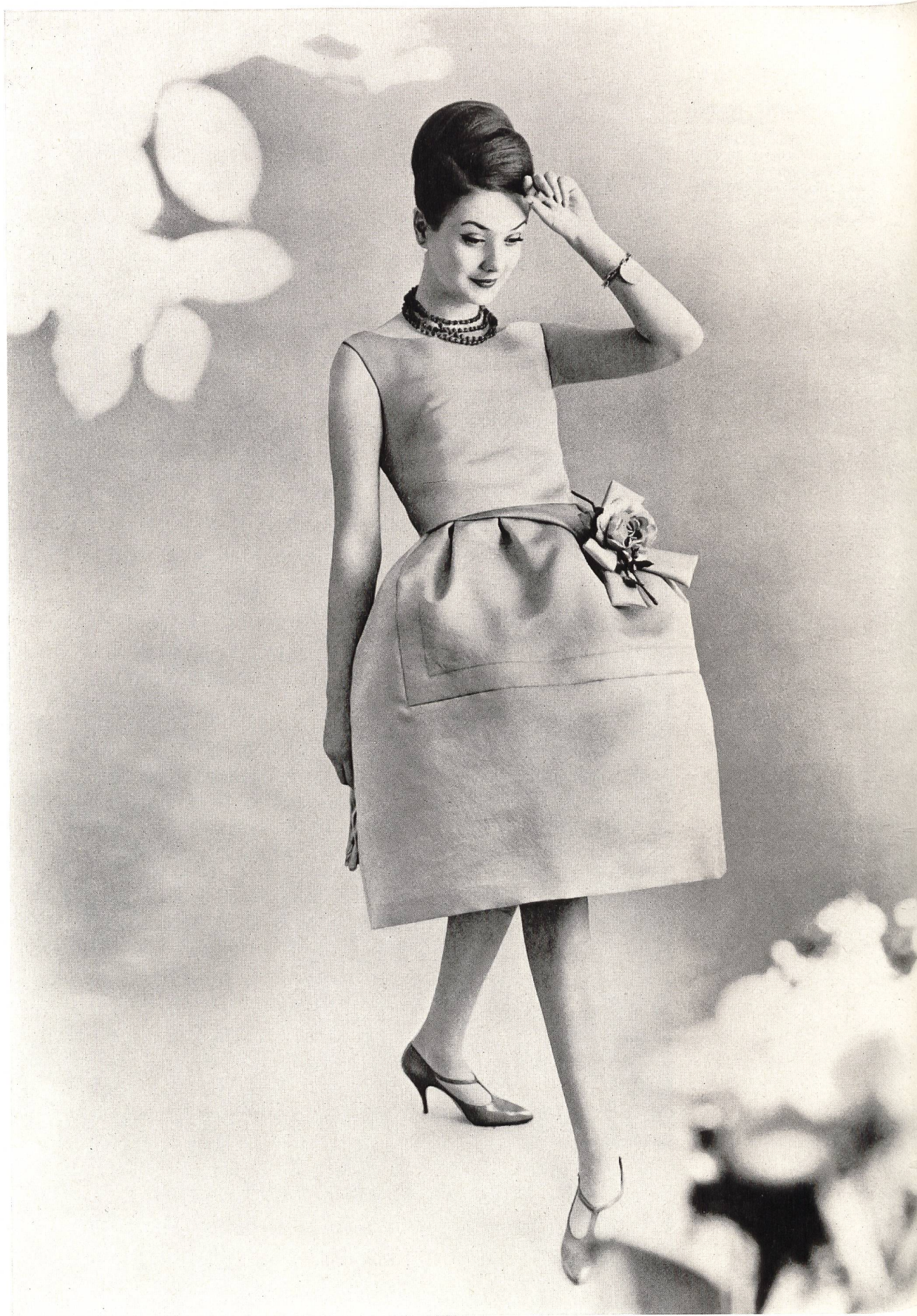
Modèle E. WEBER & CIE S. A., ZURICH Robe du soir en shantung Mandarin pure soie Pure silk Mandarin Shantung evening dress Vestido de noche de shantung Mandarin pura seda Abendkleid aus reinseidenem Mandarin-Shantung