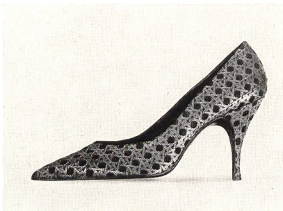
« International » Brokat

Auch für die Herren ist die eckige Form die Neuheit der Saison. Die äusserst spitzen Formen sind überlebt, und der traditionelle «English Look» setzt sich sichtlich durch. Der jetzt in Stadt und Büro gut eingeführte Loafer ist für die Stadt ziemlich hoch geschnitten, den modernen Hosen ohne Umschläge angepasst. Laschen mit Gummizug gewähren für diese Modelle einen tadellosen Sitz. Unter den avant-gardistischen Kreationen sei noch der Wellington-Boot mit kurzem Gummizug erwähnt, der den Offiziersstiefeln sehr nahe kommt. Die Farben sind entschieden herbstlich; an die Patina «Custom Smoke» möchten wir noch erinnern, da sie für Herren- und Damenschuhe in Gebrauch gekommen ist; dem anilin-gefärbten Leder verleiht sie das typisch handwerkliche Aussehen.