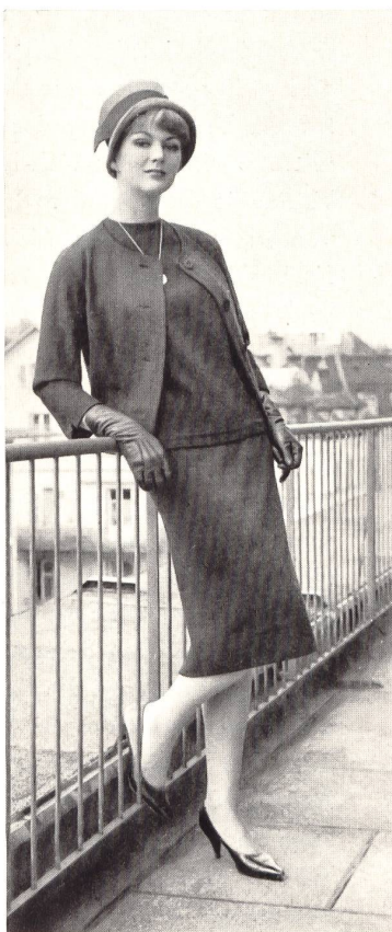
« SNAKY-BELFA » OUMANSKY & CO., GENÈVE Trois-pièces tricot Three-piece knitted outfit Tres piezas de punto