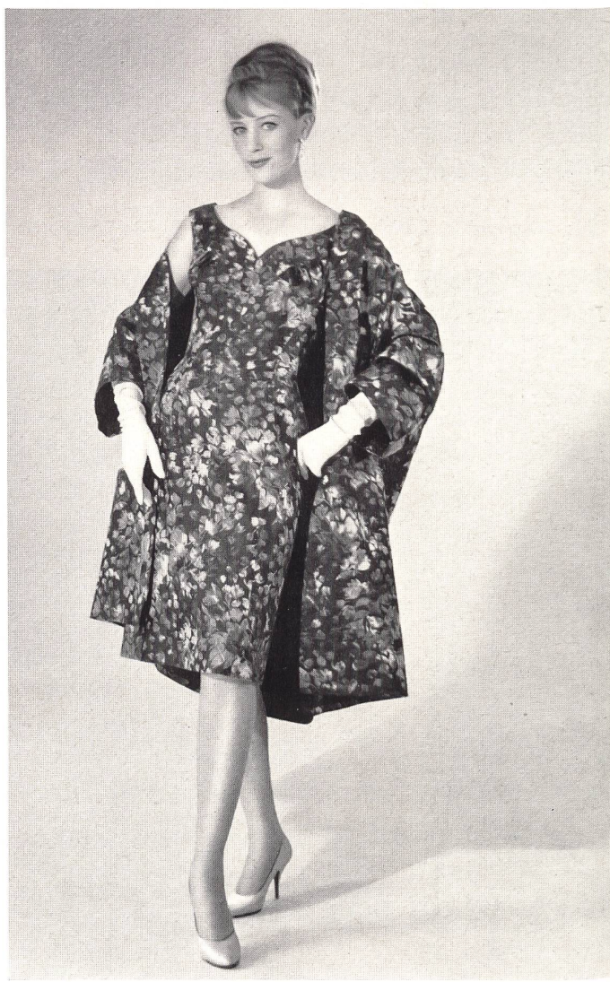
H. HALLER & CO., ZÜRICH Ensemble en jacquard pure soie Pure silk jacquard outfit Conjunto de tejido jacquard seda pura Complet aus reinseidenem Jacquard Gewebe