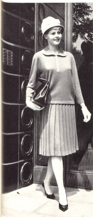
« ALPINIT » RUEPP & CIE S.A., SARMENTSTORF Ensemble tricot Knitwear outfit Conjunto de punto