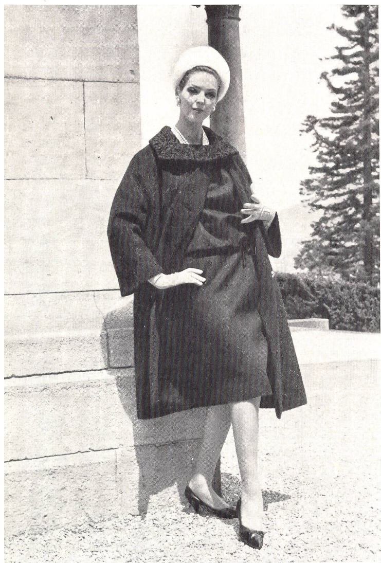
ARTHUR SCHIBLI S. A., GENEVE Robe noire avec manteau assorti Black dress with coat to match Vestido negro con abrigo haciendo juego Schwarzes Kleid mit passendem Mantel

den Vormittag eine Schau von Oberbekleidung aus der Maschenindustrie vor, Modelle von Regenmänteln, Après-Ski- und Wintersportbekleidung und Strandmode. Während des Apéritifs konnten die Gäste eine Ausstellung feiner Unterwäsche bewundern, und nach dem Mittagessen kamen Mäntel, Kostüme, Deux-Pièces, Kleider, Nachmittagskleider aus Trikot, Blusen und Kinderbekleidung zur Vorführung. Während und nach der Teestunde wurden Cocktail- und Abendkleider gezeigt. Das Programm schloss mit einem gemeinsamen Cocktail und einem Dîner. Die nebenstehenden Aufnahmen geben die Atmosphäre der Veranstaltung wieder, die in jeder Hinsicht ein Erfolg war.