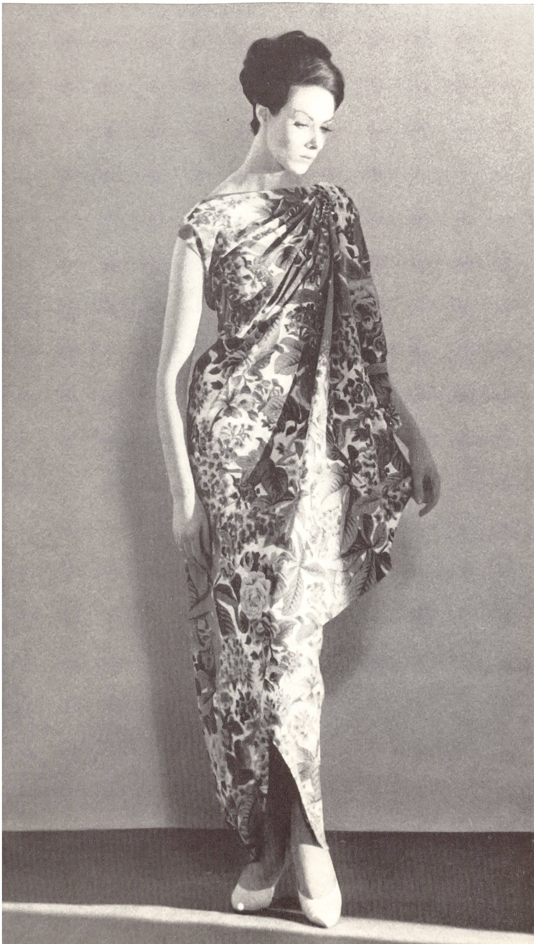
PIERRE BALMAIN « Basra » brodé de L. Abraham & Cie, Soieries S. A., Zurich