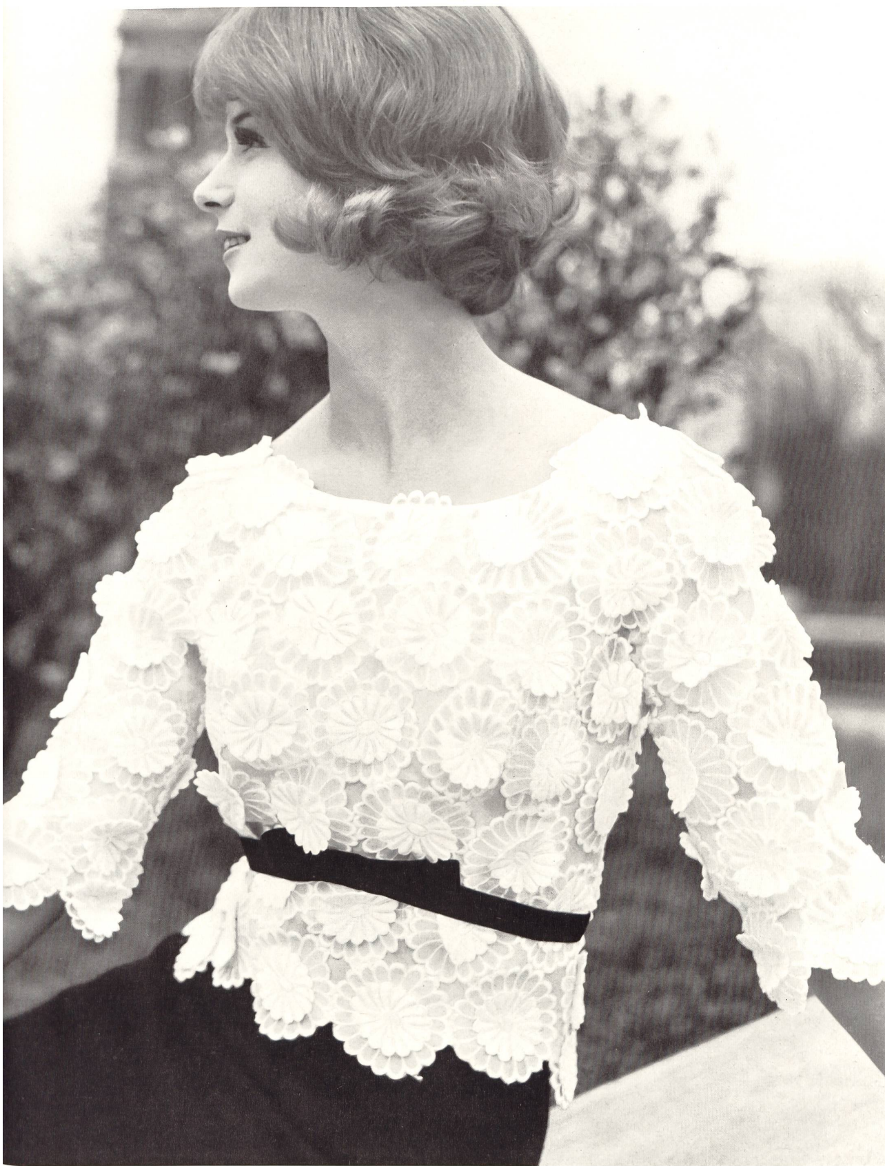
JACQUES HEIM Broderie «Nelo» appliquée sur organdi de J. G. Nef & Co. S. A., Hérissau