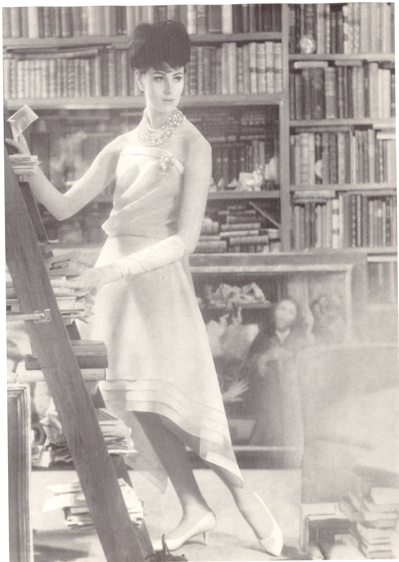
CHRISTIAN DIOR « Basra » de L. Abraham & Cie, Soieries S. A., Zurich