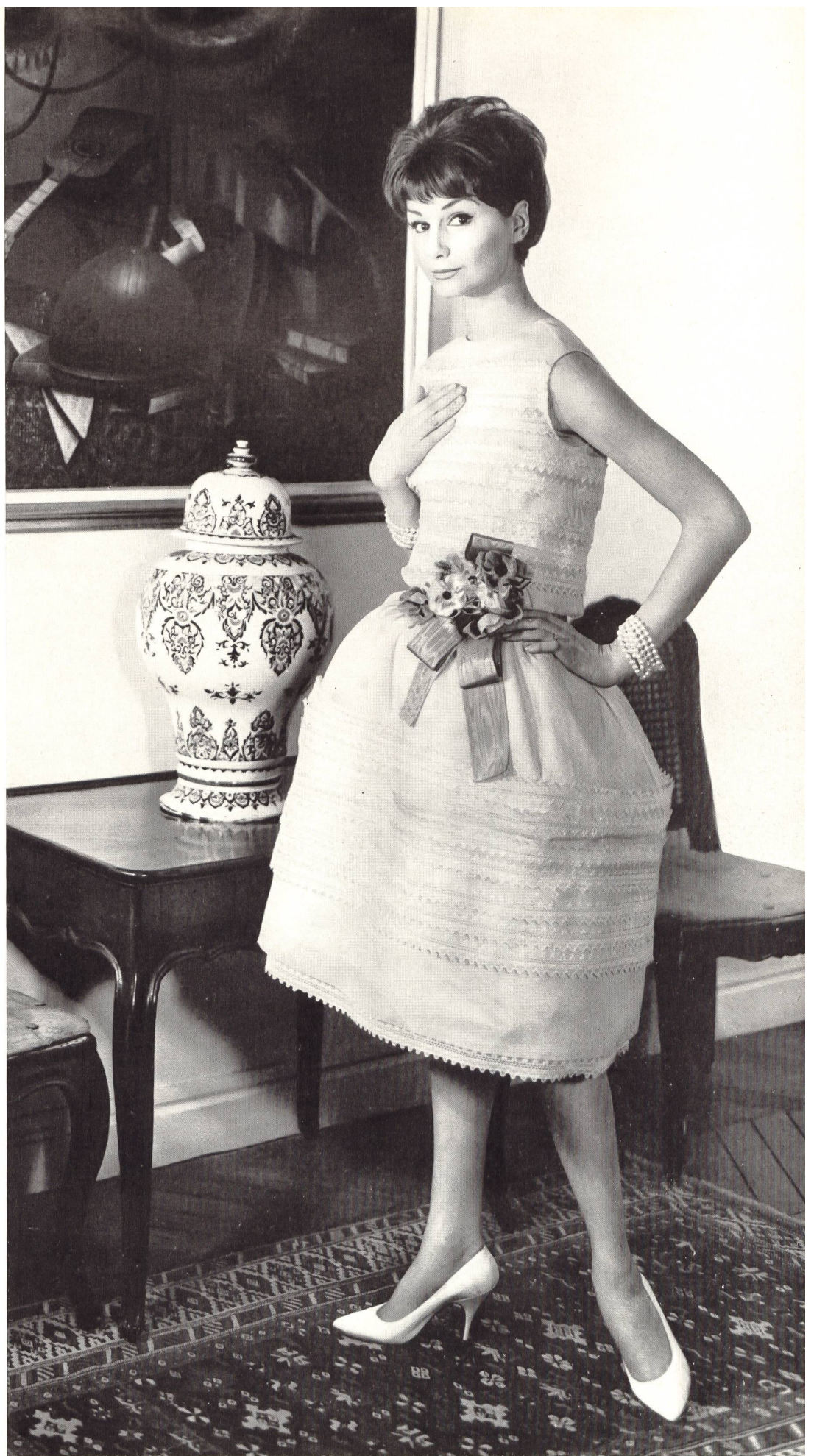
CHRISTIAN DIOR Organdi brodé de Forster Willi & Co., Saint-Gall