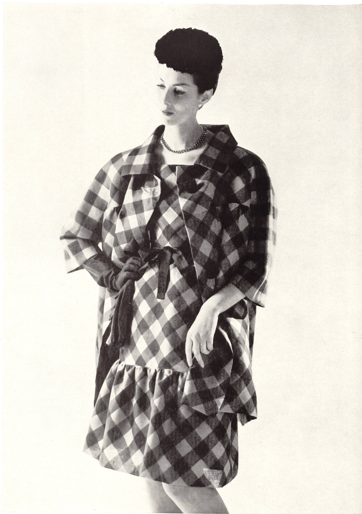
HUBERT DE GIVENCHY