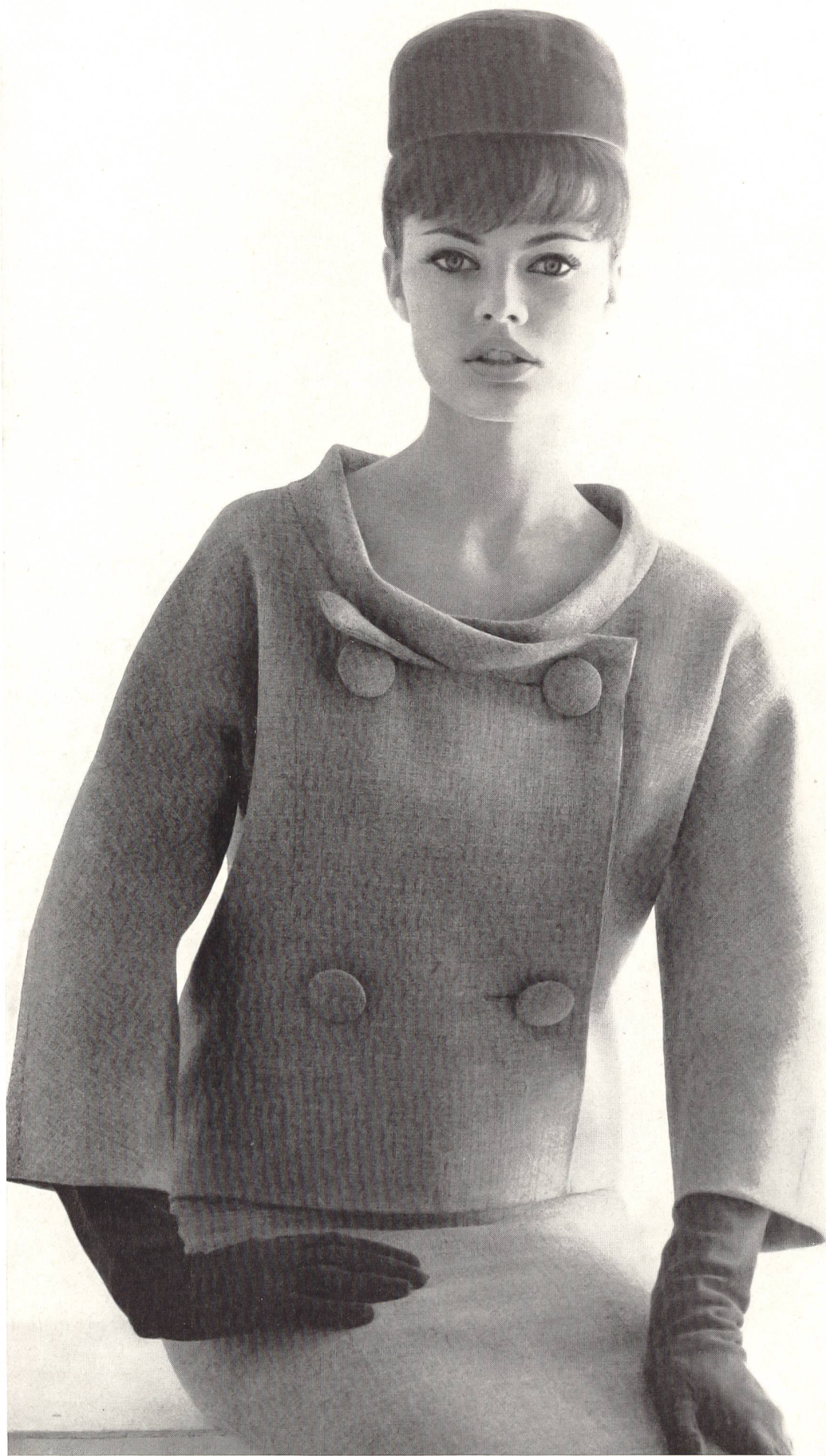
PIERRE CARDIN « Shetty fashion fil » des Tissages de soieries Naef Frères S. A., Zurich