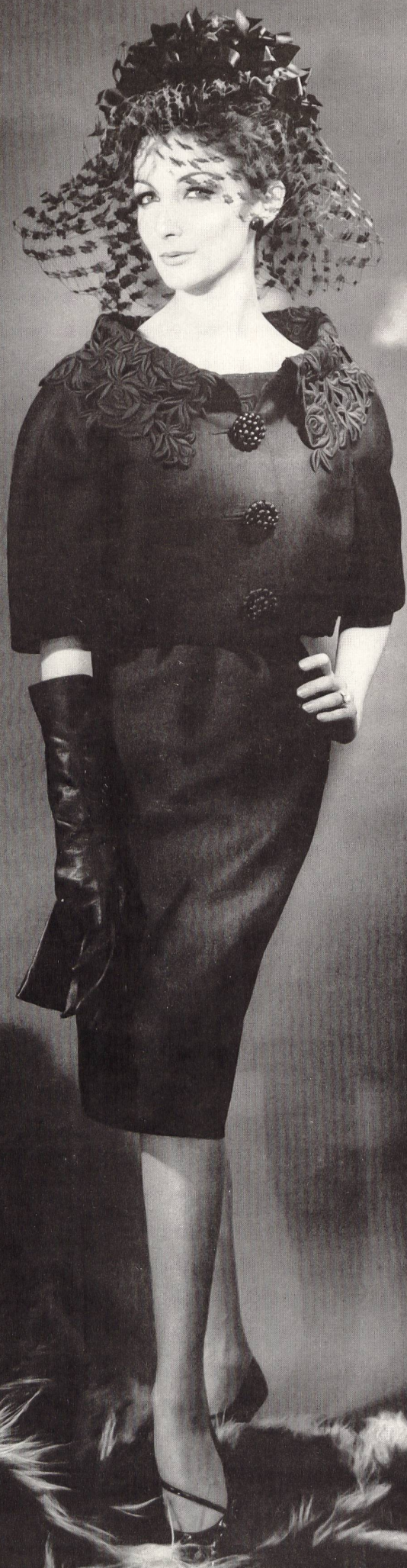
BERNARD SAGARDOY Broderie noire découpée de Union S. A., Saint-Gall Grossiste à Paris: Robert Burg & Cie