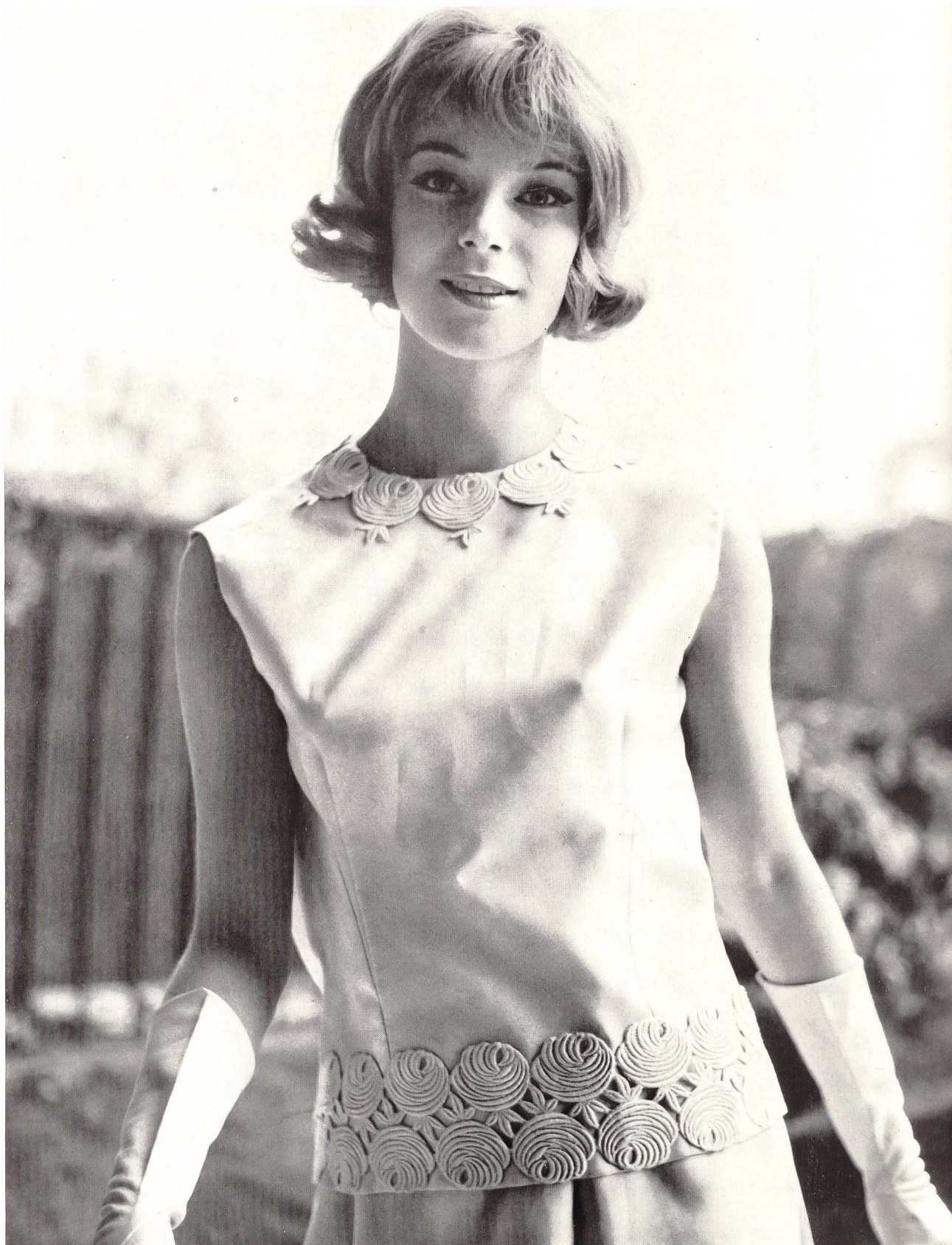
BERNARD SAGARDOY Bande de guipure de Jacob Rohner S. A., Rebstein