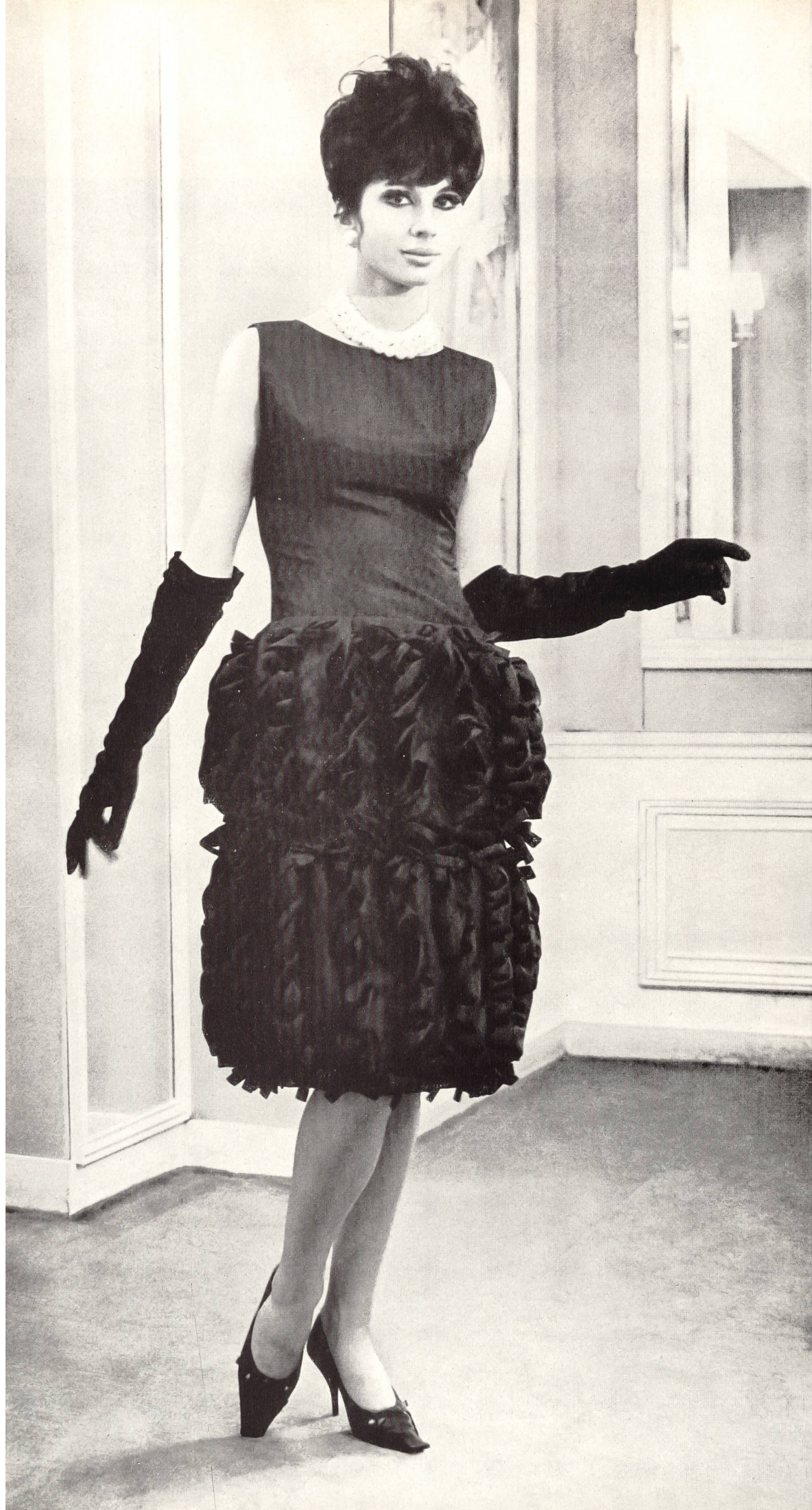
CHRISTIAN DIOR Taffetas de soie de la S. A. Stünzi Fils, Horgen