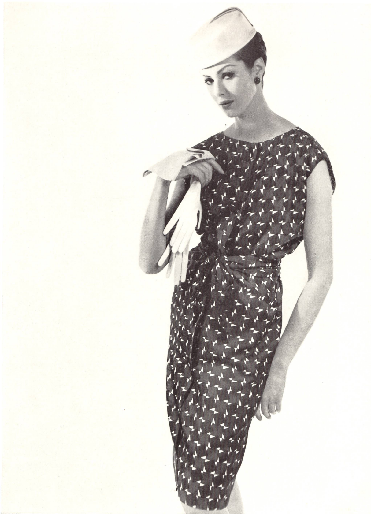
HUBERT DE GIVENCHY