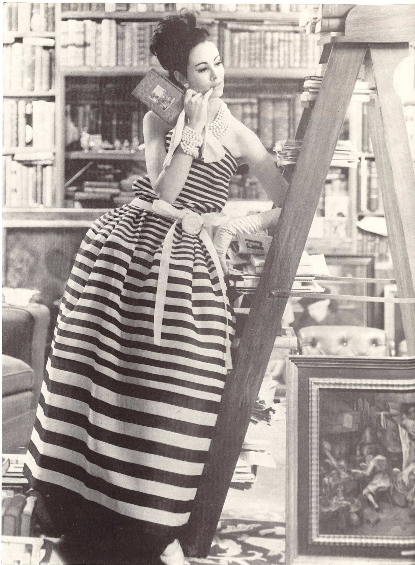
CHRISTIAN DIOR « Gazar » rayé de L. Abraham & Cie, Soieries S. A., Zurich