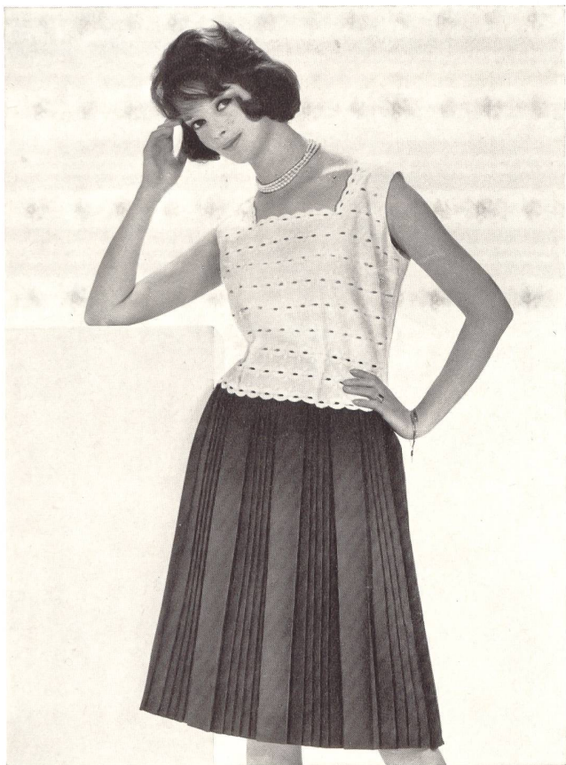
NEUBURGER & CO. A.G., SAINT-GALL

Guipure Modèle Wollenschläger & Co. G.m.b.H., Baden-Baden (Allemagne)