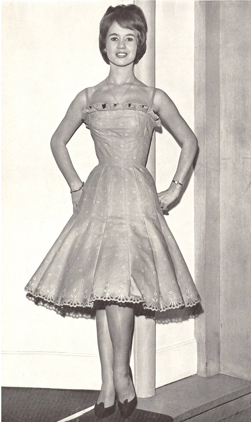
« RECO », REICHENBACH & CO., SAINT-GALL

Batiste Mimicare brodée Modèle Manuela, Nice Distribué par Montex, Paris