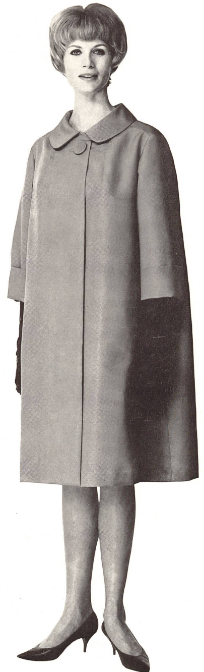
ROBT. SCHWARZENBACH & CO., THALWIL

Batiste Mimicare brodée Modèle Manuela, Nice Distribué par Montex, Paris