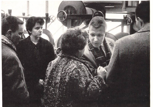
Journalistenbesuch in einer Baumwoll-Buntweberei. (Meyer-Mayor Söhne, Neu St. Johann)