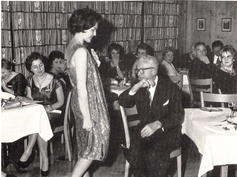
Während der Vorführung.

Im Laufe des verflossenen Monats Februar hat die Propagandastelle für die schweizerische Baumwoll- und Stickerei-Industrie in St. Gallen für die Vertreter der Presse eine zweitägige Besuchsfahrt in die Ostschweiz durchgeführt, um die Teilnehmer des näheren über das, was die ostschweizerische Textilindustrie an Möbelstoffen, an Haushaltwäsche usw. produziert, zu unterrichten. Das Programm sah insbesondere den Besuch einer Fabrik von Tüll-Vorhängen, einer Fabrik von modernen Polstermöbeln, eines Unternehmens der Textilveredelungsindustrie, besonders ihres Departements für «Textildruck» und einer Buntweberei vor. — Daneben wohnten die Teilnehmer der Vorführung einer neuzeitlichen Kollektion von Dekorations- und Möbelstoffen bei und besuchten eine Ausstellung von bunt gewobener Haushaltwäsche; schliesslich besichtigten sie eine Kollektion von Geweben für Vorhänge und Bettwäsche. Zum Abschluss wurden die anwesenden Journalisten zu einem Besuch der ostschweizerischen Stickereifachschule in St. Gallen eingeladen, wo sie Gelegenheit hatten, noch eine Ausstellung von gestickter Haushaltwäsche, Erzeugnisse verschiedener Stickereiunternehmen von St. Gallen und Umgebung in Augenschein zu nehmen.