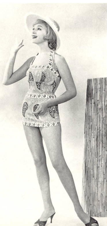
MYLORD S. A., CHATEL-SAINT-DENIS

Ensemble de loisirs en orlon « Hélanca »