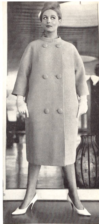
SCHMID A.G., GATTIKON Orlon/laine Modèle : Arthur Schibli S. A., Genève

Orlon/rayonne Modèle : Brüllmann & Co., Zurich