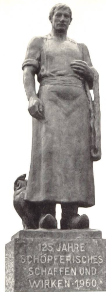
Die Färber-Statue auf dem Heberlein-Brunnen in Wattwil