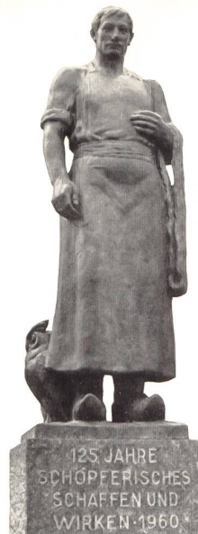
Die Färber-Statue auf dem Heberlein-Brunnen in Wattwil