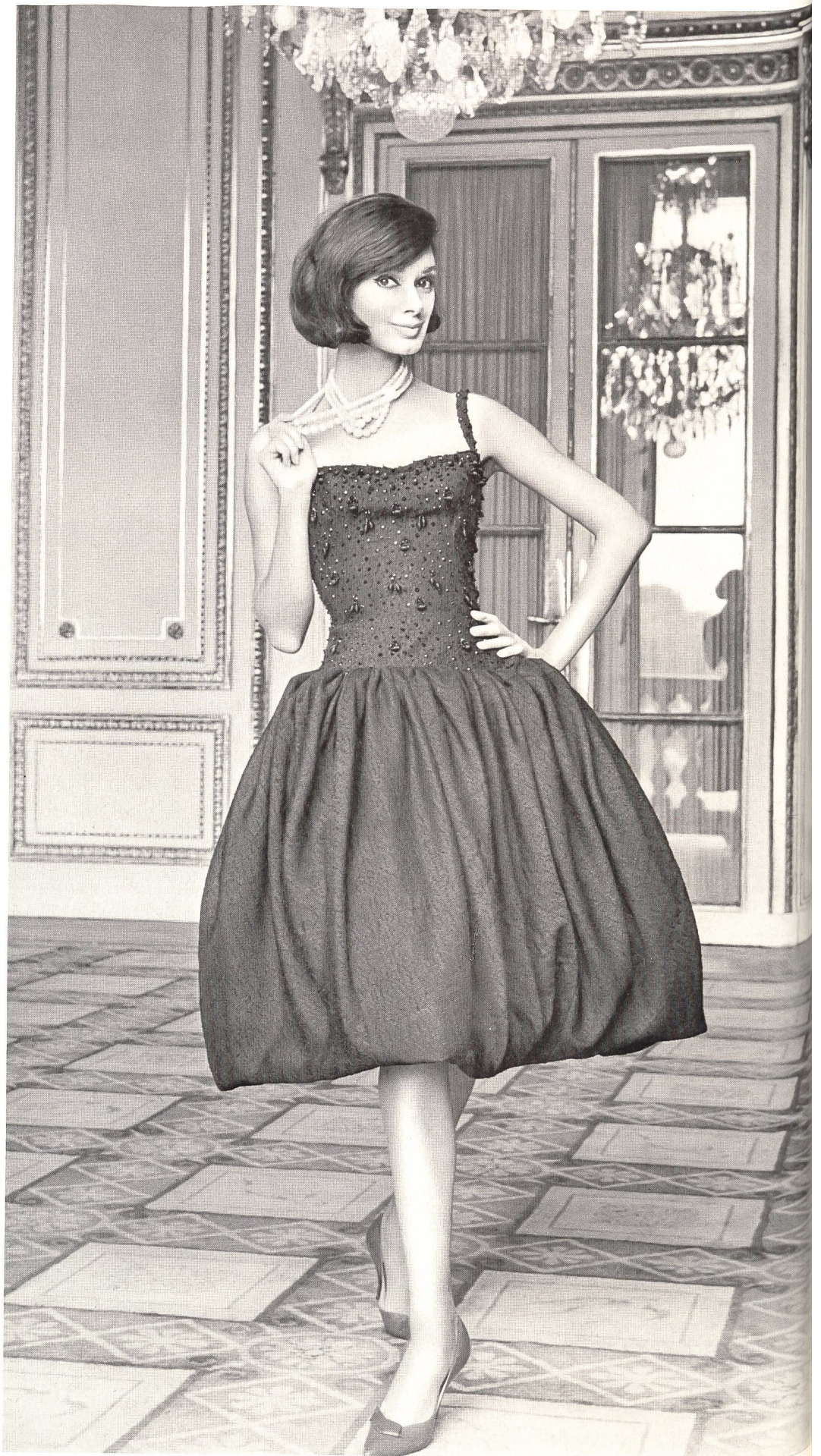
JACQUES HEIM Tissu « Kolibri » (soie naturelle) de Heer & Cie S.A., Thalwil Grossiste à Paris : Robert Burg & Cie