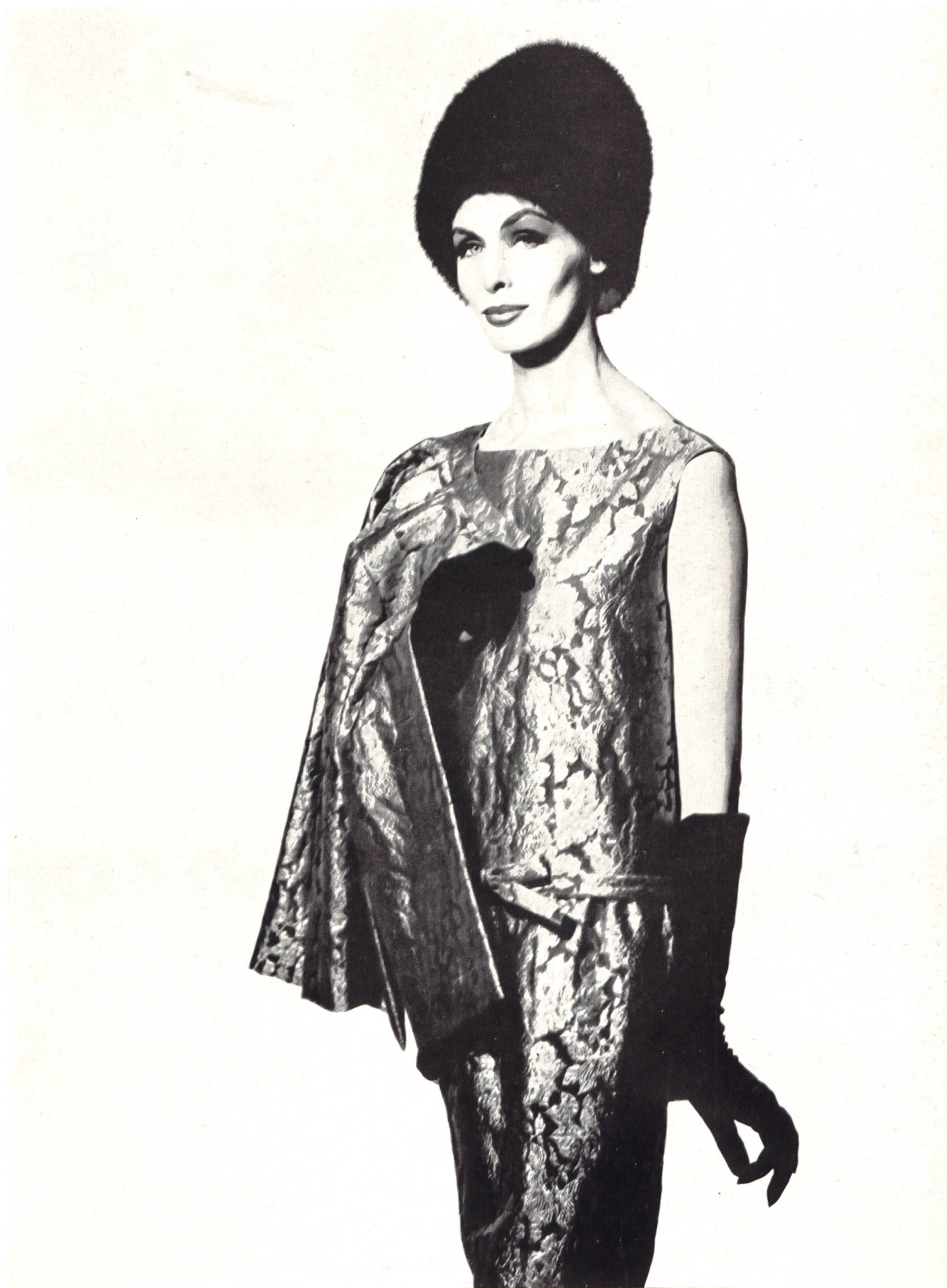
CHRISTIAN DIOR « Aragone » métal de L. Abraham & Cie, Soieries S. A., Zurich

MODÈLES EXCLUSIFS — REPRODUCTION INTERDITE