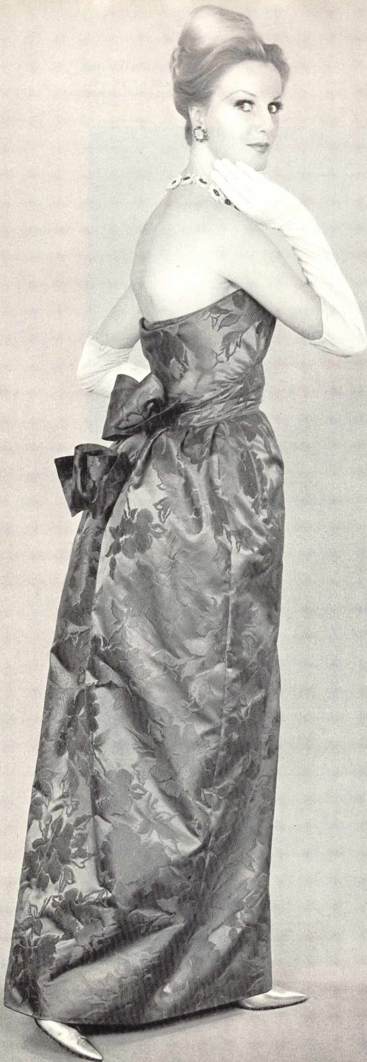
LANVIN CASTILLO Soie brochée « Damar » de L. Abraham & Cie, Soieries S.A., Zurich