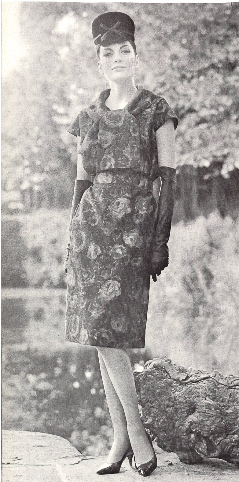
PIERRE CARDIN Soielaine « Miranda » de Reichenbach & Co., Saint-Gall Distribué par Montex, Paris