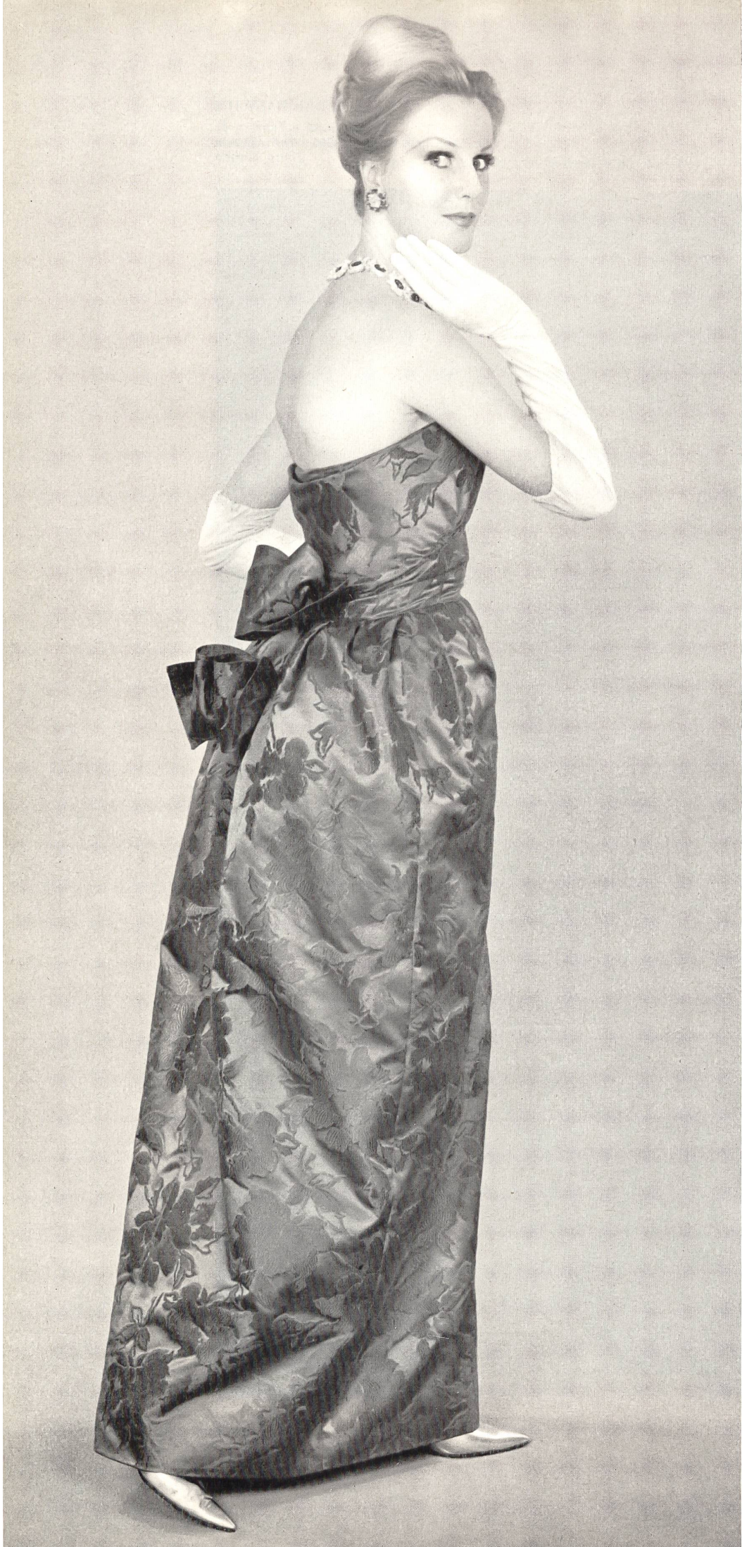
LANVIN CASTILLO Soie brochée « Damar » de L. Abraham & Cie, Soieries S.A., Zurich