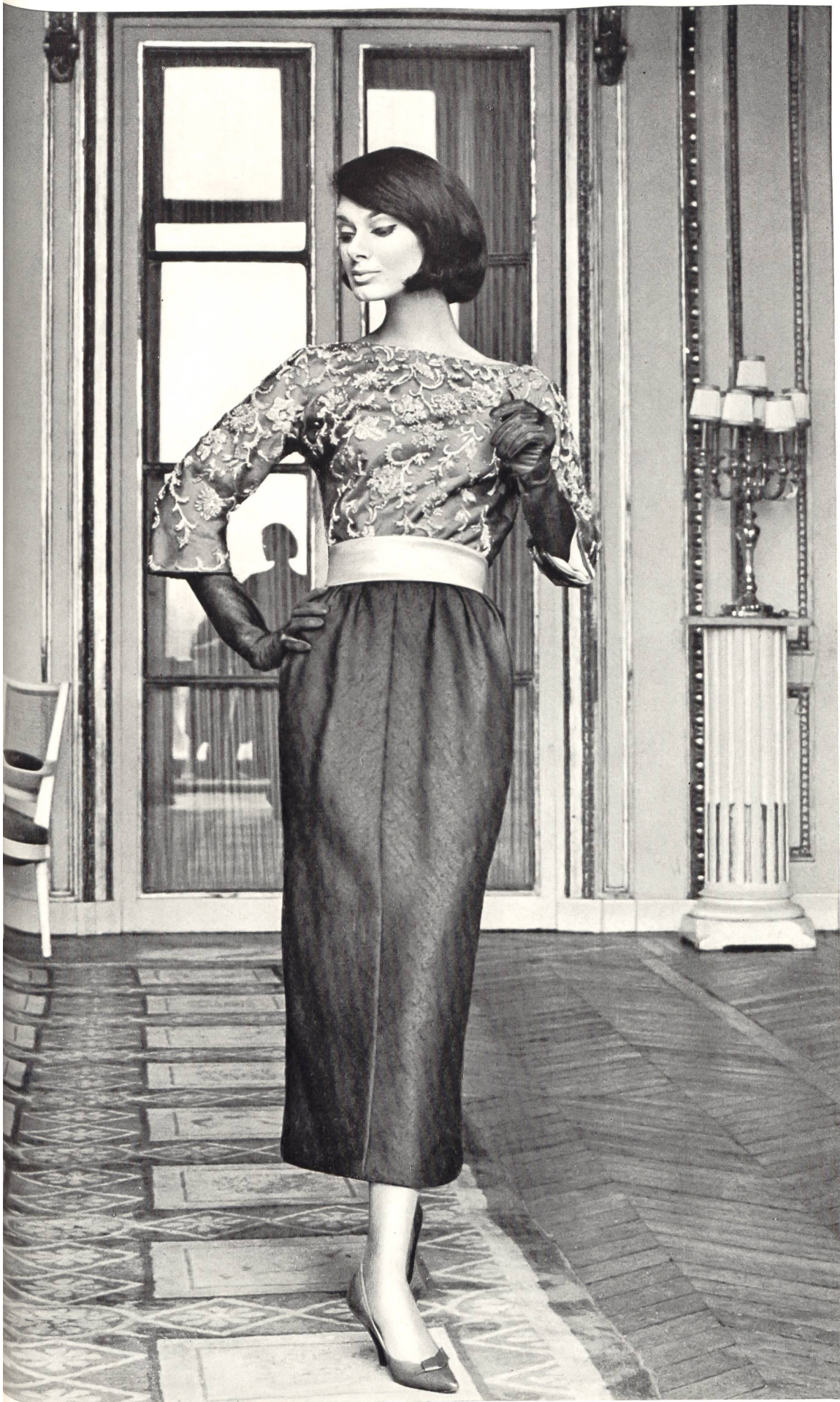
JACQUES HEIM Tissu « Kolibri » (soie naturelle) de Heer & Cie S.A., Thalwil Grossiste à Paris : Robert Burg & Cie