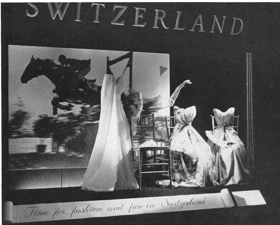
Office National Suisse du Tourisme La vitrine du bureau des Chemins de fer suisses à New York Swiss National Tourist Office The window display at the Swiss Federal Railroads Office in New York

Das sind von links nach rechts drei lange Abendkleider,