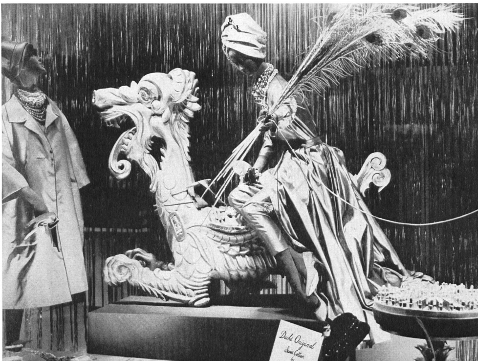
La vitrine du magasin de Lilly Daché à New York The window display of the Lilly Daché shop in New York