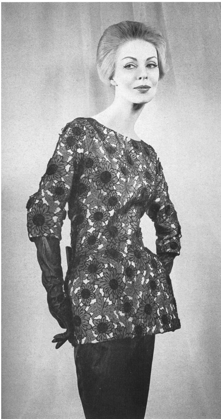
PIERRE CARDIN Organdi brodé nouveauté avec applications de Union S. A., Saint-Gall Grossiste à Paris : Robert Burg & Cie