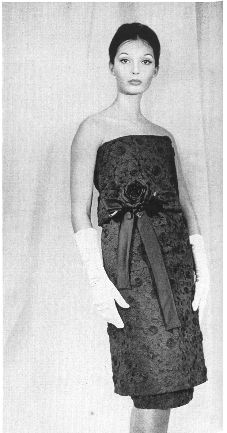
PIERRE CARDIN Organdi brodé nouveauté avec applications de Union S. A., Saint-Gall Grossiste à Paris : Robert Burg & Cie