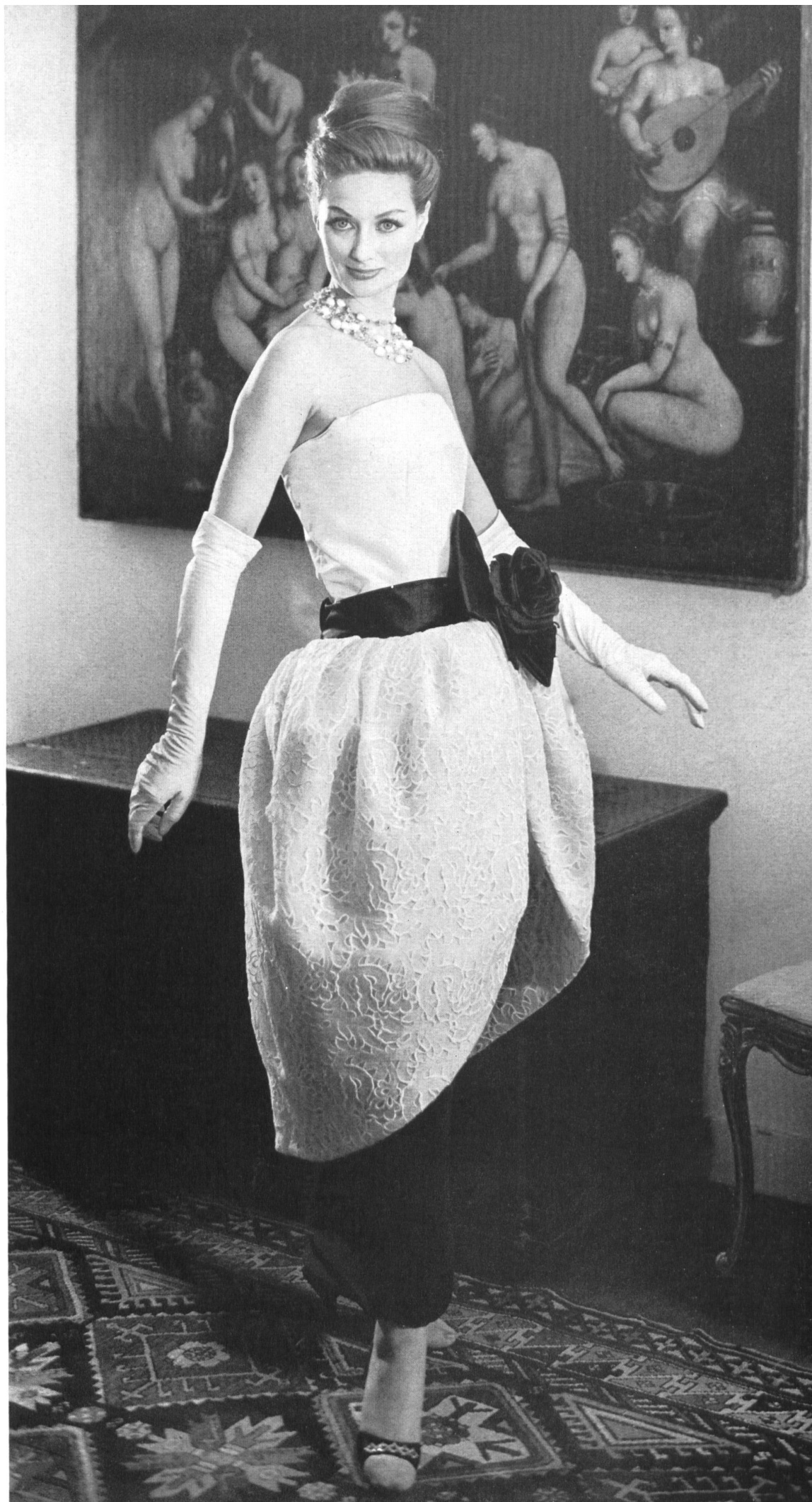
PIERRE CARDIN Organdi blanc brodé et découpé de Théodor Locher & Co., Saint-Gall Grossiste à Paris : Pierre Brivet S.à r.l.