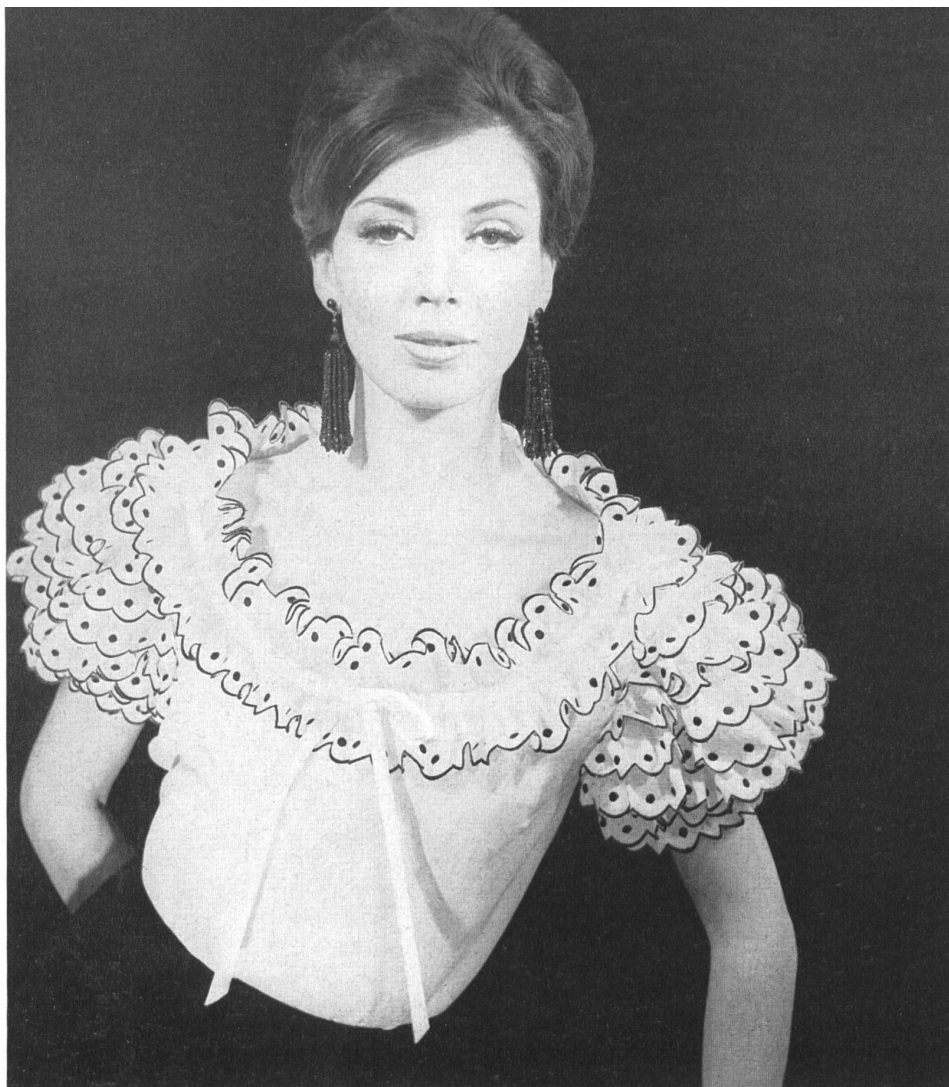
PIERRE BALMAIN (Boutique)

Bandes brodées en noir sur blanc de A. Naef & Cie, Flawil