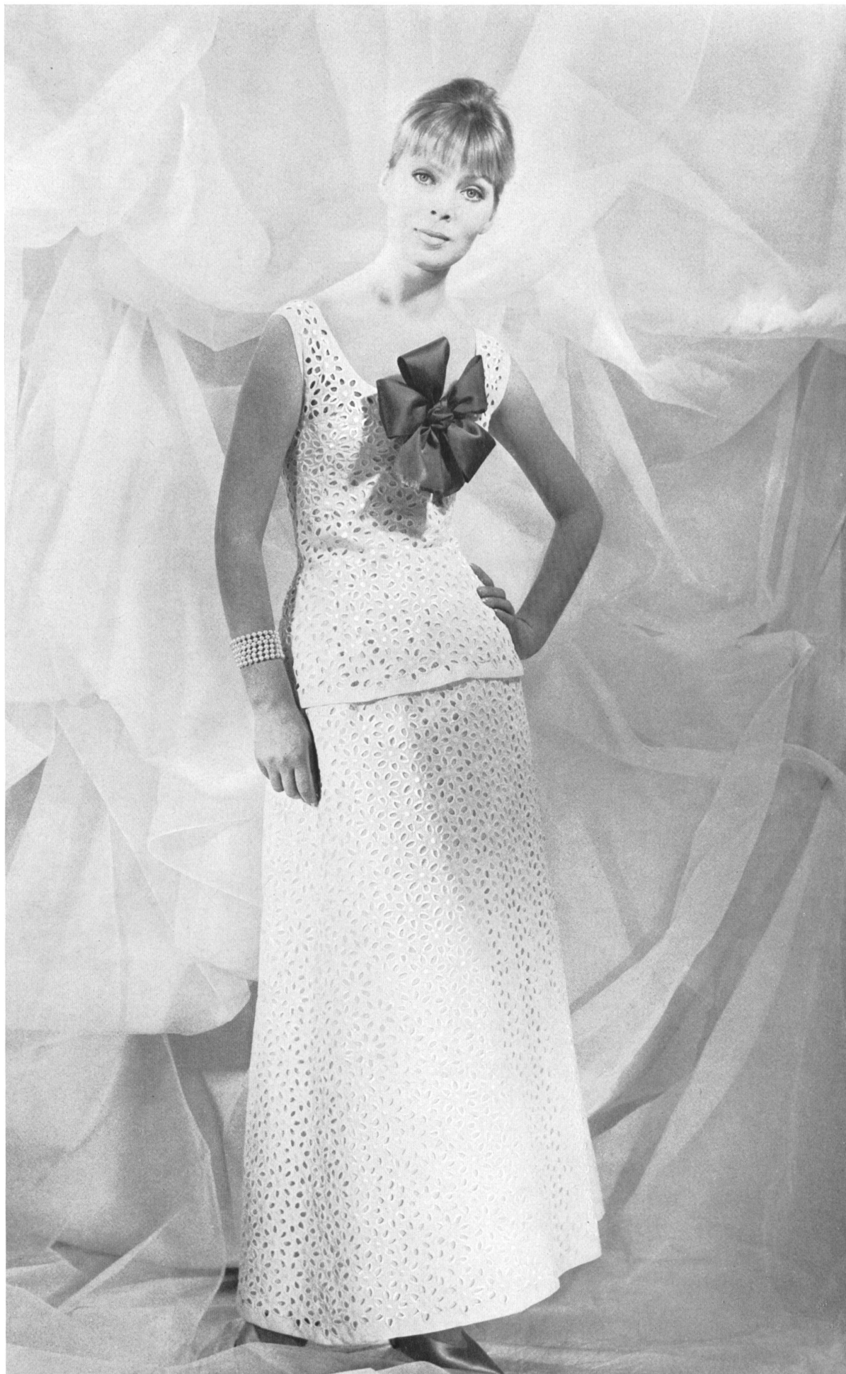
LANVIN CASTILLO Cambrie brodé blanc de A. Naef & Cie, Flawil