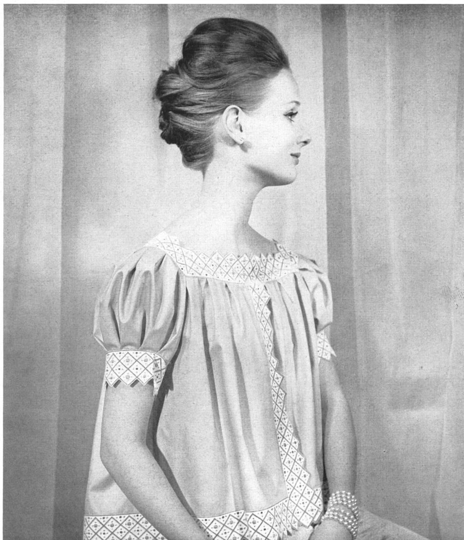
CHRISTIAN DIOR (Boutique)

Bandes brodées en noir sur blanc de A. Naef & Cie, Flawil