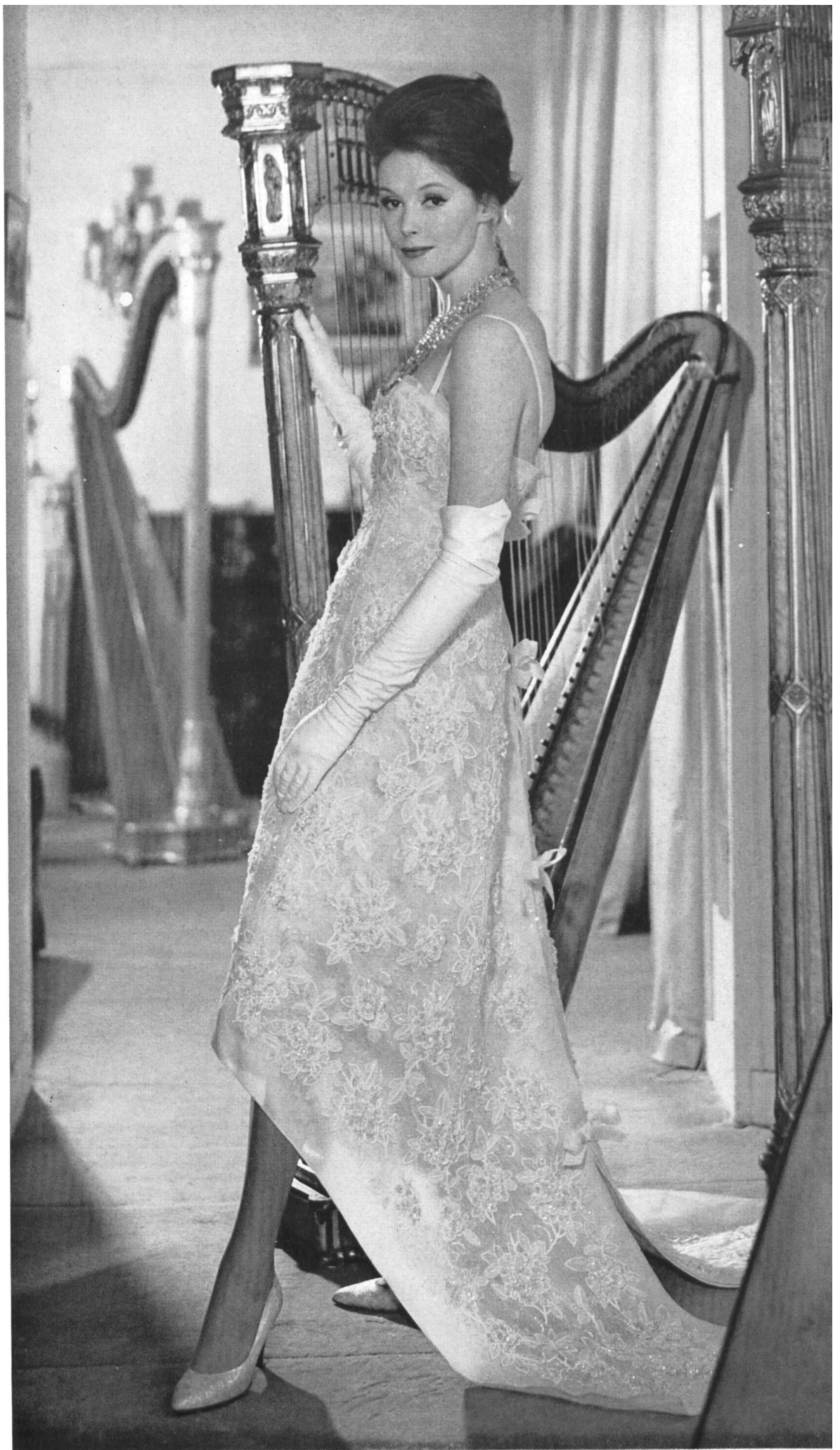
CHRISTIAN DIOR Organdi brodé découpé de Forster Willi & Co., Saint-Gall