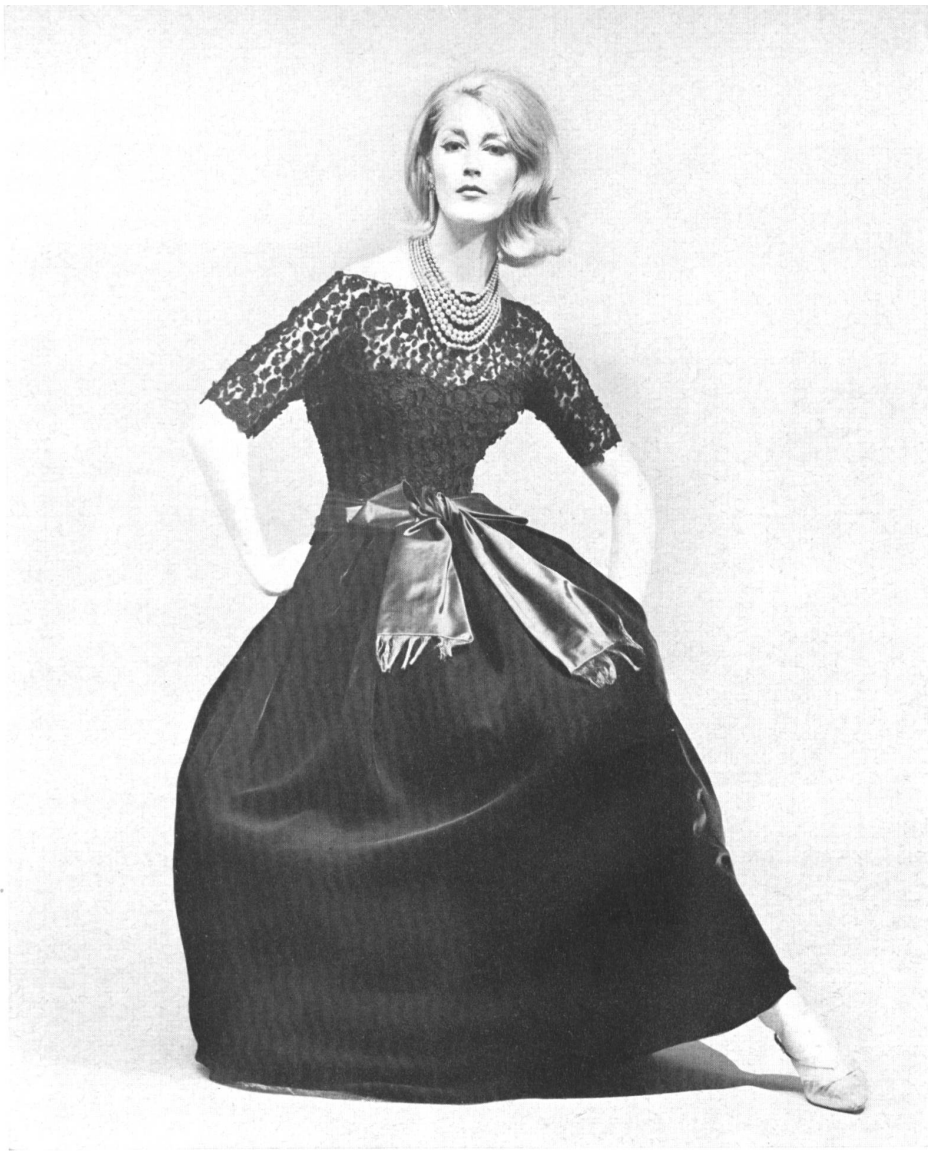
FORSTER WILLI & CO., SAINT-GALL Guipure noire / schwarze Guipure-Spitze Modèle Toni Schiesser, Frankfurt a.M.