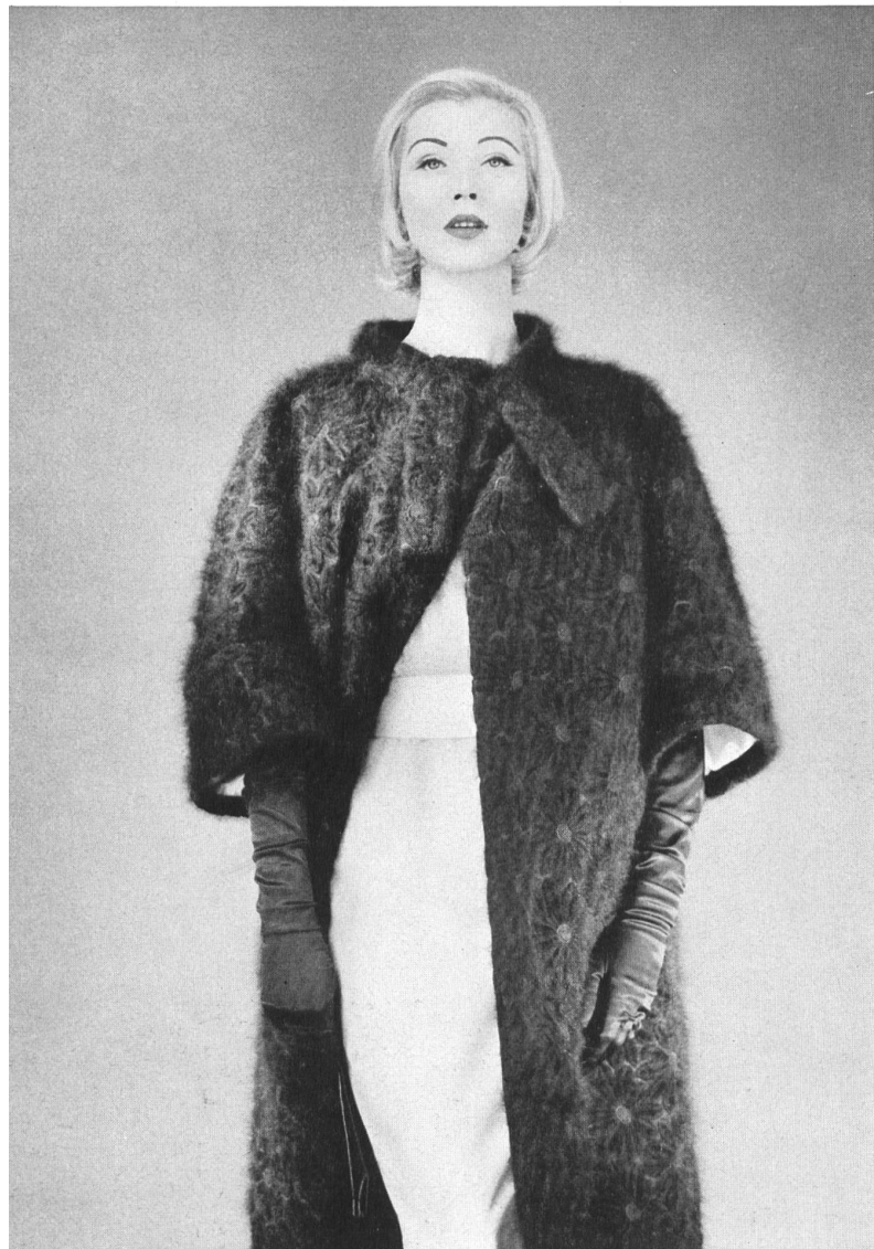
UNION S. A., SAINT-GALL Broderie mohair / Mohairstickerei Modèle Detlev Albers, Berlin