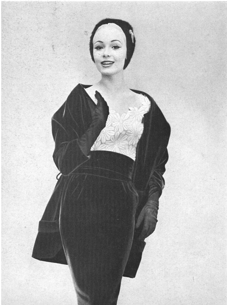
FORSTER WILLI & CO., SAINT-GALL Broderie en style gobelin sur organdi blanc Weisser in Gobelinstil bestickter Organdy Modèle Detlev Albers, Berlin