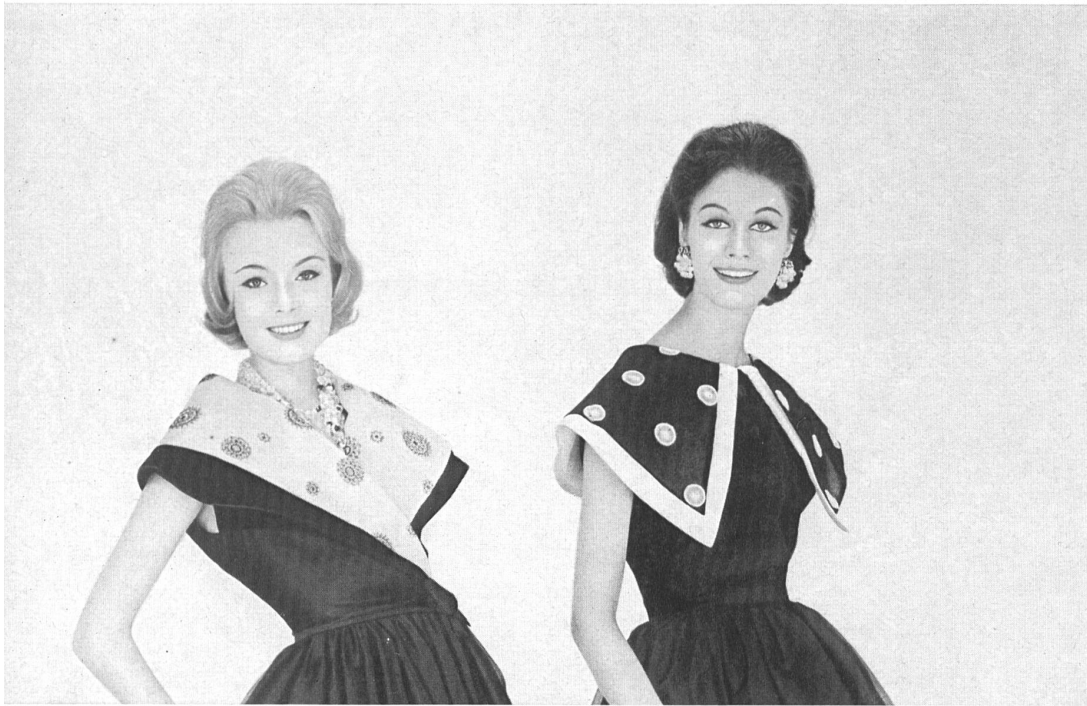
UNION S. A., SAINT-GALL Cols brodés / bestickte Kragen Modèle Zweigler & Co.