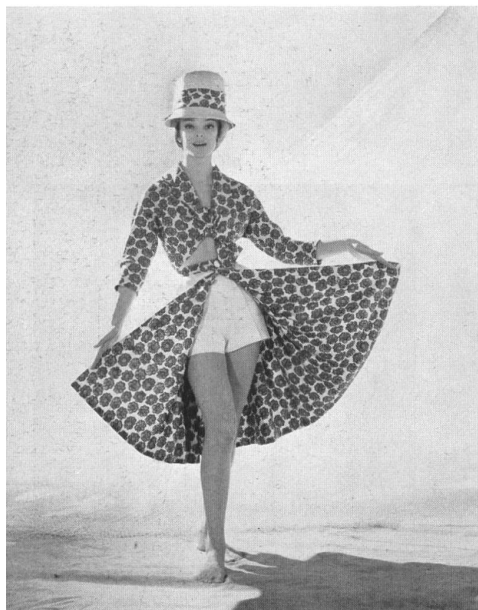
A. BLUM & CO., ZÜRICH

Trois-pièces en « Tri-co-tiss » d'orlon