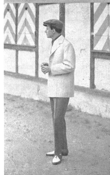
Modèles Ritex