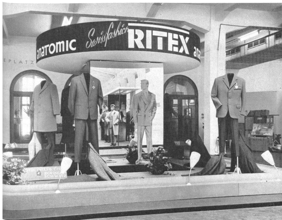
Le stand « Ritex », Roth, Iseli & Cie, Zofingue

letzteren Bezeichnung wollen wir das gewählte Kleidungsstück hervorheben, welches trotz seiner modischen Note, die manchmal sogar an Kühnheit grenzt, das Praktische und Nützliche nicht ausser acht lässt und seine Aufgabe, elegant und tadellos zu kleiden, ganz erfüllt.