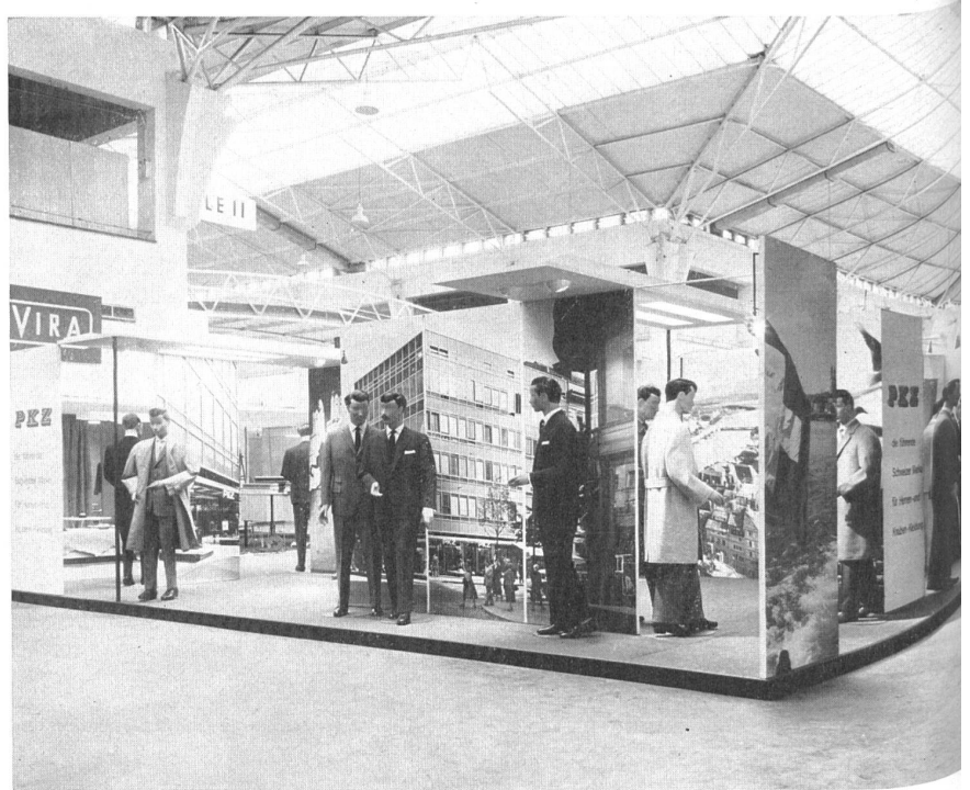
Le stand « PKZ », Burger-Kehl & C o, AG, Zurich.