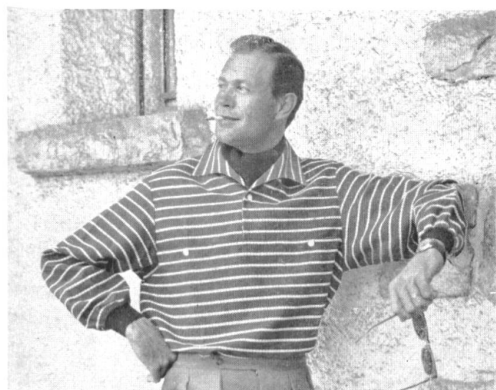
Modèles « Lutteurs », AG. Fehlmann Söhne, Schöftland

letzteren Bezeichnung wollen wir das gewählte Kleidungsstück hervorheben, welches trotz seiner modischen Note, die manchmal sogar an Kühnheit grenzt, das Praktische und Nützliche nicht ausser acht lässt und seine Aufgabe, elegant und tadellos zu kleiden, ganz erfüllt.