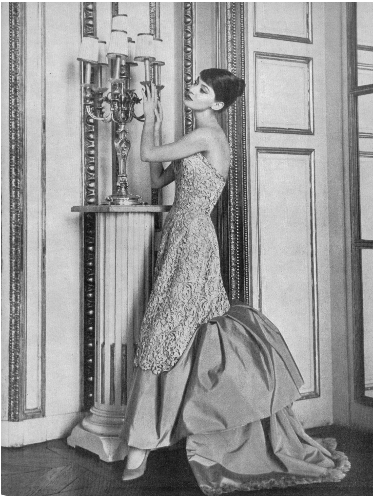
JEAN DESSES Guipure en lamé or de Forster Willi & Co., Saint-Gall Grossiste à Paris : Les Tisseurs B de M