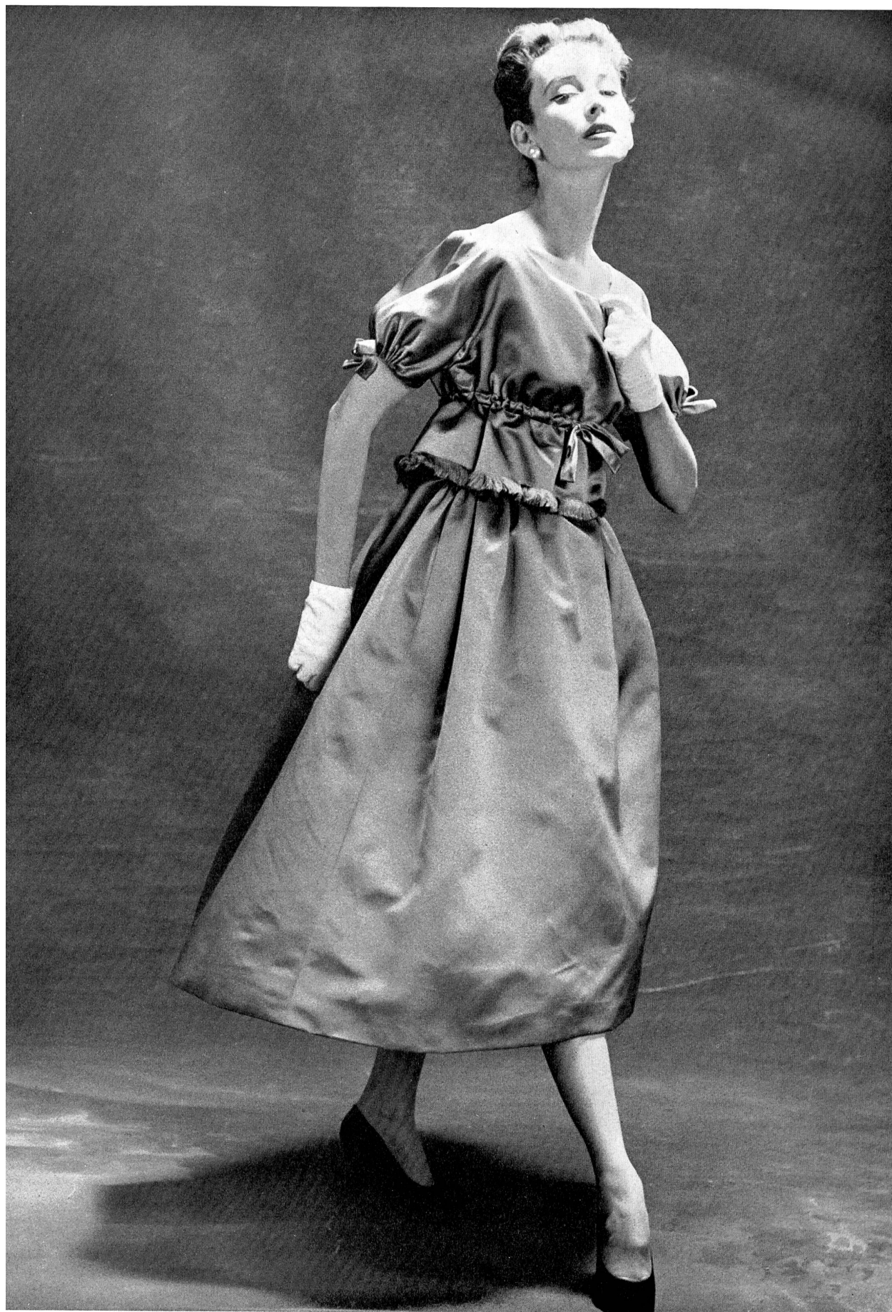
HUBERT DE GIVENCHY

Tous les documents de Paris reproduits dans ce numéro représentent des modèles réservés dont la reproduction est interdite