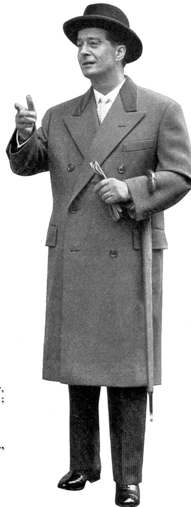
Schweiz: Zweireihiger, klassischer Überzieher; schweres, blaugraues, reinwollenes Shetland von