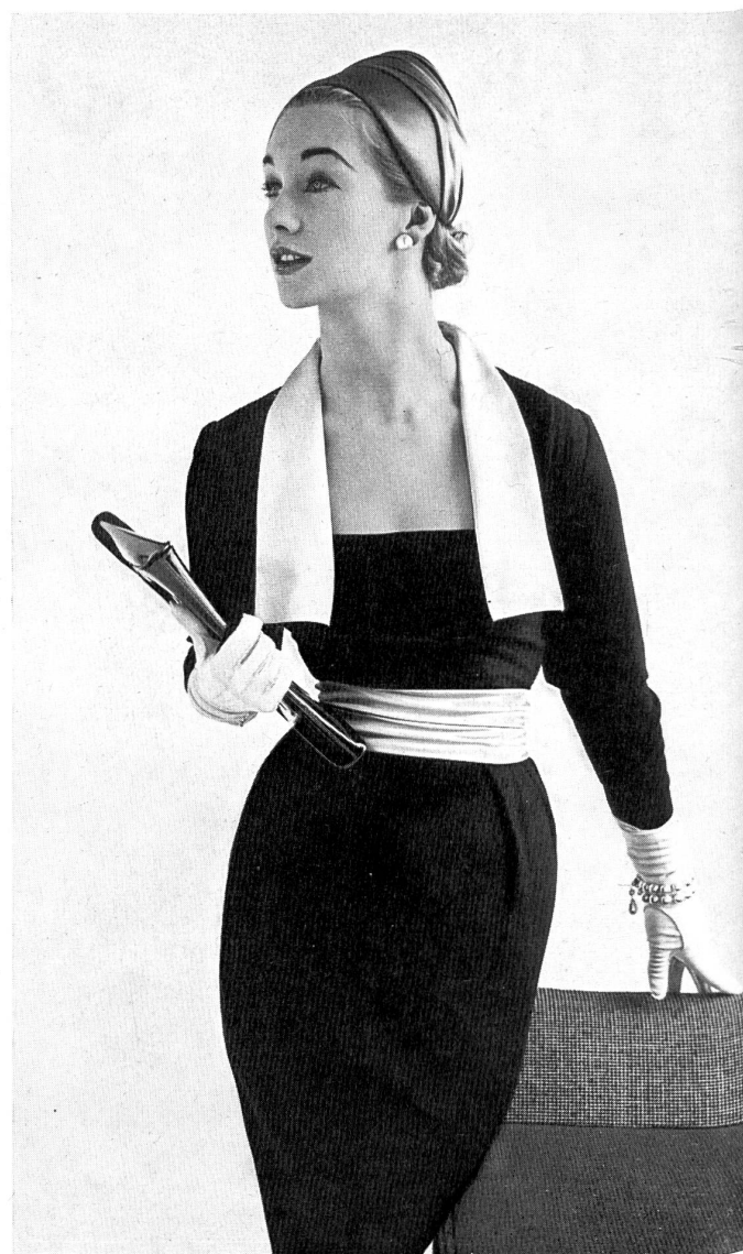
L. ABRAHAM & Co., SILKS Ltd., ZURICH

In den Salons von einem der grössten Importhäuser von Schweizer Modellkonfektion habe ich etliche Kollektionen verschiedener, wohl bekannter Fabrikanten gesehen, die sich alle in der Herstellung von Qualitätsprodukten einen Namen gemacht haben. Darunter war ein reizendes Jacquard-Ensemble (Egeka), wie geschaffen für Abende des Ausruhens zu Hause, welches aus einer Keilhose mit