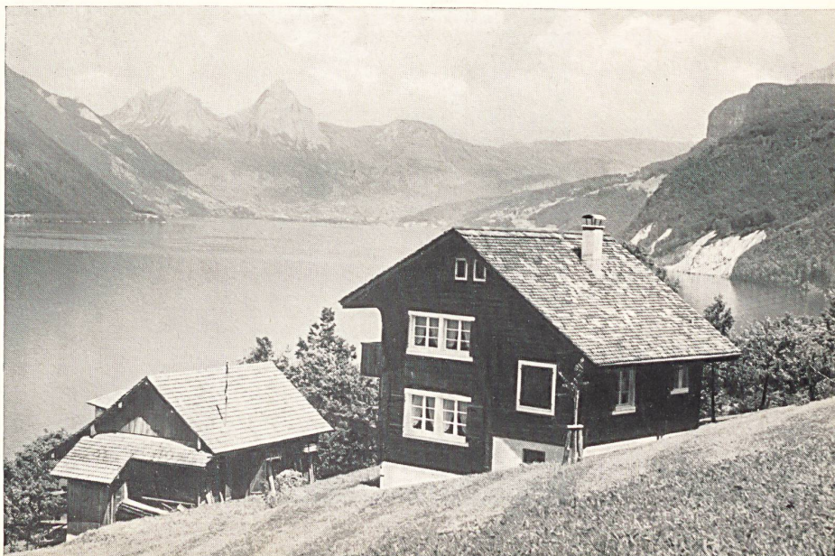
Eines der Ferienheime für die Mitarbeiter der Firma in Beckenried bei Luzern.

Der Jubiläumsband der Spinnerei an der Lorze darf unbedenklich als das Muster einer Firmengeschichte bezeichnet werden. Der Verfasser hat das reichhaltige Aktenmaterial nicht nur mit grosser Sachkenntnis ausgewertet, sondern auch zu einer sehr prägnanten Darstellung verarbeitet und damit einen Beitrag zur schweizerischen Industrie- und Wirtschaftsgeschichte der letzten hundert Jahre geliefert, der den besten Leistungen auf diesem Gebiet an die Seite gestellt werden darf.