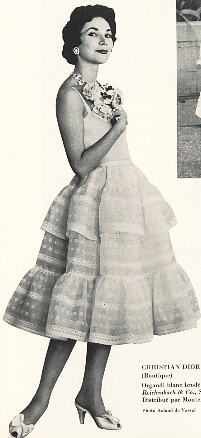
CHRISTIAN DIOR (Boutique)

Organdi blanc brodé de Reichenbach & Co., Saint-Gall Distribué par Montex, Paris