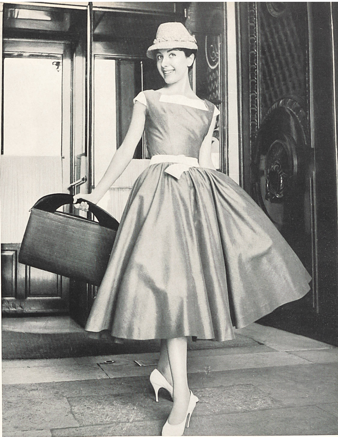
JEANNE LANVIN / CASTILLO Fil à fil marron, soie et coton, de la S.A. Stünzi Fils, Horgen