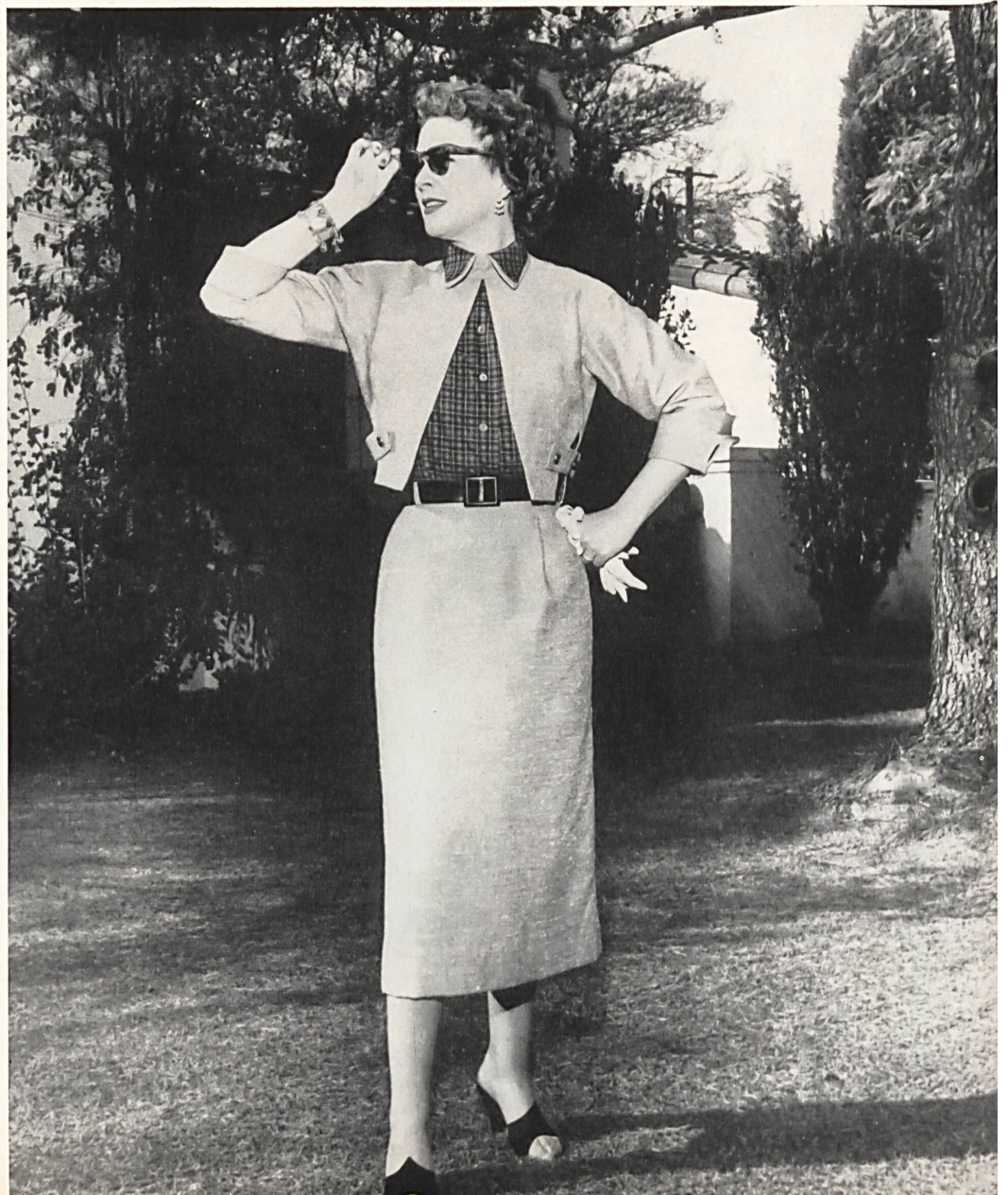
«Zürrer» Plain Flisca fabric by Weisbrod Zuerrer Fils, Hausen s.A.

Diese frühen Talentproben wurden jedoch von niemandem besonders ernst genommen; da sie ein ausgesprochen hübsches Kind war, wurde ihr sehr bald von Bekannten und Verwandten gesagt, sie sei für die Bühne