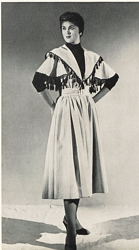
Spun rayon coat dress. «Zürrer» fabric by Weisbrod Zuerrer Fils, Hausen s.A.

Um herauszufinden, was das Publikum eigentlich verlangte, eröffneten die beiden Schwestern ein Detailgeschäft, und kamen nach einem — höchst erfolgreichen — Jahr zum Schluss, dass die Frauen en masse wenig Geschmack haben, dabei aber wissen, was sie wollen und gute Kleider kaufen, wenn sie sie finden. Auf Anregung eines Einkäufers für feine Fachgeschäfte nahmen sie auch die Modellkonfektion auf. Ihr Salon in entzückend weiblicher Art ausgestattet, auf die geringste Provokation hin wird Tee und Kaffee serviert, sie sind stets zu allerlei