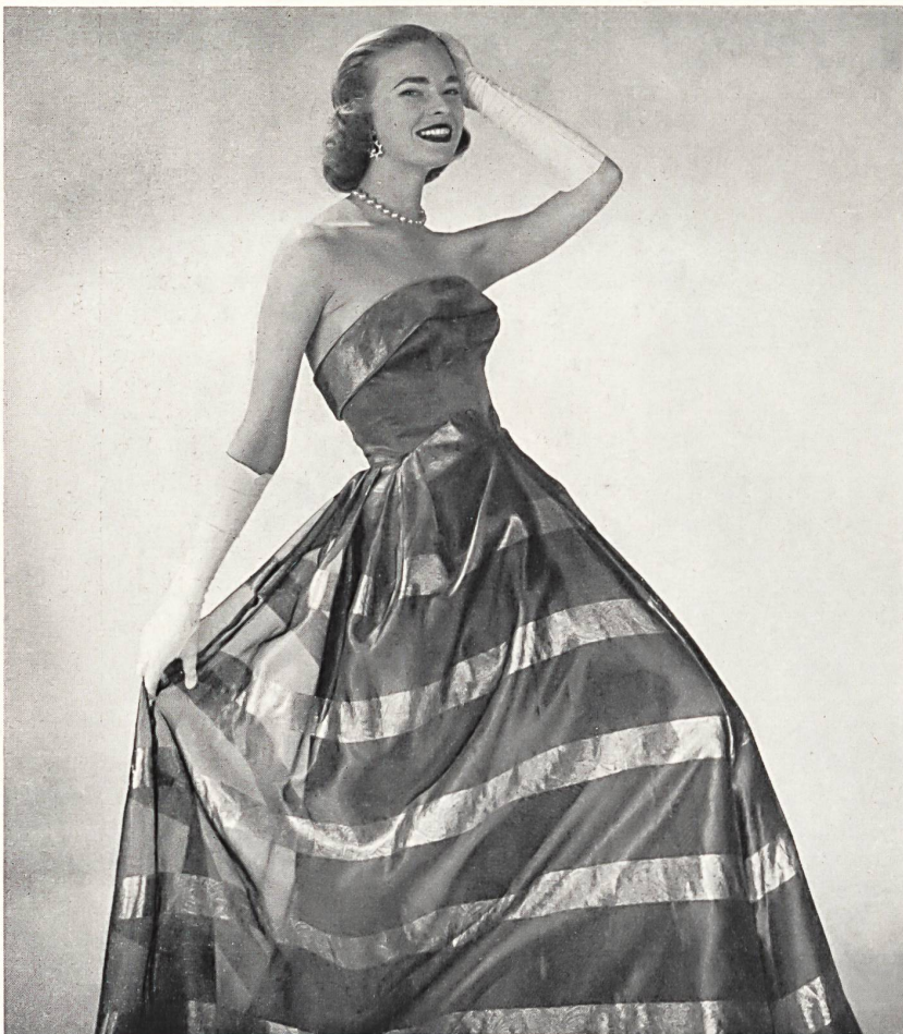
Frank Usher Ltd., London

Bei Marshall & Snelgrove erwartete mich eine Überraschung: köstliche Wollunterwäsche von Hanro, in kräftigen Tönungen, rot, grün, zitronengelb, lila und sogar schwarz usw. Eine solche Farbenpracht an Unterhosen