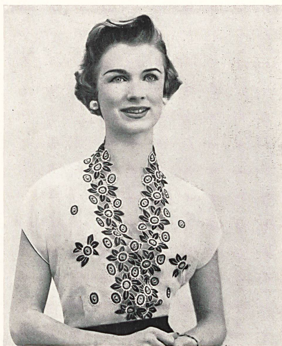
Kates C.L., London

Elegant blouse featuring Swiss washable diamante studded embroidery.