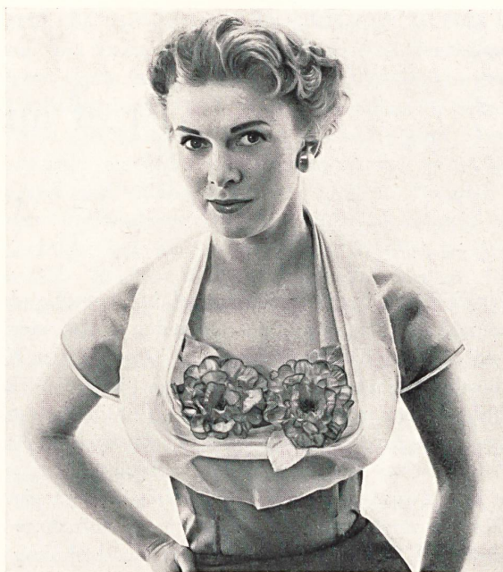
Kates C.L., London

Den Läden der mittleren Preislage ist es nun möglich, diese Artikel zu annehmbaren Bedingungen zu liefern und der Verkaufserfolg scheint gesichert, einerseits weil die Kundenschaft auf Reisen verschiedene Qualitäten vergleichen konnte, andererseits weil die schweizerischen Produkte einen guten Ruf geniessen.