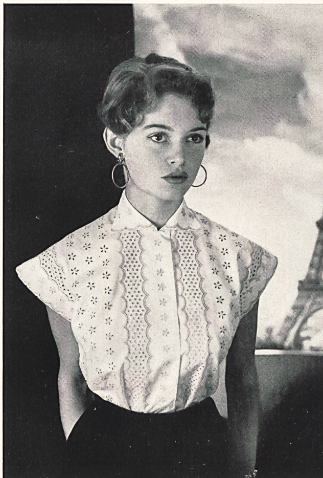
Moden S. A., Montreux « SAMODE »

Robe de belle guipure doublée organza, en teintes mode ; blouse de fine popeline richement brodée ; blouse d'organza pure soie brodée, avec manches de coupe nouvelle.