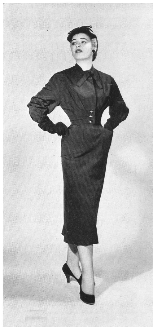
CHRISTIAN DIOR, NEW YORK

« Amadis » silk by L. Abraham & Cie, Soieries S. A., Zurich.