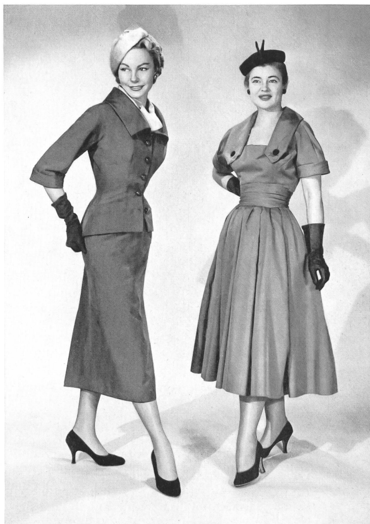
CHRISTIAN DIOR, NEW YORK

Die amerikanischen Webereien sowie die Stofffabriken der Schweiz und anderer europäischer Länder wetteifern zur Zeit in erfinderischer Phantasie, und man kann wohl sagen, dass der Markt überschwemmt wird von einer ganz ausserordentlichen Vielfalt schöner Gewebe. Es