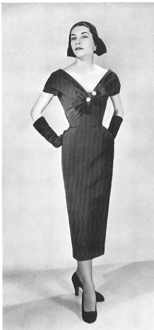
CHRISTIAN DIOR, NEW YORK

« Amadis » silk by L. Abraham & Cie, Soieries S. A., Zurich.