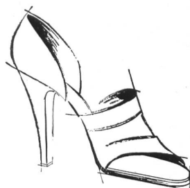
Der hohe Absatz (von 72 bis zu 80 mm)

Der mittelhohe Absatz, neuerdings von Dior propagiert, bleibt der Favorit der Dame.