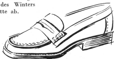
Les petits Riens (für die Ferien)

Florida inspirierte Modelle auch für heisse Tage in der Stadt. Eine Orgie von Leichtigkeit löst des Winters schwere Gummi-Silhouette ab.