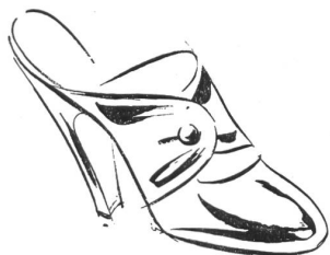
In der Atlantik-Sphäre

für die beginnende Saison vorgeschlagenen Nouveautés vertraut zu machen, zuerst bei einer thematisch gegliederten Ausstellung, dann im Laufe einer von den Kreaturen selber kommentierten Vorführung durch einige Mannequins. Wir können hier nicht auf alle Einzelheiten eingehen und wollen uns darauf beschränken, nachstehend die kurzen Notizen aus dem Katalog der Veranstaltung mit einigen Zeichnungen wiederzugeben: