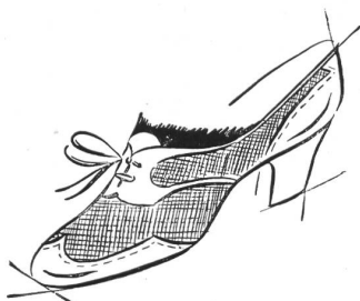
Der mittlere Absatz (von 35 bis zu 58 mm)

Der jugendlich flache Absatz, einmal mit sportlichem Akzent, einmal in leichter Ausführung.