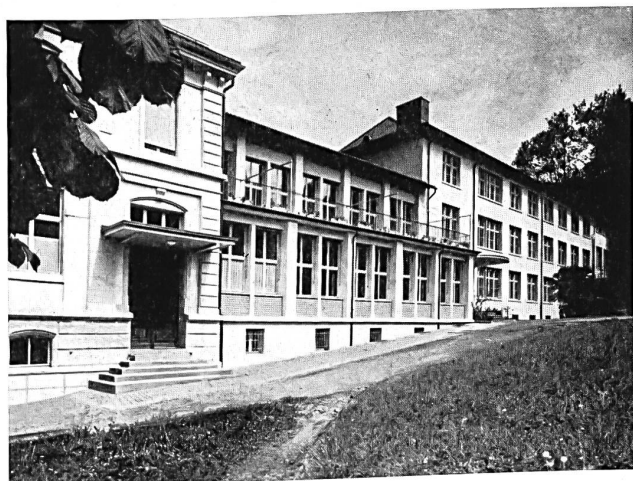
Teilansicht der Webschule Wattwil. Links der alte, die Verwaltung beherbergende Gebäudeteil; rechts eine der Neubauten, in der ein Maschinensaal untergebracht ist; in der Mitte, ehemaliger Maschinensaal umgebaut in Zeichensaal und Hörsaal.

Wir haben hier schon zu wiederholten Malen von dieser interessanten Fachschule gesprochen *. Heute möchten wir, allerdings mit einer durch die Umstände bedingten Verspätung, auf die im Juni dieses Jahres stattgefundene Einweihung der neuen Räumlichkeiten dieser Schule hinweisen.