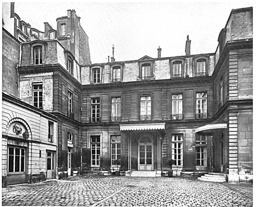
Schweizerische Gesandtschaft in Paris ; Eingangshalle.

Um diese Angaben zu vervollständigen sei noch erwähnt, dass die Textilien in den Handelsbeziehungen zwischen Frankreich und der Schweiz schon seit langer Zeit eine wichtige Rolle spielen. So betrug 1938 die Gesamtausfuhr der Schweiz nach Frankreich 121,4 Millionen Schweizerfranken, wovon 13,7 Millionen auf Textilprodukte entfielen, während die schweizerische Einfuhr aus Frankreich 229,2 Millionen Schweizerfranken