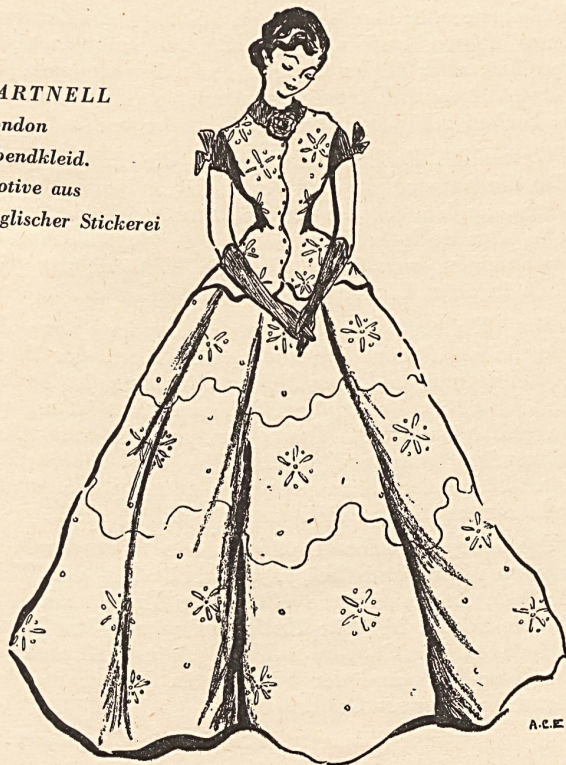
HARTNELL London Abendkleid. Motive aus englischer Stickerei