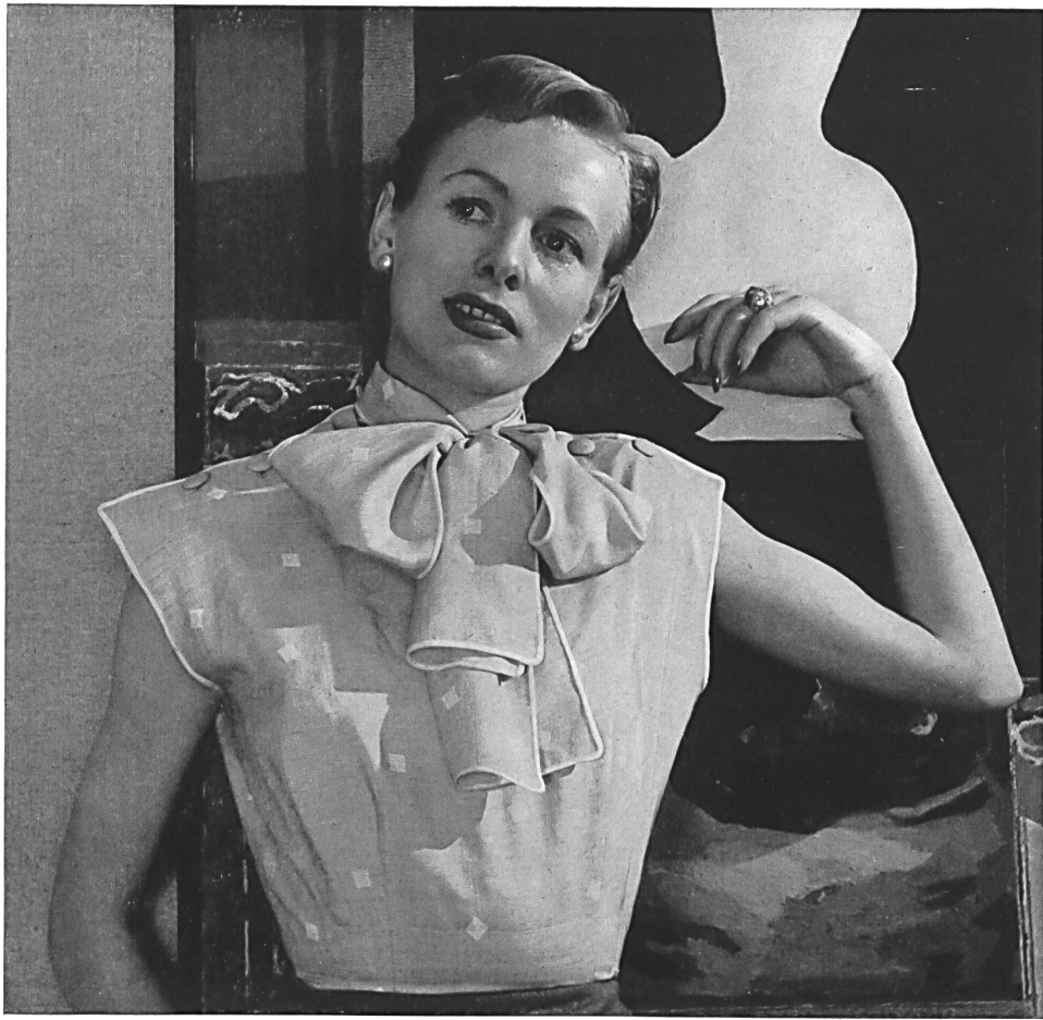
PIERRE BALMAIN L. Abraham & Cie Soieries S. A., Zurich