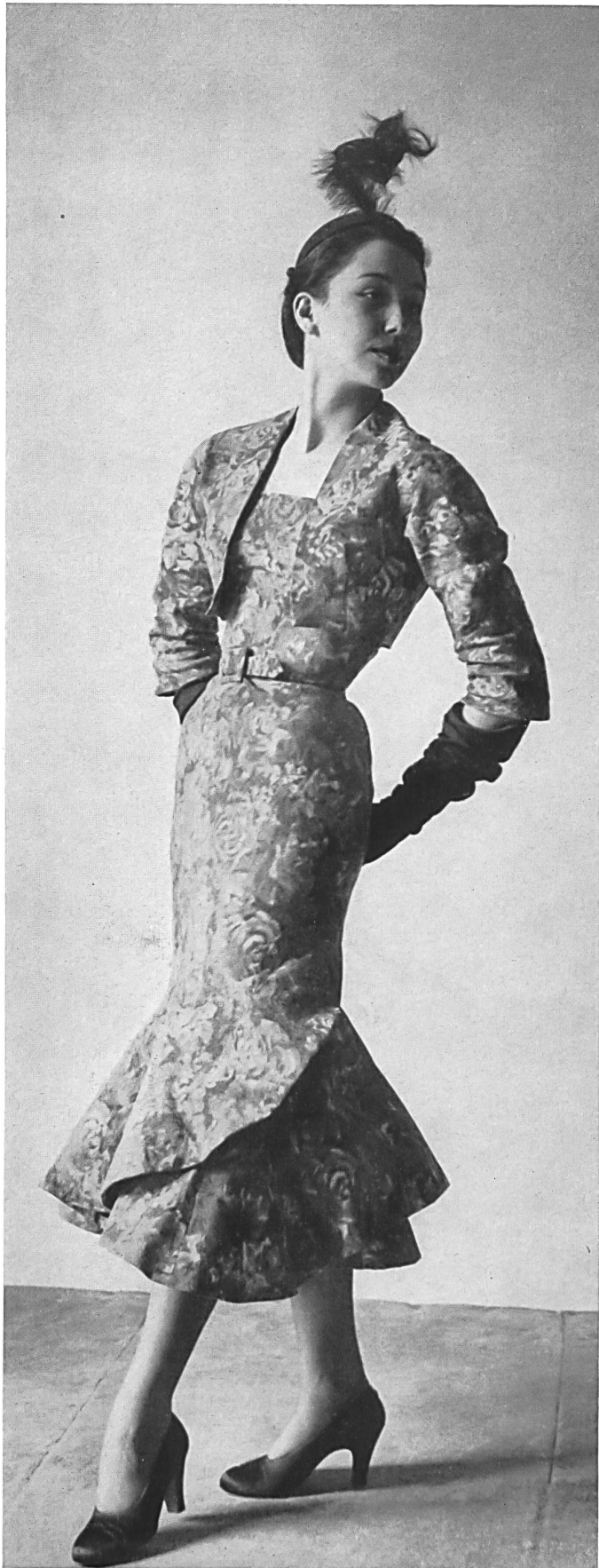
BALENCIAGA L. Abraham & Cie Soieries S. A., Zurich INAMO, ZURICH

CHRISTIAN DIOR → L. Abraham & Cie Soieries S. A., Zurich INAMO, ZURICH