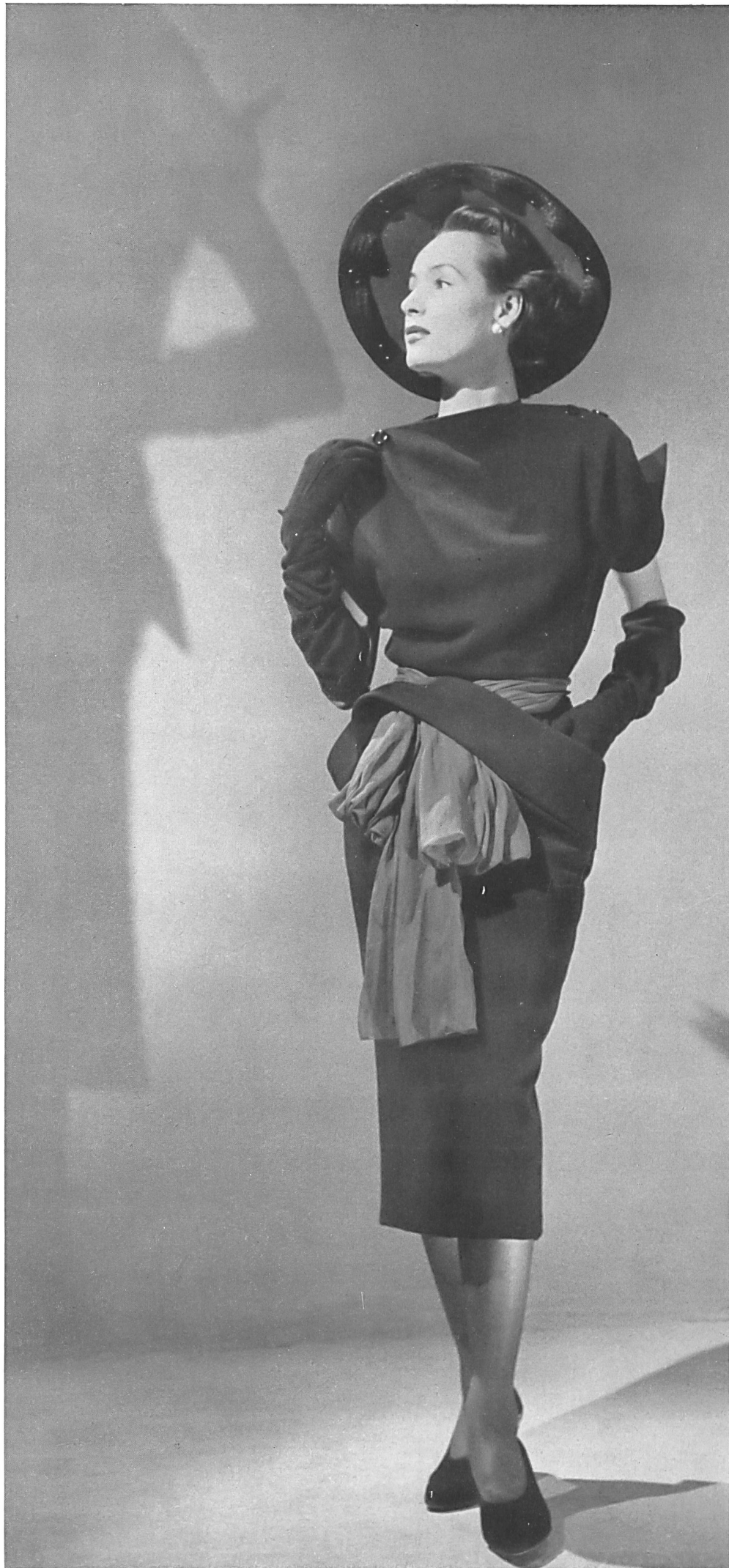
CHRISTIAN DIOR Emar S. A., Zurich INAMO, ZURICH