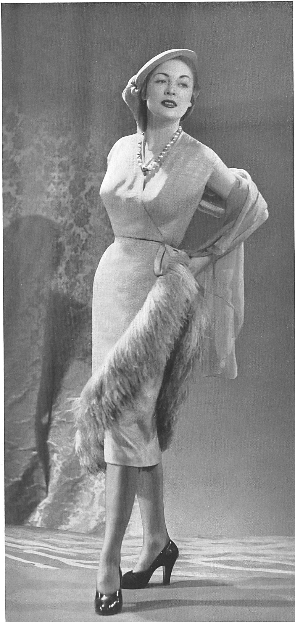
PIERRE BALMAIN Rudolf Brauchbar & Cie, Zurich