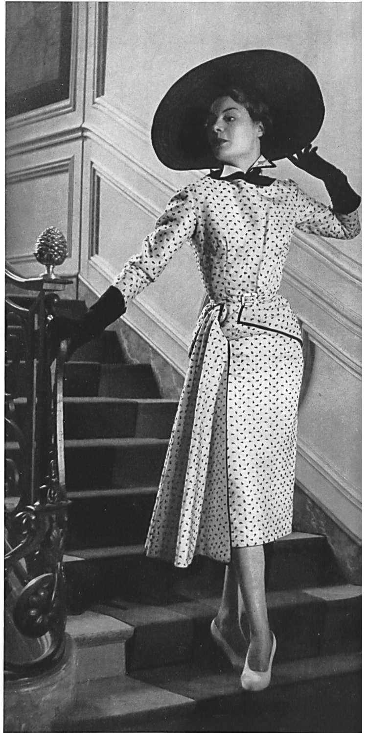
JACQUES FATH L. Abraham & Cie Soieries S. A., Zurich

CHRISTIAN DIOR → L. Abraham & Cie Soieries S. A., Zurich INAMO, ZURICH