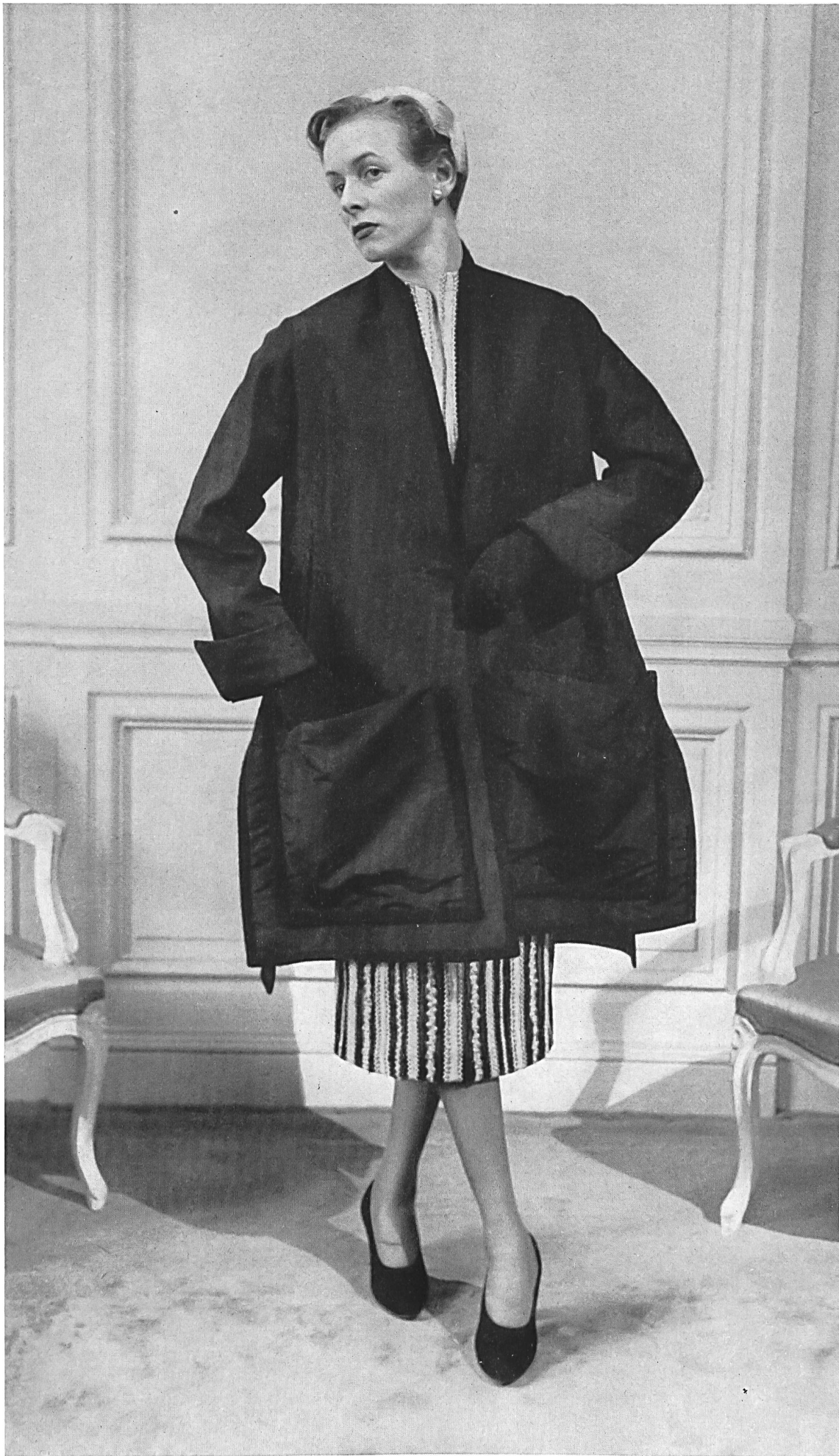
CHRISTIAN DIOR S. A. Stünzi Fils, Horgen