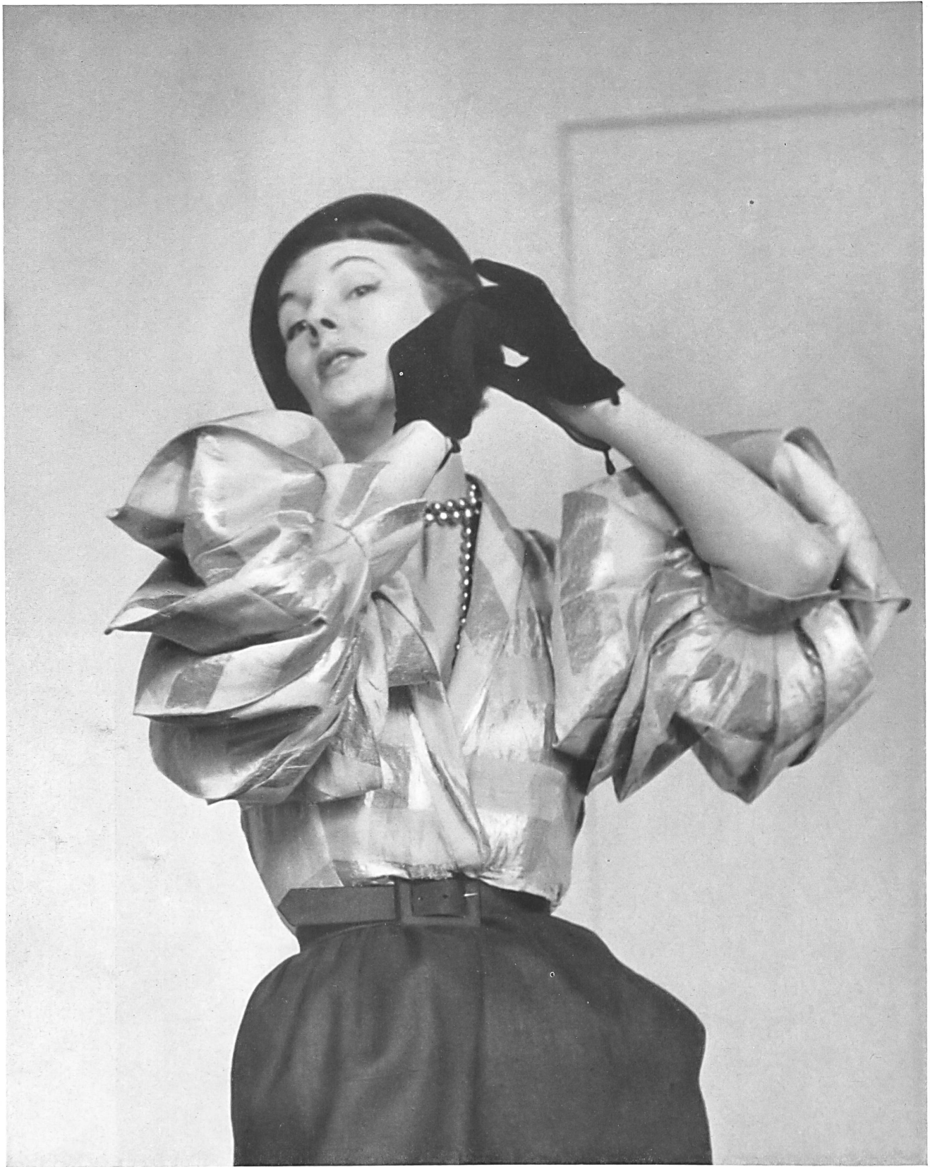
SCHIAPARELLI Heer & Co. S. A., Thalwil INAMO, ZURICH