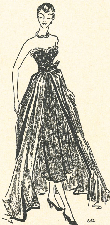
Spectators Sports, Londres. Abendkleid in schweizerischen Satin und Tüll.