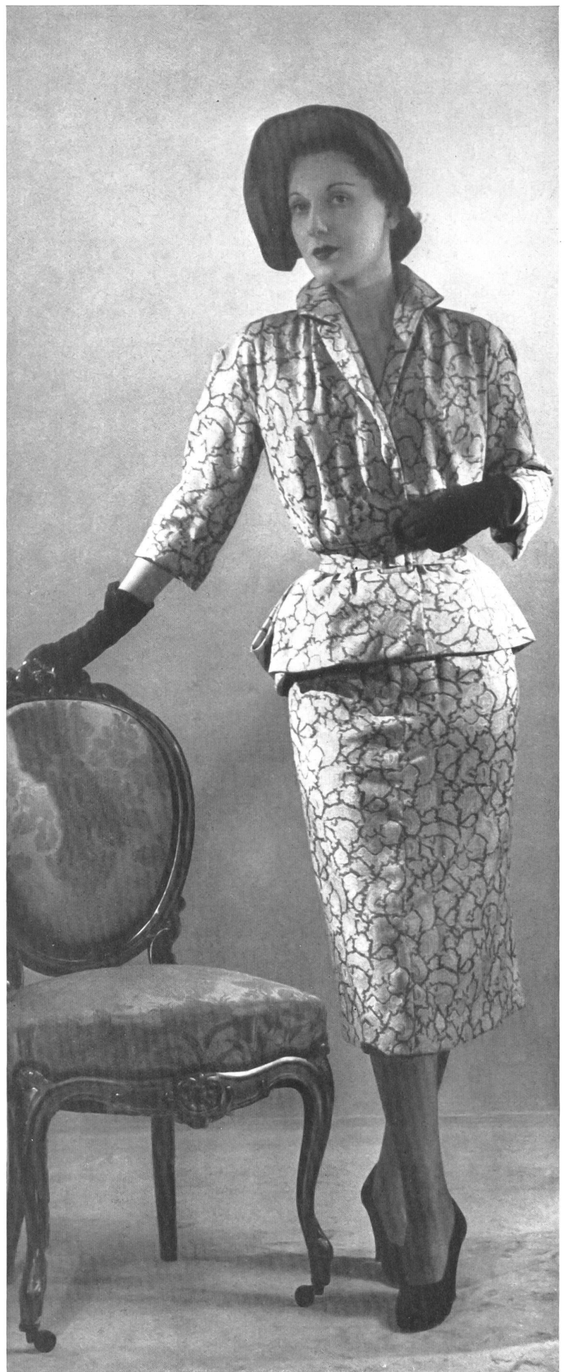
JACQUES GRIFFE L. Abraham & Cie, Soieries S.A., Zurich