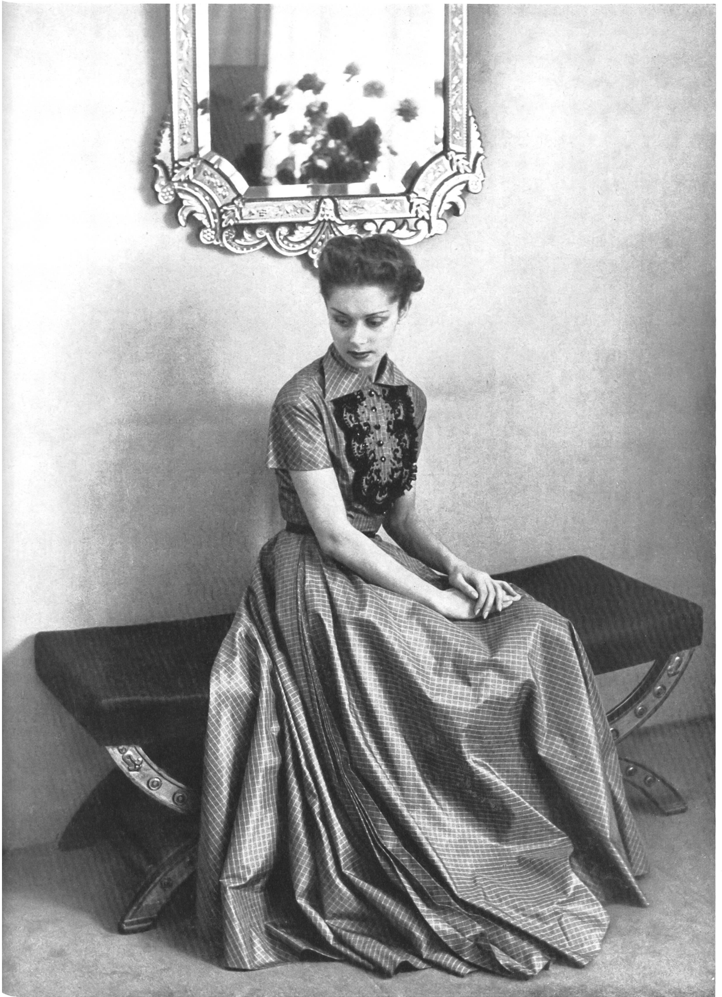
PIERRE BALMAIN L. Abraham & Cie, Soieries S.A., Zurich