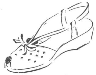
« Jeunesse »