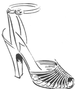
« Paris »