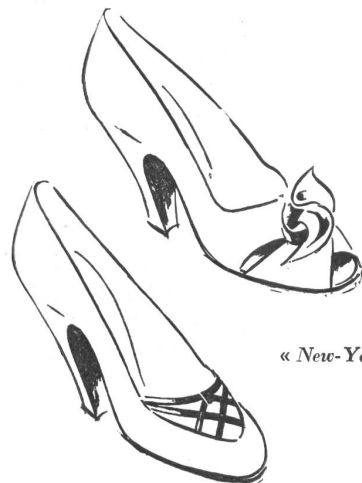
« New-York »