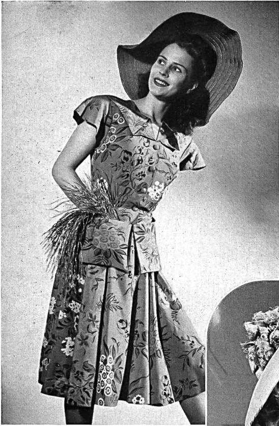
Rob. Schwarzenbach & Co., Thalwil. Toile Douppion Zellwolle bedruckt. Modell Sauvage Couture.