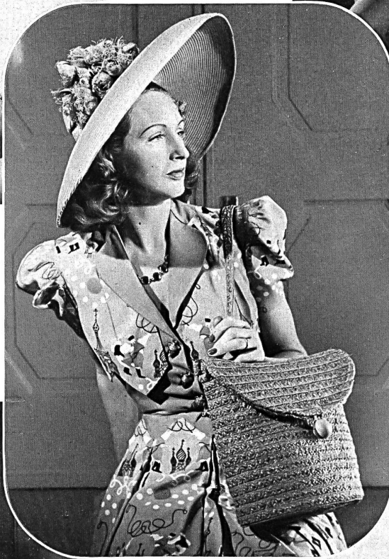
Stoffel & Co., St. Gallen. « Cretesto » Zellwolle bedruckt. Otto Steinmann & Co. A.-G., Wohlen. Hut- und Taschen- geflechte. Modelle I. und R. Polla.