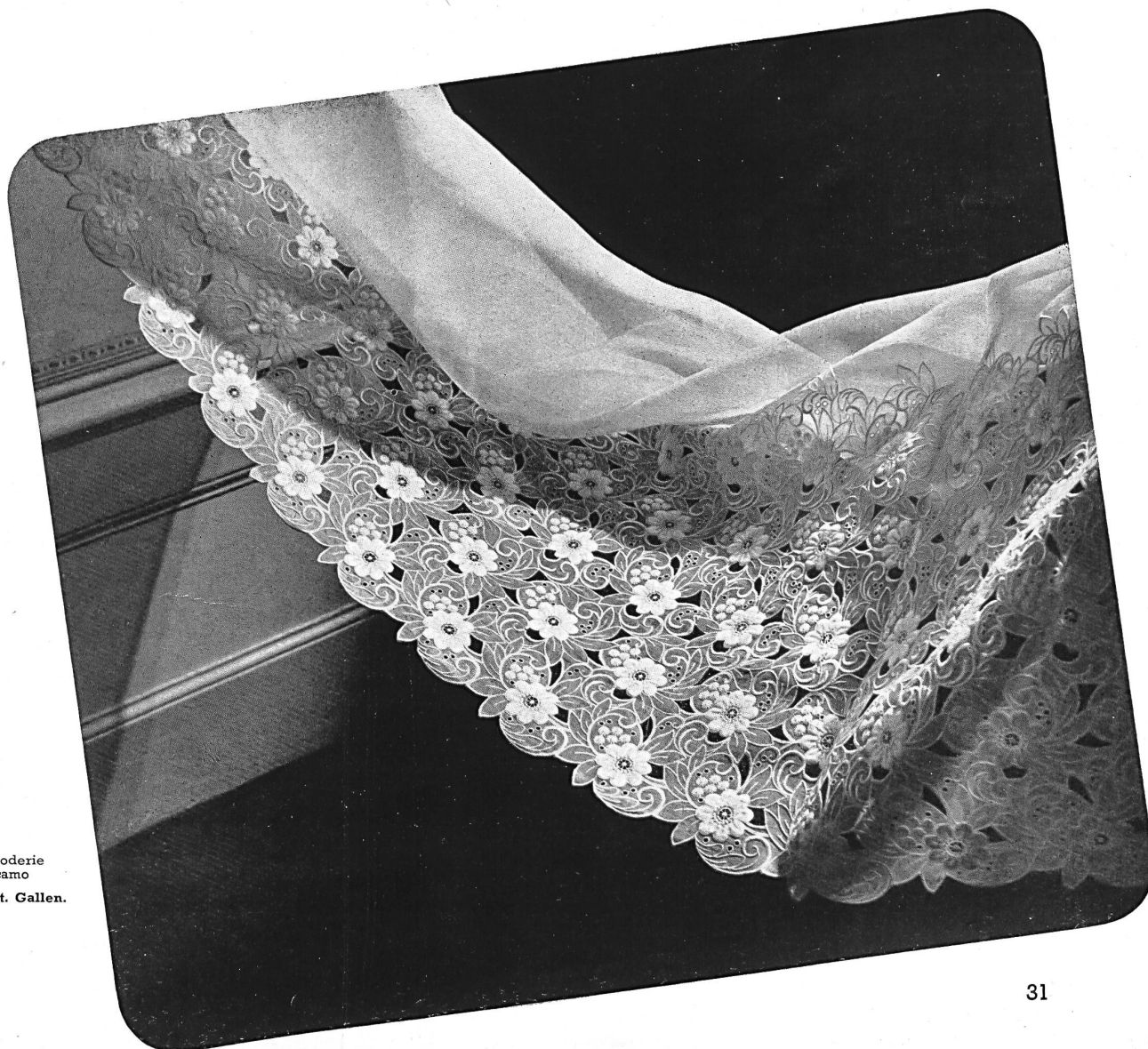
Stickerei — broderie bordado — ricamo Union A.-G., St. Gallen.

Sehr deutlich sind zwei Richtungen erkennbar bei den schweizerischen Stickereifabrikanten: bestickter Organdi und Plattstichstickereien, die in immer neuen und originellen Ausführungen und in der Mode entsprechenden Farben erscheinen, kennzeichnen die erste — die ältere — dieser Richtungen. Völlig neue « Dentelles de ficelle » und « Laizes », deren Möglichkeiten interessant und unvorhergesehen sind, dürften für die zweite dieser Richtungen charakteristisch sein. Die absolut neue und in ihrer Finesse reizende Farbtönung « Ecume nacree » ist der erste Erfolg St. Gallens in dieser neuen Richtung.