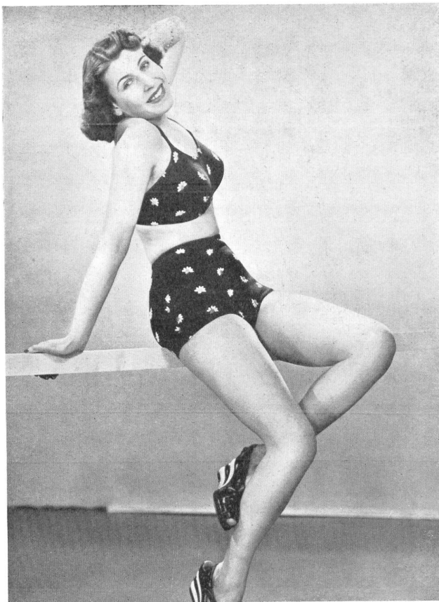
Modelle A. G. vorm. W. Achtnich & Co., Winterthur.