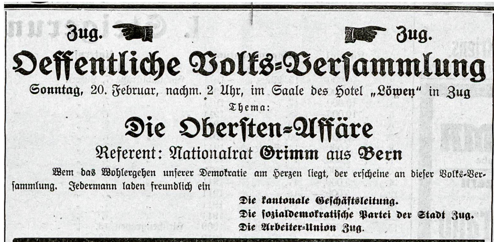
Abb. 1 Einladung zur Volksversammlung am 20. Februar 1916 zur «Obersten-Affäre». Das Inserat erschien im «Central-schweizerischen Demokrat» vom 19. Februar 1916. Das «Sozialdemokratische Tagblatt für die Innerschweiz», wie sein Untertitel lautete, war eine Tageszeitung, die in Luzern herausgegeben wurde. Ihre Zuger Auflage belief sich auf etwa 200, was weniger als 2 Prozent der Zuger Haushalte entsprach.