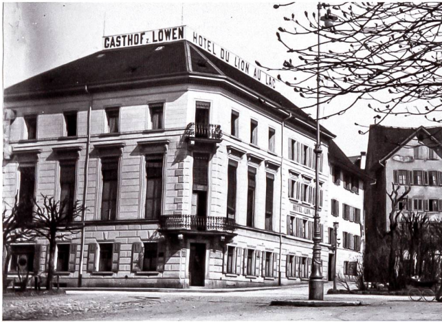
Abb. 2 Das Hotel Löwen am Landsgemeindeplatz in Zug um 1900. Dessen Saal war schon lange vor dem Beginn der Volksversammlung um 14 Uhr voll. Auf Vorschlag der bereits anwesenden Bürgerlichen verschoben die sozialdemokratischen Organisatoren den Anlass zwanzig Minuten vor Beginn in die naheliegende Burghachtturnhalle.

keit, ja Verachtung gegenüber völkerrechtlichen Vorschriften als Beweis militärischen Denkens betrachtet wurde!» 5