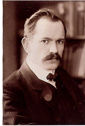
Abb. 5 Robert Grimm (1881–1958) im Jahr 1916. Grimm, politischer Kopf der Sozialdemokraten, Nationalrat und Redaktor, war Hauptredner an der Zuger Volksversammlung. Der Organisator der internationalen Friedenskonferenzen von Zimmerwald und Kiental (1915/16) war damals dabei, die SP auf einen antimilitaristischen Kurs zu bringen. Nicht zuletzt deshalb war er das grösste Feindbild der Bürgerlichen.

auf stark 1000 Mann angewachsene Versammlung eröffnen.» Der Text mit dem biblischen Titel «Grimm in der Löwengrube» fährt weiter mit Anspielungen auf andere linke Feindbilder: «Bei Bestellung des Bureaus wurden ihm zwei «Obersten» [...] zur Seite gegeben.» 19