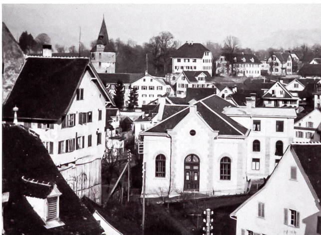
Abb. 4 Die Burgbachtturnhalle (Bildmitte, um 1900), in der die gut tausend Teilnehmer der Volksversammlung knapp Platz fanden. Deren grosse Mehrheit waren Bürgerliche, die von ihren Parteien seit Tagen heimlich mobilisiert worden waren. Die Konservativen und Freisinnigen riefen erst kurz vor dem Anlass offiziell dazu auf, den von der SP organisierten Anlass zu besuchen, womit es ihnen gelang, die Linke zu überraschen.

Am 20. Februar war der Andrang derart riesig, dass die SP-Veranstaltung nicht im Gasthaus Löwen stattfinden konnte. Der Zuger Korrespondent des «Vaterlandes», des in Luzern publizierten Zentralorgans der Katholisch-Konservativen, war Zeuge des Eintreffens von Grimm und Belmont: «Als der sozialdemokratische «Generalstabschef» Dr. Belmont mit «General» Grimm 20 Minuten vor 2 Uhr im «Löwen» erschien, wurde ihm von bürgerlicher Seite vorgeschlagen, die Tagung in die grosse Halle [= Burgbachtturnhalle] zu verlegen. Dr. Belmont lenkte ein und punkt 2 Uhr konnte er dort die