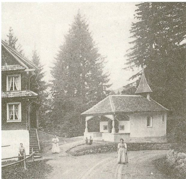
Abb. 2 Schlachtkapelle in der Schornen bei Sattel, erstmals erwähnt 1501. Für die Schwyzer war die schlichte Kapelle das Denkmal für die Schlacht am Morgarten; sie stand für die – verklärte – Erinnerung an die Taten der bescheidenen, gottesfürchtigen Vorfahren. Das 1908 eingeweihte Denkmal auf Zuger Boden empfanden die Schwyzer als unbotmässige Konkurrenz.

kultur. 3 An der Feier von 1891 sprach man denn auch erstmals davon, im Schwyzer Talkessel mit Bundeshilfe ein grosses Nationaldenkmal zu errichten. 4 Doch die Realisierung des Projekts verzögerte sich, vermutlich nicht zuletzt wegen des imposanten, von der Schweizerischen Offiziersgesellschaft initiierten und mit breiter Unterstützung gebauten neuen Morgartendenkmals am Ägerisee auf Zuger Boden; die Schwyzer Regierung, die sich gegen diesen – aus Schwyzer Sicht – Konkurrenzbau aussprach, blieb der Einweihung 1908 schliesslich fern. 5