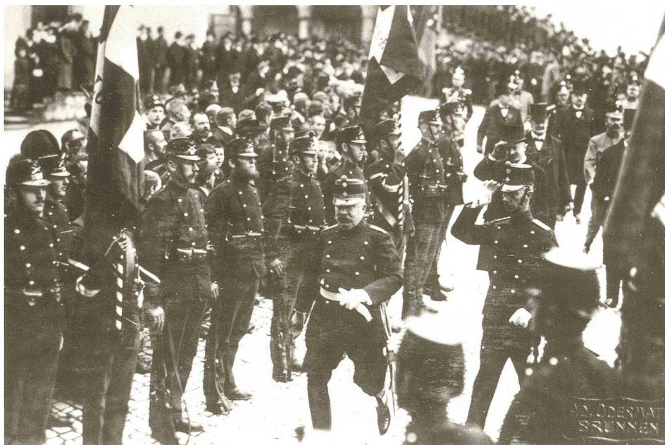
Abb. 5 General Ulrich Wille (1848–1925) anlässlich der Gedenkfeierlichkeiten am 14. November 1915 auf dem Hauptplatz in Schwyz. Mit Ehrenwache, Regimentsspiel und Fahnen-delegationen von mehreren Bataillonen zeigte das Militär hohe Präsenz. Der General nutzte das Morgartenjubiläum zur Propaganda für den Wehrwillen der Schweiz.

nach Zustimmung aller betroffenen Parteien – innerhalb weniger Tage zügig umgesetzt. Es standen dafür bis zum Jubiläum noch knapp zwei Wochen zur Verfügung!