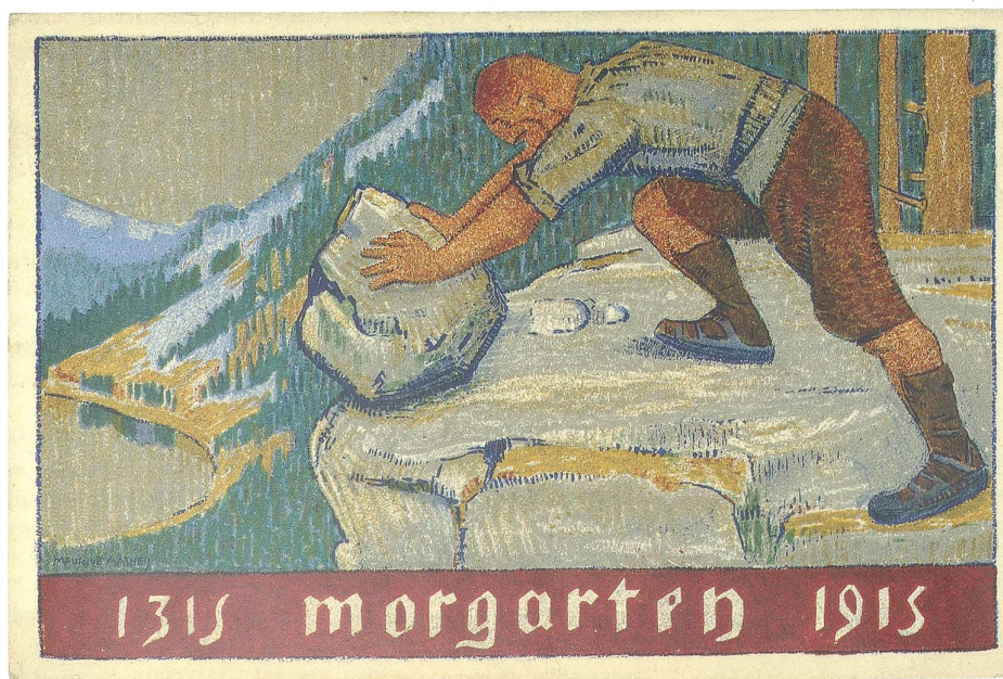
Abb. 1 Morgartenjubiläum 1915. Offizielle Postkarte, initiiert von einem welschen Hilfskomitee für den Kanton Uri. Das Motiv des erwachsenen und entschlossenen eidgenössischen Hirtenkriegers, das Vorbild der «Väter», stärkte die Moral der Truppen an der Grenze und der Daheimgebliebenen. Der Verkauf der Postkarten lief sehr gut: Die Zuger Morgartenkommission erhielt anstatt der bestellten 1000 Stück nur noch 400 Exemplare.

In den Jahren vor dem Krieg pflegte man eine andere Vision: An der Morgarten-Zentenarfeier 1915 sollte das erste monumentale Nationaldenkmal der Schweiz eingeweiht werden. Denn seit dem prächtig inszenierten 600-Jahr-Jubiläum des eidgenössischen Bundes im Jahr 1891 besass Schwyz Erfahrung in der Organisation grosser Staatsjubiläen. Damals war der Schwyzer Bundesbrief von 1291 neu zum Gründungsdokument der Schweiz erklärt worden. Die neue Erzählung der Befreiungstradition und die Festlegung eines Nationalfeiertages auf den 1. August entwickelte in der ganzen Schweiz eine integrative Wirkung, und Schwyz als einstiger Sonderbundskanton erhielt eine besondere Stellung in der nationalen Erinnerungs-