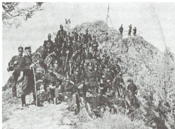
Abb. 10 Das Spiel des Landwehrbataillons 142 auf dem Belchen, 1915.

Nach dem Kriegseintritt Italiens waren vermehrt auch Zuger Wehrmänner an der Südgrenze im Einsatz. Die