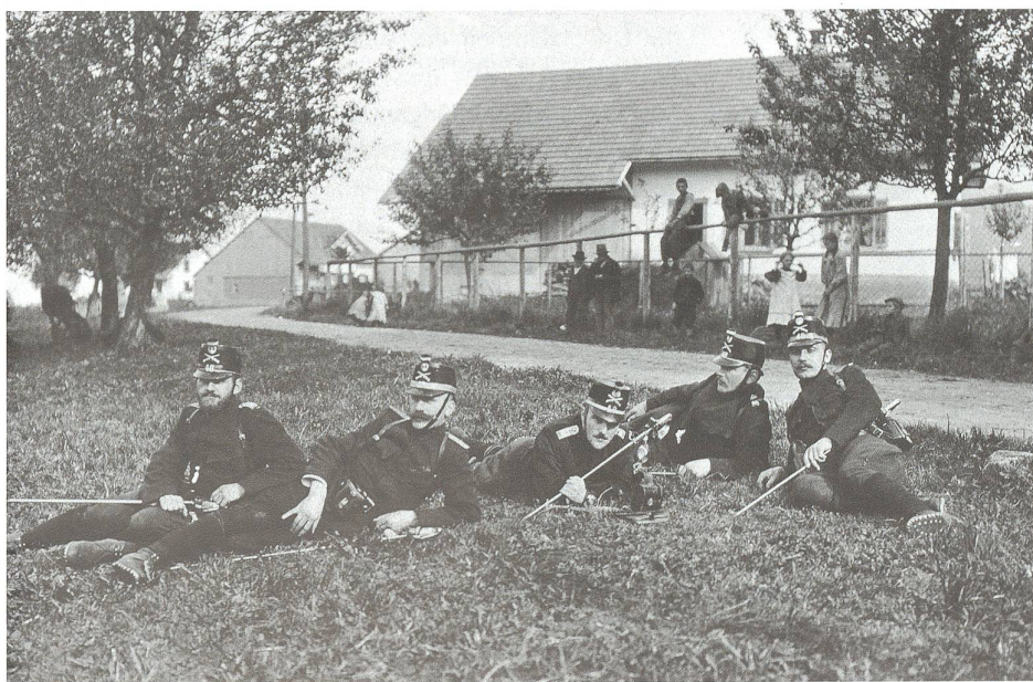
Abb. 1 Rastende Offiziere des Zuger Füsilierbataillons 48, vermutlich im Frühsommer 1915.

Nachdem die Westfront im Stellungskrieg erstarrt war, suchte Deutschland 1915 die Kriegsentscheidung im Osten und zog Verbände von der Westfront ab. Dadurch verlagerte sich das Schwergewicht des Kriegsgeschehens an die Ostfront, und für die Schweiz entspannte sich die strategische Lage. Neue Gefahr drohte der Schweiz im Südwesten durch den Kriegseintritt Italiens. Das Königreich hatte sich nach Kriegsausbruch am 3. August 1914 für neutral erklärt. Für die Schweiz bedeutete die Nichtteilnahme Italiens am Krieg vorerst eine militärische und wirtschaftliche Entlastung. Im Londoner Geheimvertrag vom 26. April 1915 erhielt Italien für den Fall eines Kriegseintritts auf der Seite der Entente weitgehende territoriale Zugeständnisse zulasten Österreich-Ungarns und des Osmanischen Reiches, unter anderem in der Nachbarschaft der Schweiz die Alpengrenze bis zum Brenner (Trient und Südtirol). Am 23. Mai erklärte Italien dem Kaiserreich