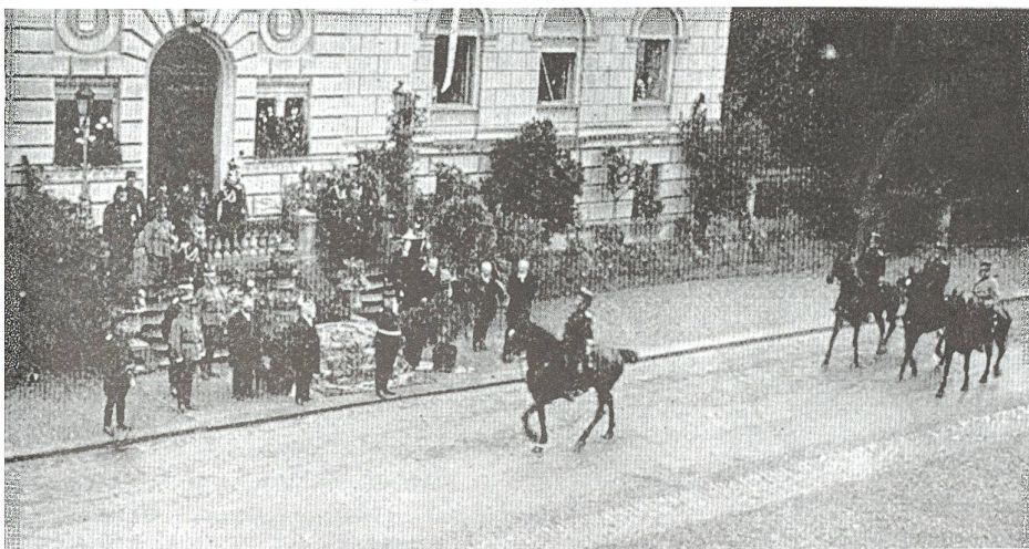
Abb. 2 Defilee des Zuger Füsiliersbataillons 48 vor General Ulrich Wille und der gesamten Regierung vor dem Regierungsgebäude in Zug am 19. Juni 1915.