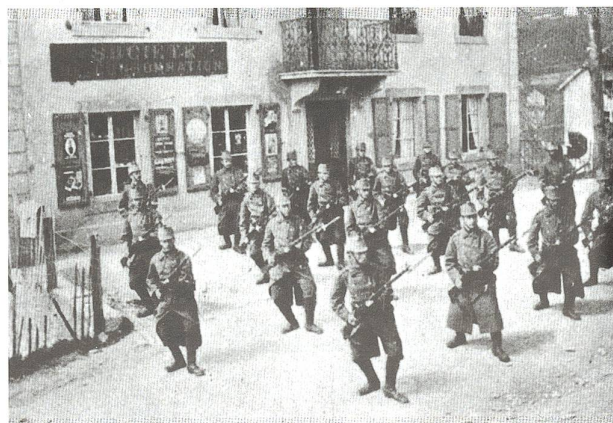
Abb. 3 Soldaten des Füsiliersbataillons 48 in einem jurassischen Dorf beim Üben des Bajonettfechtens, vermutlich 1915.

Am 1. Mai marschierte das Füs Bat 48 in einen neuen Einsatzraum, zuerst zurück in die Freiberge, in den Raum Saignelégier, wo am 8./9. Mai der erste Wochenendurlaub gewährt wurde. Dabei erlebten die Zuger Soldaten, wie ihre Kameraden von der 2. Division mit zahlreichen Sonderzügen in aller Eile ins Tessin verschoben wurden, um beim bevorstehenden Kriegeintritt Italiens bereitzustehen. Damit sicherte die 4. Division mit den Zugern allein die Nordwestgrenze. Nach einem mehrtägigen Gefechtsschiessen in Bellelay wurde das Bataillon in die Ajoie nahe an die deutsch-französische Front (Miécourt, Charmoille,