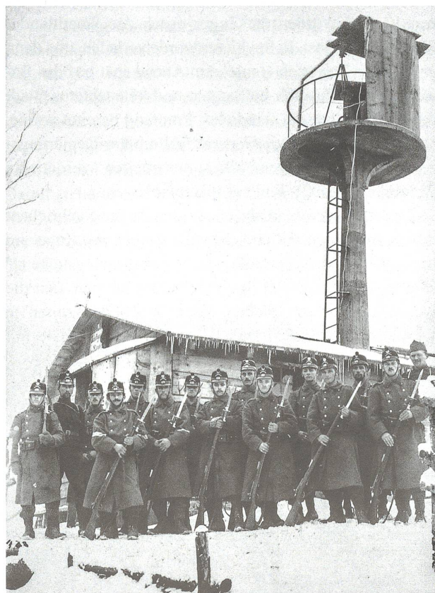
Abb. 7 Soldaten des Füsilierbataillons 48 beim Beobachtungsposten Rämel an der elsässischen Grenze bei Kleinlützel (Kanton Solothurn), 19. November bis 5. Dezember 1915.

Feld und erlebten kurz vor Weihnachten an vorderster Front französische Angriffe auf deutsche Stellungen, die im Zusammenhang mit dem letzten Grossangriff auf den Hartmannsweilerkopf in den Vogesen standen. Im Kanton Zug hatte sich ein Komitee «Soldaten-Weihnacht» gebildet, das bei der Bevölkerung um Weihnachtsgeschen-