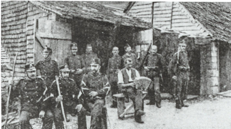
Abb. 8 Unteroffiziersposten des Landwehrbataillons 142 in Gwidem bei Langenbruck (Baselland), 1915.

ke als Geld- oder Naturalgaben bat. 21 Am 4. Januar 1916 löste die erste Urlaubsstaffel die zweite ab, die am 7. Januar entlassen wurde.