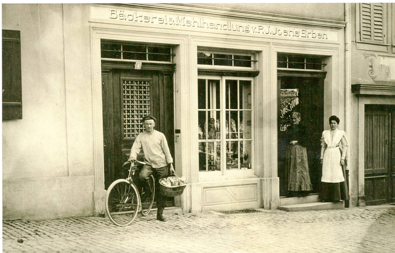
Bäckerei & Mehlhandlung P. J. Iten, Landsgemeindeplatz Zug, um 1910.