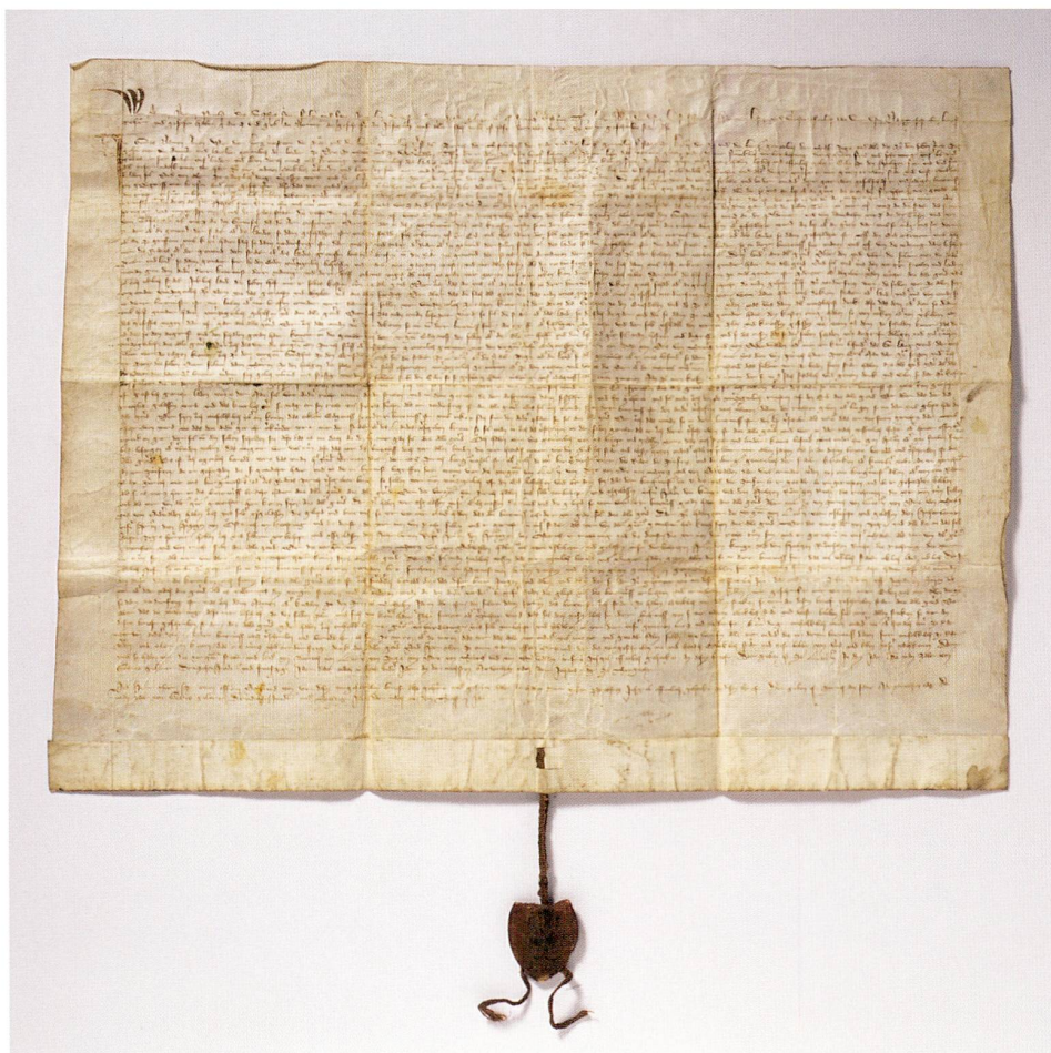
Abb. 1 «Zugerbund» von 1352. Schwyz liess sich 1366 die hier abgebildete amtlich beglaubigte Abschrift des «Zugerbundes», ein so genanntes Vidimus, ausstellen. Nur dank diesem Dokument kennen wir den ursprünglichen Wortlaut des Bundes mit Zug, denn als 1454 die eidgenössischen Bünde erneuert und den aktuellen Verhältnissen angepasst wurden, vernichtete man die Originale von 1352.

In der zugerischen Historiografie begann man sich schon bald nach Kriegsende, erstmals im Rahmen der Zentenarfeier von 1952, wieder mit dem Thema 1352 zu