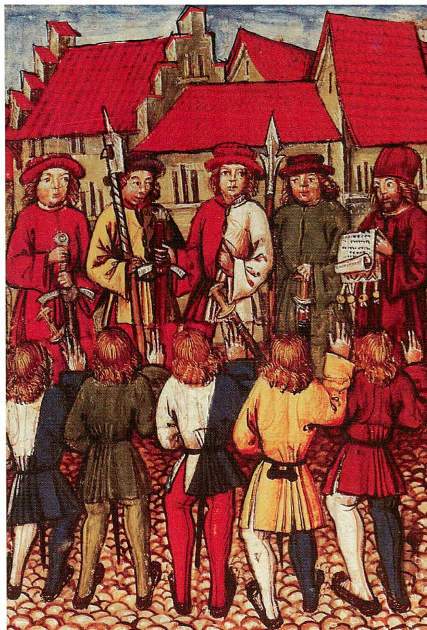
Abb. 3 Beschwörung eines Bündnisses. Darstellung in der Chronik von Diebold Schilling d. J., 1513. Zürcher Bürger beschwören das Bündnis mit den Inneren Orten vom 1. Mai 1351. Das ritualisierte, feierliche Ablegen des Eides, das andernorts genauso abließ, machte sie zu «Eid-Genossen», eine in dieser Zeit durchaus geläufige Bezeichnung für die Beteiligten eines Bündnisses.

tantierten. Das ausdrückliche Anerkennen der Rechtmässigkeit der habsburgischen Landesherrschaft hatte zudem den Zweck, im Hinblick auf eine potenzielle Herrschaftsablösung allfällige eigene Ansprüche zu legitimieren – ein Phänomen, dem wir bis weit ins 15. Jahrhundert immer wieder begegnen. Zudem deutet Einiges darauf hin, dass sich zumindest die eidgenössischen Orte in einer rechtmässigen Fehde wähten. 25