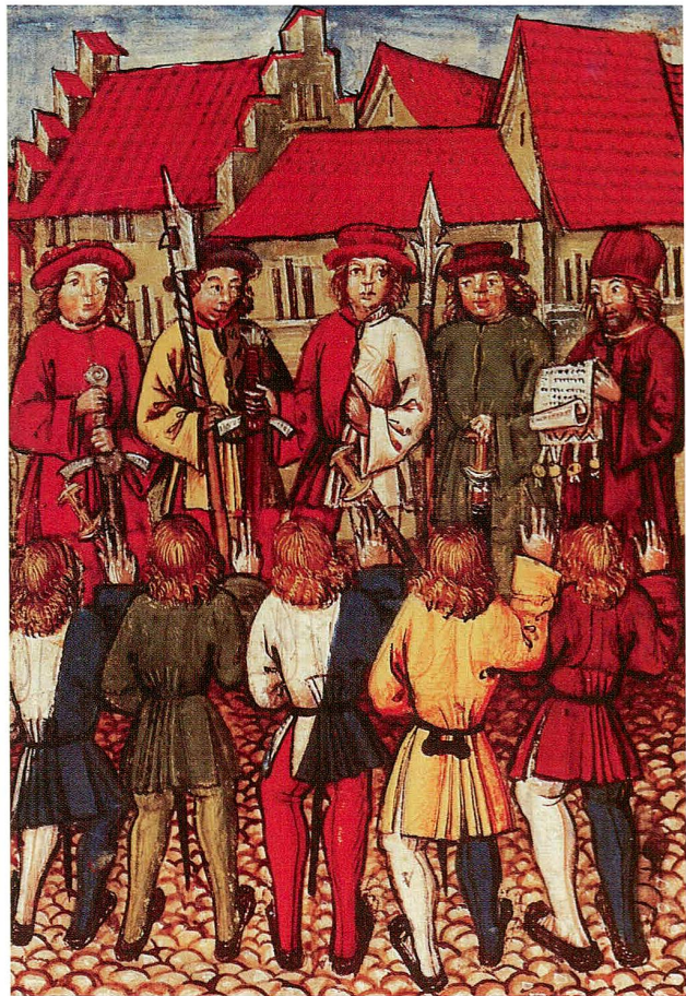
Abb. 3 Beschwörung eines Bündnisses. Darstellung in der Chronik von Diebold Schilling d. J., 1513. Zürcher Bürger beschwören das Bündnis mit den Inneren Orten vom 1. Mai 1351. Das ritualisierte, feierliche Ablegen des Eides, das andernorts genauso ablief, machte sie zu «Eid-Genossen», eine in dieser Zeit durchaus geläufige Bezeichnung für die Beteiligten eines Bündnisses.

tantierten. Das ausdrückliche Anerkennen der Rechtmässigkeit der habsburgischen Landesherrschaft hatte zudem den Zweck, im Hinblick auf eine potenzielle Herrschaftsablösung allfällige eigene Ansprüche zu legitimieren – ein Phänomen, dem wir bis weit ins 15. Jahrhundert immer wieder begegnen. Zudem deutet Einiges darauf hin, dass sich zumindest die eidgenössischen Orte in einer rechtmässigen Fehde wähten. 25