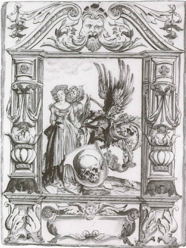
Abb. 4 Ofenkachel mit Darstellung der Vergänglichkeit des Lebens (nach Dürers Kupferstich «Wappen der Vanitas») aus der Hafnerei Keiser. Fayence, bemalt, um 1880.