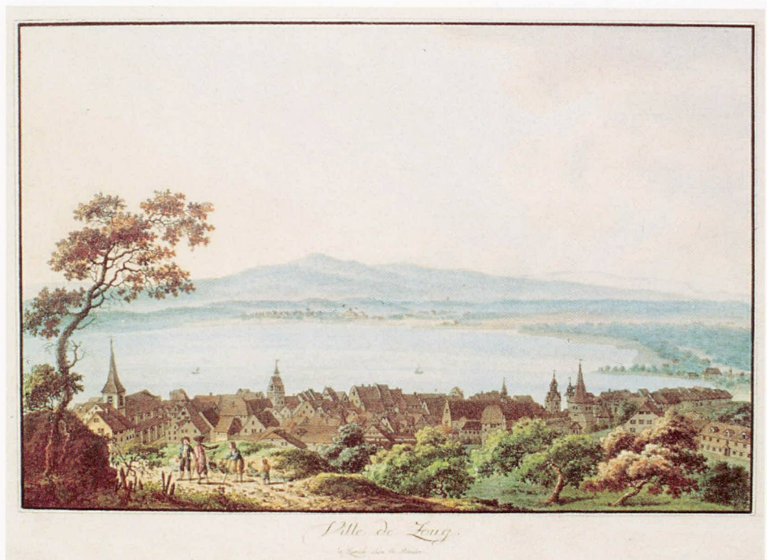
Abb. 6 Ansicht der Stadt Zug von Osten, um 1785. Kolorierte Umrissradierung von Johann Heinrich Bleuler oder Heinrich Thomann.