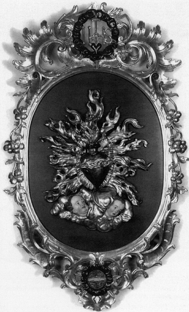
Abb. 3 Herz Jesu, Holzrelief in Rahmen, 18. Jh.

figuren, das Salzburger Lorettockindlein und das Prager Jesulein, das bekannteste aller Jesuskind-Gnadenbilder.