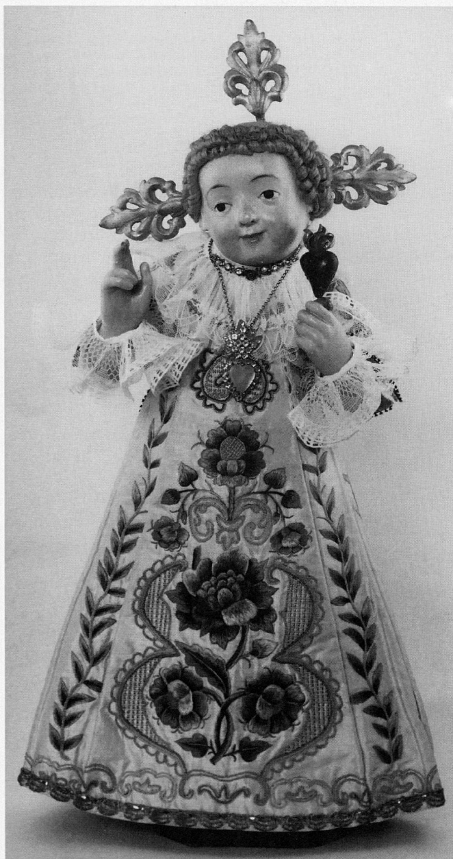
Abb. 2 Christkind, sogenannter «Seelenbräutigam», 17. Jh. und spätere Zutaten. Kloster St. Anna, Gerlisberg/Luzern.

Einige der Jesuskindfiguren wurden zu Gnadenbildern, nachdem sie nach Auffassung der Gläubigen Wunder gewirkt hatten. In der Ausstellung waren drei dieser Gnadenbilder ausführlich dokumentiert: Das Sarner Christkind, eine der ältesten überlieferten mittelalterlichen Jesuskind-