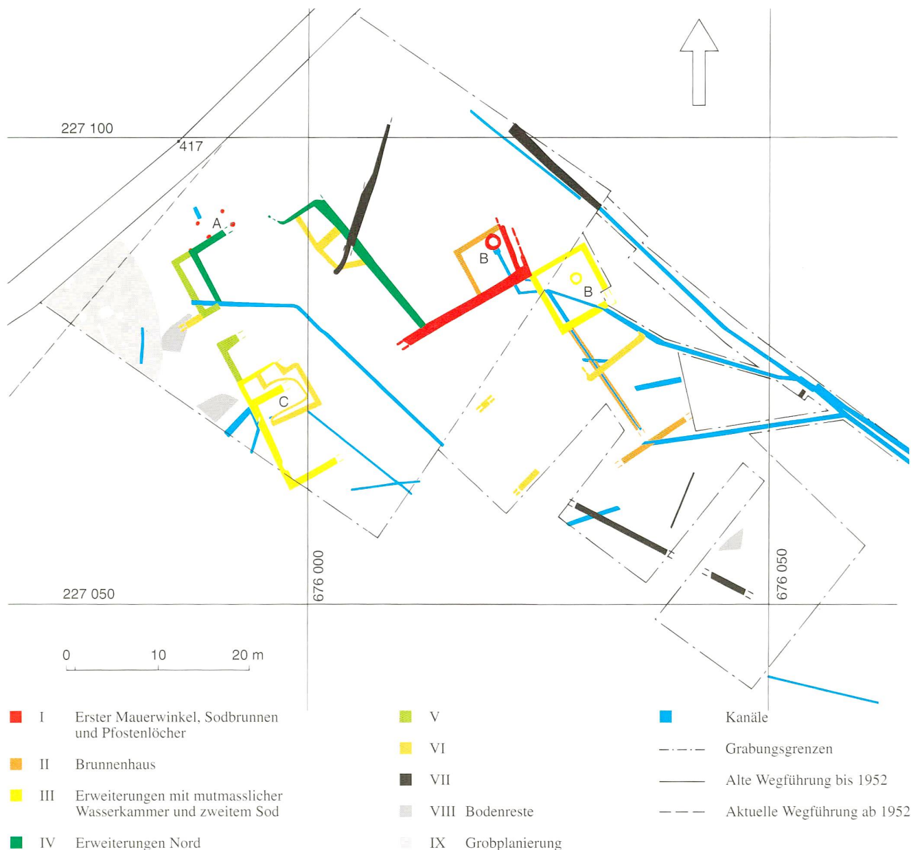
Abb. 2 Cham, Lindenham-Heiligkreuz, Römischer Gutshof. Bauphasenplan 1993.

auch Vermessungshinweise zur Lage im Gelände. Ebenso konnten die einzelnen Befunde nicht voneinander unterschieden werden: der Planinhalt blieb vorerst nahezu unverständlich. Weil aber römische Besiedlungsreste im Kanton Zug bis jetzt nicht gut belegt sind, massen wir den beiden Grabungsaufnahmen, auf brüchig-sprödem Transparentpapier, trotz ihres mangelhaften Zustandes