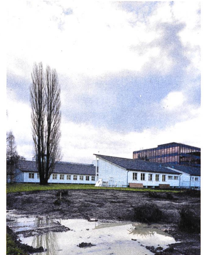
Soon the fox has to leave.