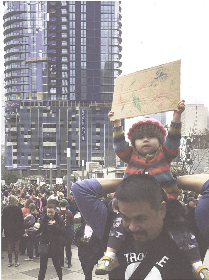
fig. a Women's March, photographed by Jenny Sowry, 2017