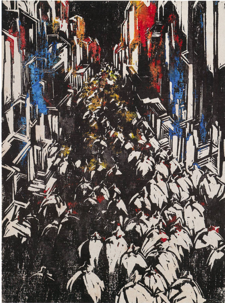
Linoldruck V/2 schwarze Stempelfarbe und Linolfarbe auf Papier s/w 2014, coloriert 2016