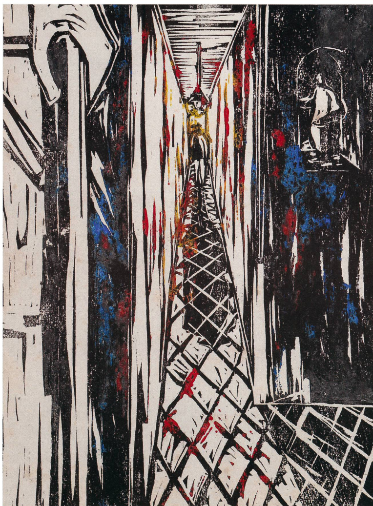
Linoldruck V/6 schwarze Stempelfarbe und Linolfarbe auf Papier s/w 2014, coloriert 2016