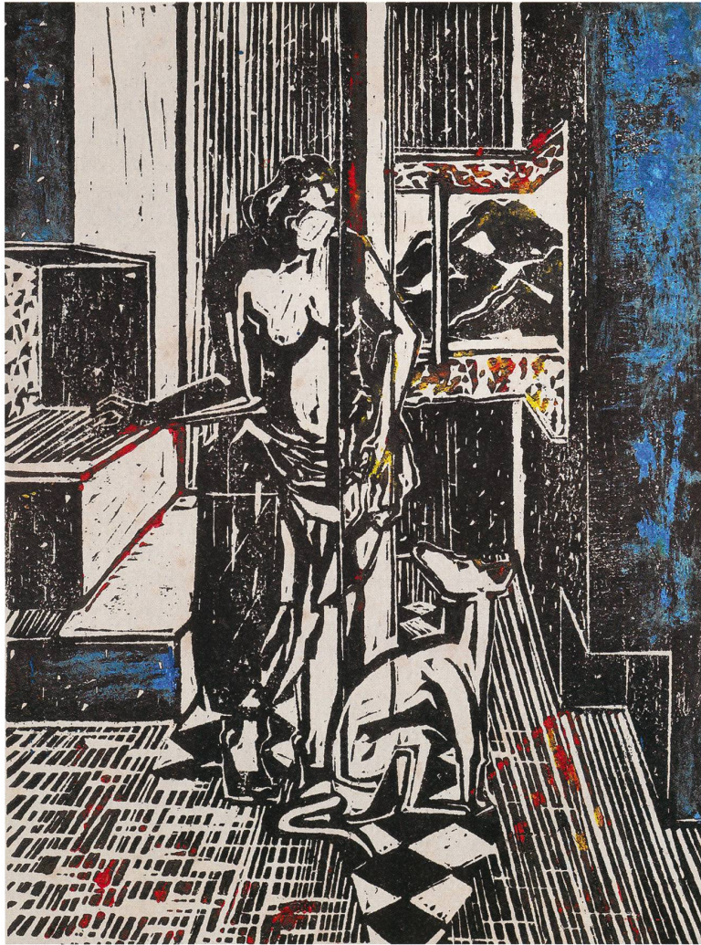
Linoldruck IV/2 schwarze Stempelfarbe und Linolfarbe auf Papier s/w 2014, coloriert 2016