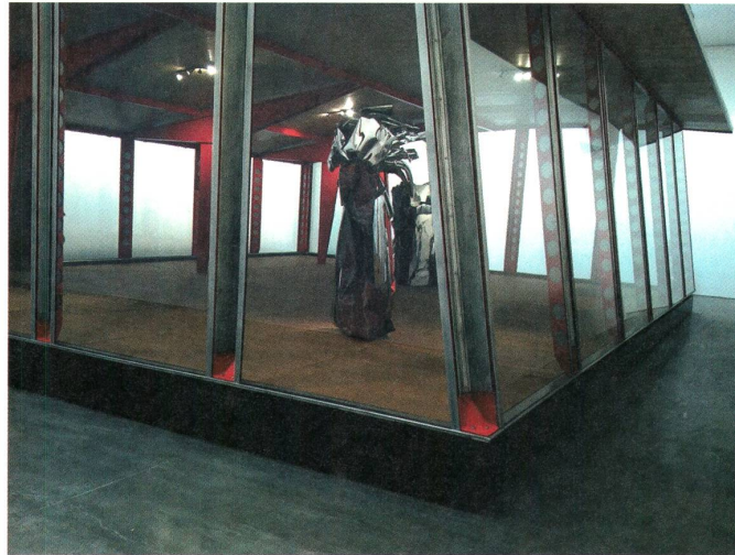
Fig. c Jean Prouvé, ›Maison Démontable 6x6‹ in einer Adaption von Richard Rogers, Galerie Patrick Seguin, Installationsansicht der Messe DesignMiami in Basel, Juni 2015.

Auf der Basler Messe war es der Hotelier Balasz als ›Kurator‹, dem das Wort erteilt wurde, um das ökonomische Setting, das auf diesem Umschlagplatz sozialer Kontakte vertreten wird, symbolisch aufzufüllen. Mit oberflächlich auf Bildung angelegten Projekten, um im Marktkontext die Verkaufsabsichten zu transzendieren, werden Bedeutungsblasen geschaffen, die schnell platzen, sobald die Besucher an mehr interessiert sind, als Ausstellungen, in denen sich lediglich eine intuitive