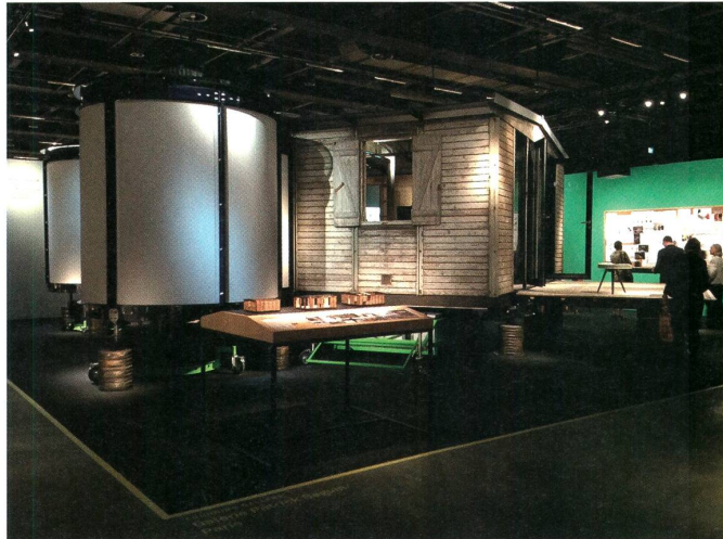
fig. b Jean Prouvé, ‹Maison Démontable 6x6› in einer Adaption von Richard Rogers, Galerie Patrick Seguin, Installationsansicht der Messe DesignMiami in Basel, Juni 2015, Foto: Martin Hartung.

als geeignet ist, um die Vorlage für Flüchtlingsbehauungen zu bieten, sondern ging 1944 aus der Notwendigkeit hervor, praktikable Obdachlosenbehauungen in den französischen Gemeinden Lorraine und Franche-Comté im Zuge des Zweiten Weltkrieges bereitzustellen. Inwieweit kann nun eine ästhetizistische Objektifizierung, die etwa das leuchtende Blau der Rogers/ Harbour-Adaption signalisiert, wirklich dem Erbe des Prouvé-Designs Genüge tun, um das es dem Galeristen offenbar immer wieder geht? Oder weiter gefragt: