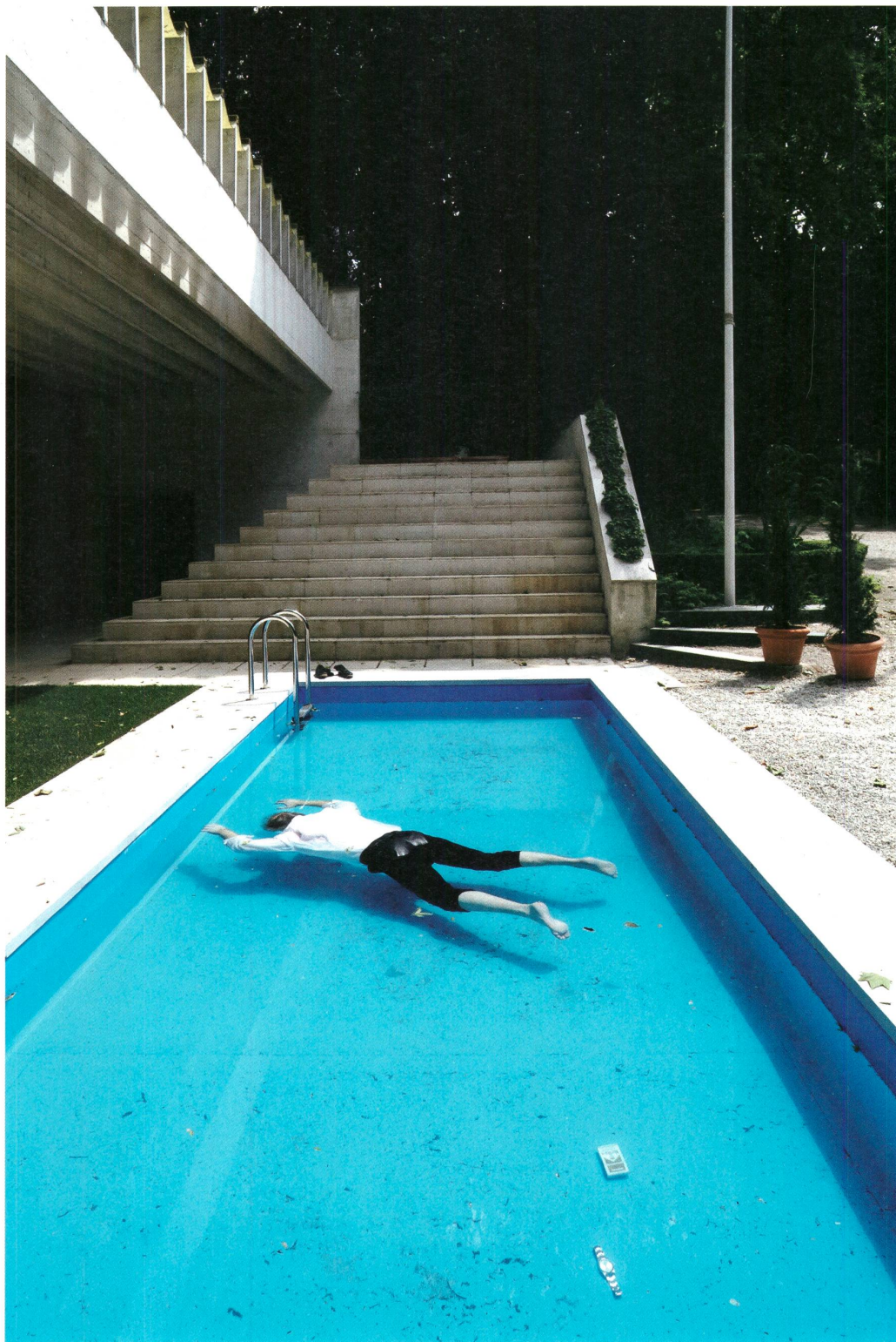
Elmgreen & Dragset Death of a Collector, 2009.