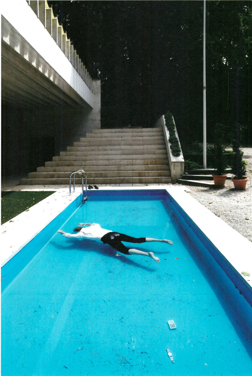
Elmgreen & Dragset Death of a Collector, 2009.