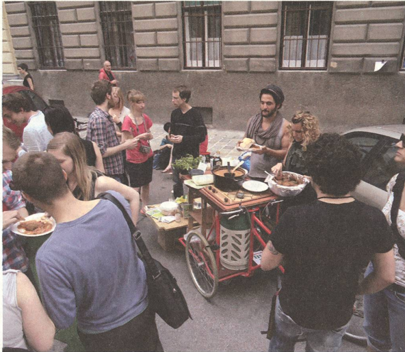
fig. e Gehsteigfest der Gehsteig-Guerrilleros in Wien. Beitrag mit der Mobile Kitchen 2010, integriert in ein Fahrrad zur komfortablen Wohnraumverlagerung. Die Küche, jederzeit mit dabei!

diesen Prozessen teilzunehmen und den gegebenen Raum eben nicht als solchen zu akzeptieren, sondern diesen weiter zu denken und mitzugestalten. Der Zwischenraum, der die grosse Möglichkeit zufälligen Aufeinandertreffens, Zusammenkünfte und spontaner Kommunikation ist, sollte endlich als solcher erfahrbar gemacht werden. Kleinstinterventionen, wie das Erproben des öffentlichen und allgemein zugänglichen Kochens oder das Austeilen verbindender Sitzmöglichkeiten in Form von Rasenpuzzles, sollten dies aufzeigen und Unorte lebhafter gestalten.