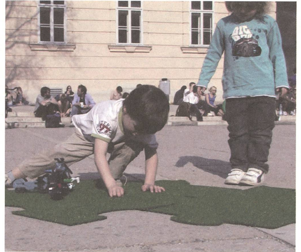
fig. d Urban Puzzle – Frame aus ImplanTat der Film, April 2009 im Museumsquartier in Wien.

Durch Urbanisierung und Globalisierung veränderten sich in den letzten Jahrzehnten Lebensstile und Bedürfnisse der städtischen Bevölkerung. Gleichzeitig veränderten sich auch architekturtheoretische Auffassungen von Lebensraum, städtischem Raum, und in der Folge von Raum an sich. Es werden neue Wege gegangen, die jenseits der Akzeptanz von einseitig Geplantem liegen. Nicht nur Architekten denken Raum. Unterschiedlichste Disziplinen der Kunst- und Geisteswissenschaften befassen sich mit der Thematik, wirken gemeinsam in neue partizipative Richtungen und beeinflussen dadurch ebenfalls die Auffassung von Raum. Öffentliche Interventionen in urbanen Regionen, Stadtzentren und Dörfern beginnen eine Bandbreite zu erreichen, welche massgebliche Wirkungen nach sich ziehen. Die Bevölkerung wird aufgefordert, aktiv an