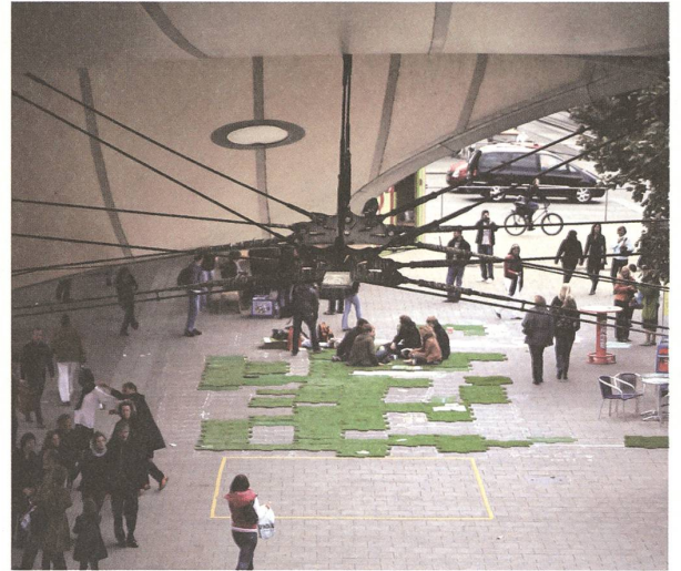
fig. a Wien lebt! – Vielfalt Stadt Einfalt – Festival am Urban Lortz in Wien. Urban Puzzle Beitrag von ImplanTat zur Bewusstmachung eines Transitraumes.

Die Konsequenz führt zur Erkenntnis, dass es nicht der Stadtbewohner in der Hand hat, sich seinen Alltag mit dem Allgemeinraum zu verschönern, sondern dass auch