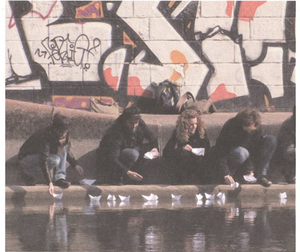
fig. f Touch the River – Papierboote als Kleinstintervention zum in Kontakt treten mit dem Wasserraum in der Stadt.

Es ist die Urbane Fiktion, die erschaffen werden soll, um das Nutzungspotenzial von Unorten aufzuzeigen und von beiden Seiten her, der politischen und der informellen Seite, anzunehmen. Für ImplanTat deutet der Begriff Fiktion auch auf Science Fiction hin, die eng mit Naturwissenschaften, Technologie, Innovation und Erfindung verbunden ist. Dadurch werden physische und immaterielle Bedingungen möglicher zukünftiger, partizipativer Urbanitäten auf intermedialer und interdisziplinärer Ebene thematisiert und diskutiert. Dieses Anliegen einer kollektiven partizipativen Gestaltungskonzeption ist gleichzeitig der Ansatz, mit dem die Veranstaltung entworfen wird und damit das Konzept ins Programm überführt. Ein Event in unterschiedlichen Dimensionen: In der Stadt, im öffentlichen Raum und in uns; vielleicht sind alle diese Dimensionen Dialekte ein und derselben Sprache.